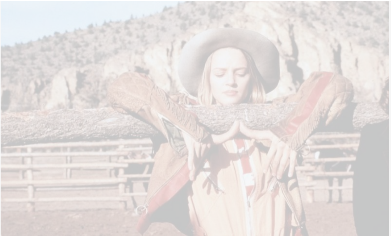
Ума Турман в фильме «Даже девушки-ковбои иногда грустят», 1993 год

Не обошли списки бестселлеров и другие романы Роббинса: «Натюрморт с дятлом» (1980), «Джазовые духи» (1984), «Тощие ножки и не только» (1990), «Сонные глазки и пижама в лягушечку» (1994), «Свирепые калеки» (2000), «Вилла „Инкогнито“» (2003).