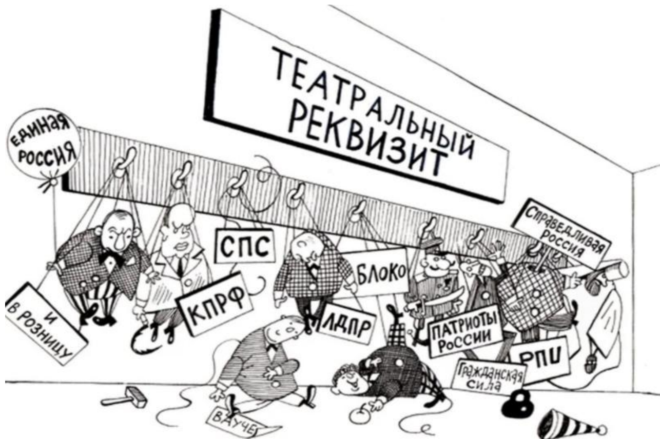
Фото: t.me/NeNASHI , sun9-5.userapi.com

Автор: Кирилл Богданович © Babr24.com Источник: https://t.me/aksutenko ПОЛИТИКА, КРАСНОЯРСК 80 06.02.2025, 12:49 2