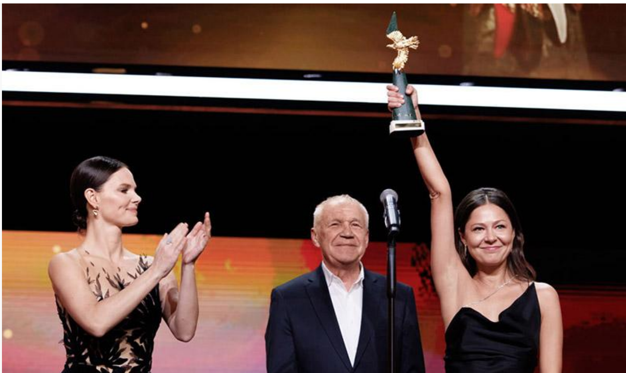
Елена Лядова с премией «Золотой орёл»