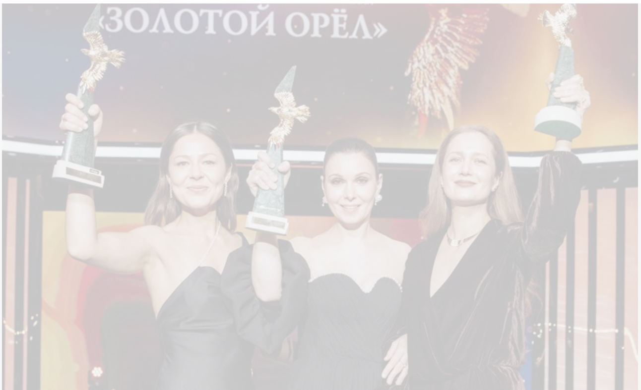
Елена Лядова, Александра Урсуляк и Виктория Исакова с премиями «Золотой орёл»

Почётный приз «За выдающийся вклад в российский кинематограф» из рук главы «Мосфильма» Карена Шахназарова получил композитор Алексей Рыбников , написавший музыку более чем к ста фильмам, среди которых «Приключения Буратино», «Про Красную Шапочку», «Усатый нянь», «Тот самый Мюнхгаузен», «Вам и не снилось», «Через тернии к звёздам», «Андерсен. Жизнь без любви», «Повелитель ветра».