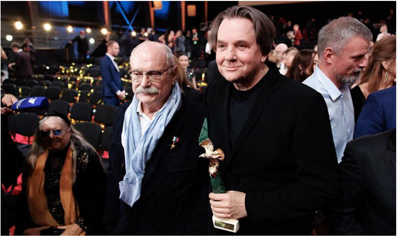
Никита Михалков и Константин Эрнст на церемонии вручения премии «Золотой орёл»

Итак, лучшим фильмом 2024 года академики признали военную драму Германа-младшего «Воздух» (продюсеры – Константин Эрнст и Артём Васильев).