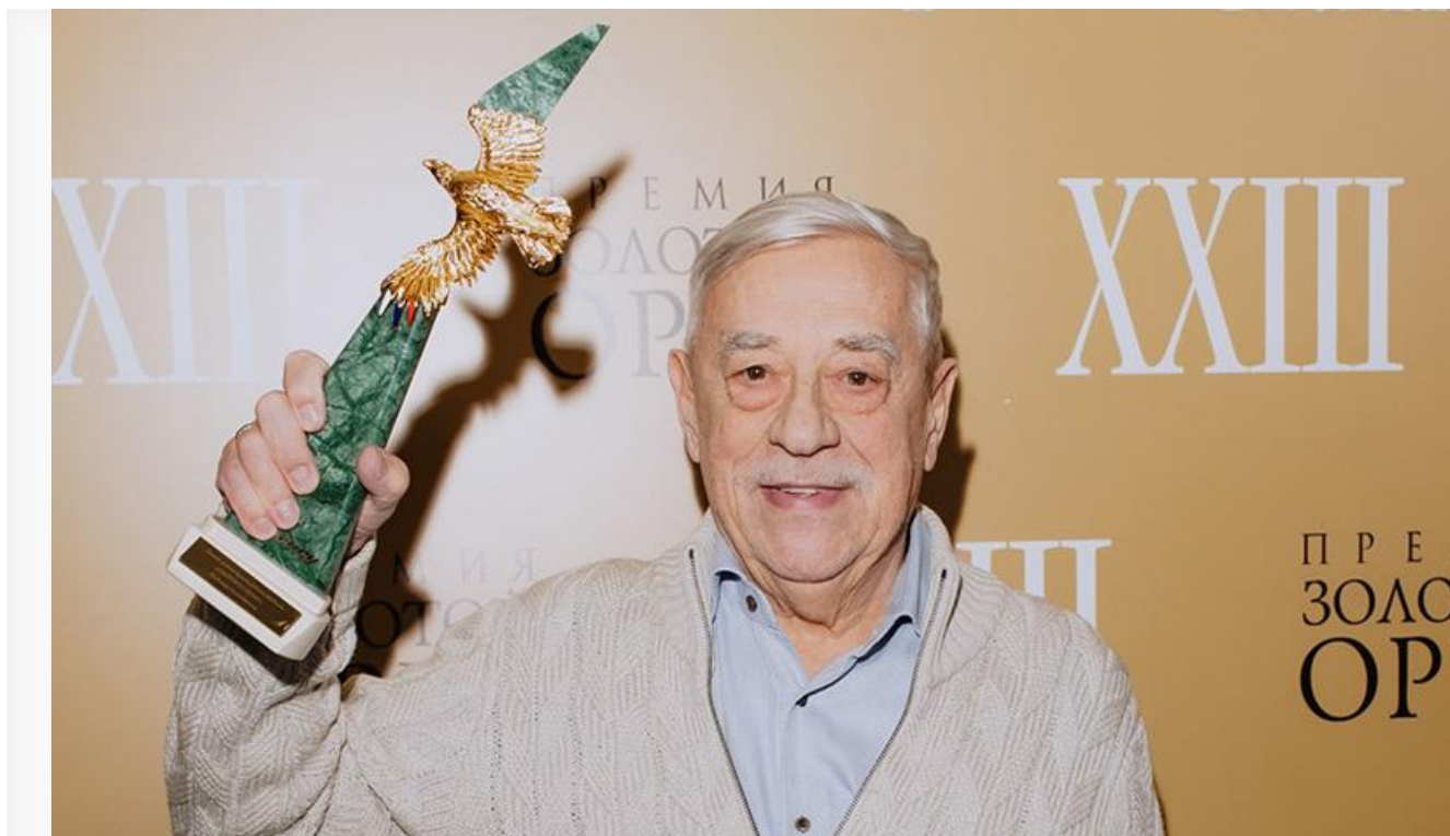
Владимир Грамматиков с премией «Золотой орёл»

Получил премию и режиссёр «Смотри на меня!» Владимир Грамматиков . Очередной парадокс, когда лучший режиссёр снял не лучший фильм с лучшей актрисой в главной роли.