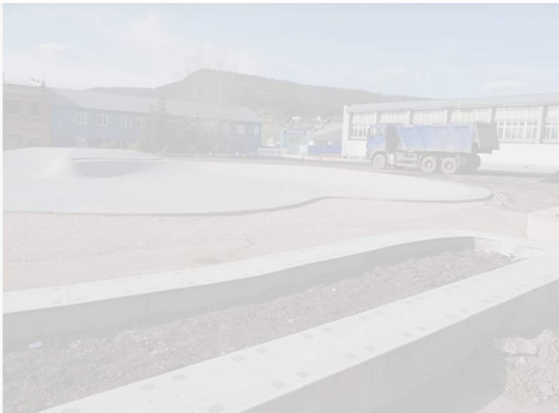
То самое общественное пространство, о котором идет речь, – скейт-парк в микрорайоне Речники

Уголовное дело, завершившееся громким судебным решением, уходит корнями в 2019 год. Тогда, как выявило следствие, при выполнении муниципального контракта на благоустройство общественной территории глава города подписал акты приемки выполненных работ, несмотря на их неполное выполнение и несоответствие проектной документации. Эти действия нанесли ущерб региональному и местному бюджетам на сумму более пяти миллионов рублей.