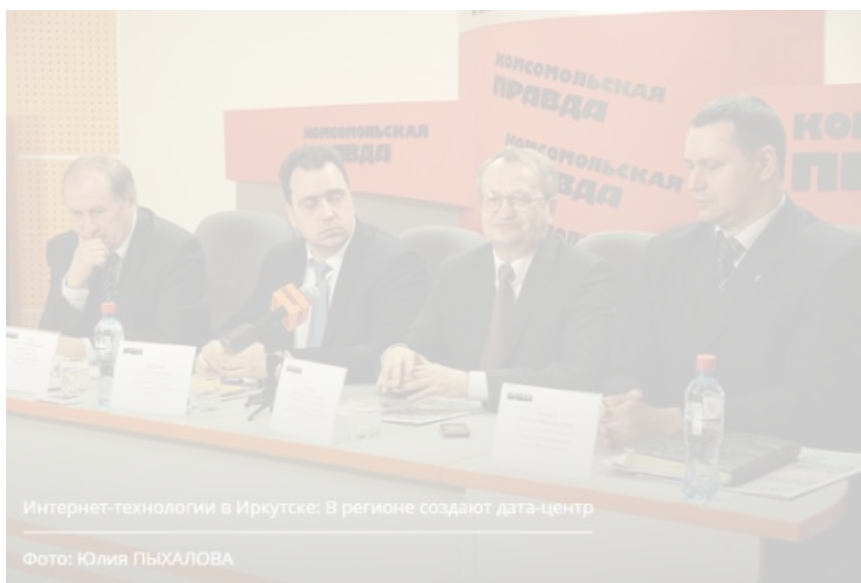
Интернет-технологии в Иркутске: В регионе создают дата-центр