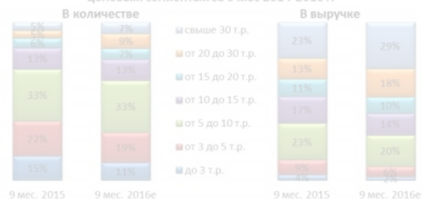
График 8. Динамика продаж на российском рынке СМ по ценовым сегментам за 9 мес 2014-2016 гг