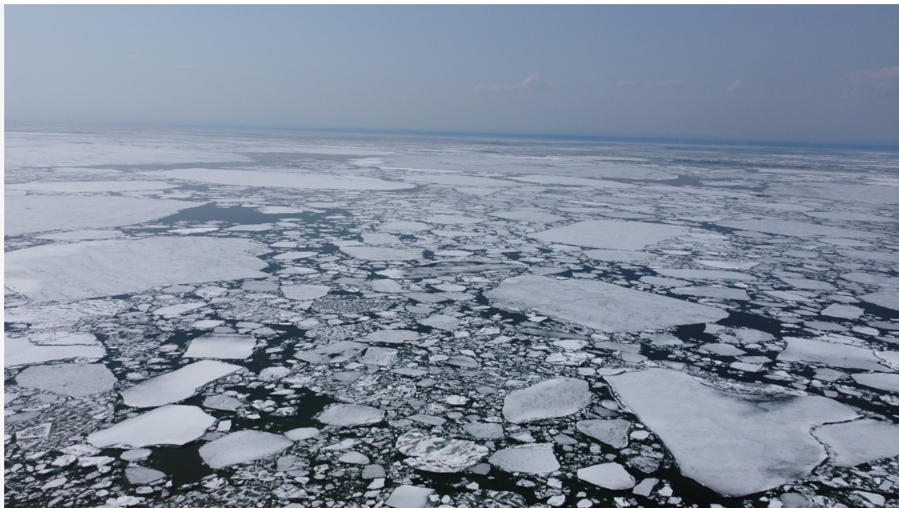
Автор: Аксель Дронов Фото из альбома "Байкал. Виды - зима" © Фотобанк "RuBabr"

5 января, ещё до того, как лёд окреп, в поселке Большое Голоустное местные предприниматели устроили прокат коньков прямо на тонком льду, рядом с запрещающим знаком. Это, конечно, тоже не могло обойтись без последствий: лёд на Байкале местами ещё даже не сформировался, а там, где он уже есть, его толщина зачастую не превышает нескольких сантиметров. Теперь владельцам незаконного бизнеса предстоит ответить за свою деятельность перед законом.