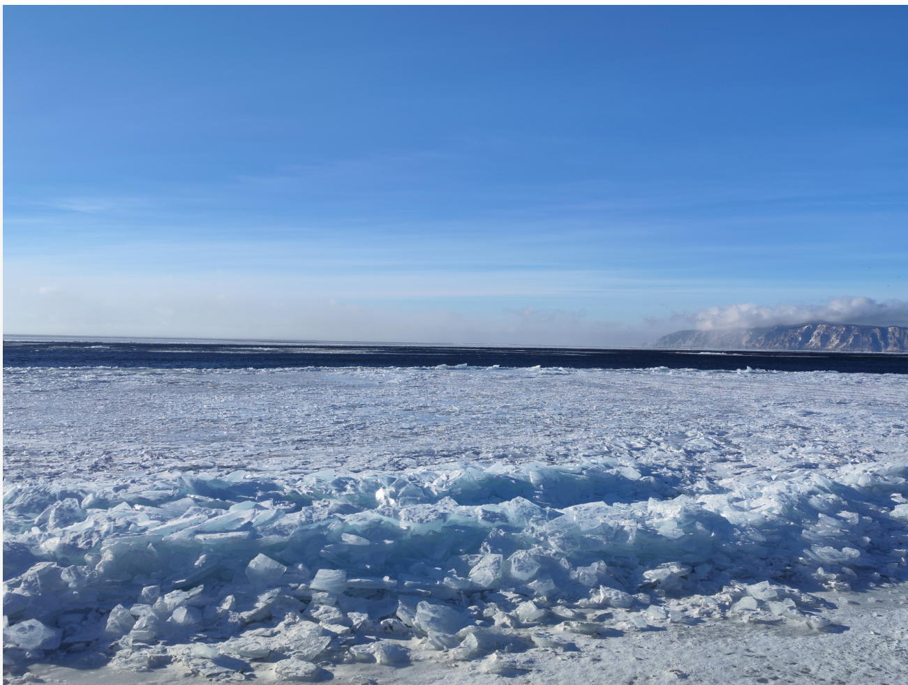
Автор: Алёна Штерн Фото из альбома "Байкал. Виды - зима" © Фотобанк "RuBabr"

Ирония в том, что все эти истории сопровождаются постоянными предупреждениями. Спасатели из Байкальского поисково-спасательного отряда МЧС не устают говорить: «Лёд ещё не сформировался!» Например, на юге Байкала ледообразование в январе проходит медленно, и даже у берегов толщина льда редко превышает 3–5 сантиметров. На севере и в районе Малого моря льда практически нет, но это не мешает людям выходить на лёд, ездить по нему на машинах и кататься на коньках.