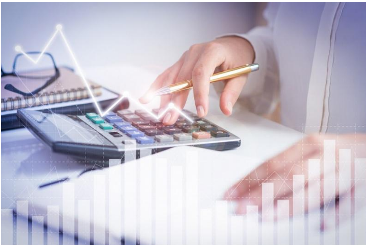
Фото: ru.freepik.com .

Автор: Андрей Воронецкий © Babr24.com ЭКОНОМИКА И БИЗНЕС, ОФИЦИОЗ, ТОМСК 👁 4844 24.01.2025, 09:25 📄 27