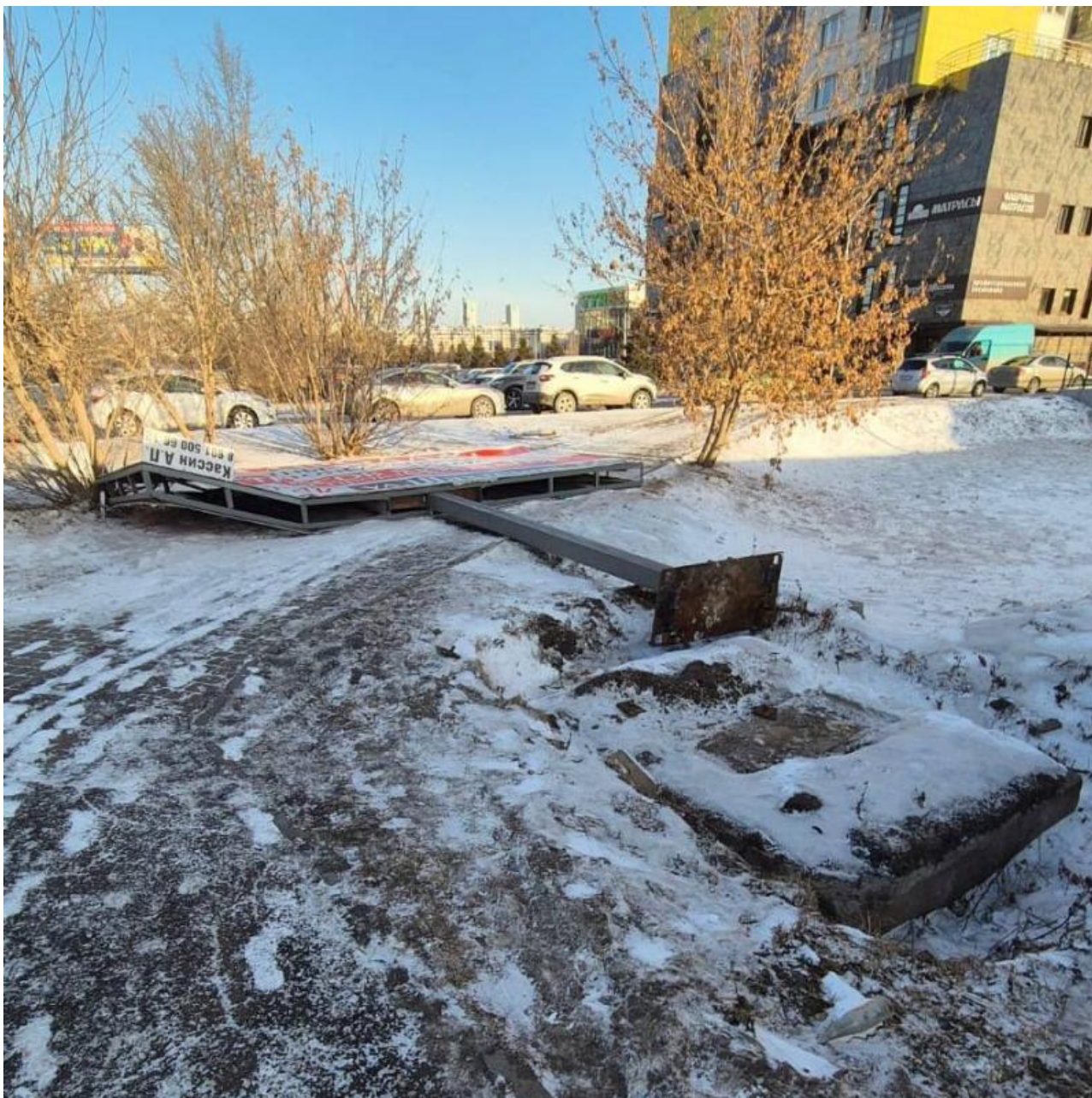
Фото: t.me/krpronws , t.me/borus_people

Автор: Анна Роменская © Babr24.com ОБЩЕСТВО, ПРОИСШЕСТВИЯ, КРАСНОЯРСК 👁 2242 23.01.2025, 20:14 👍 37