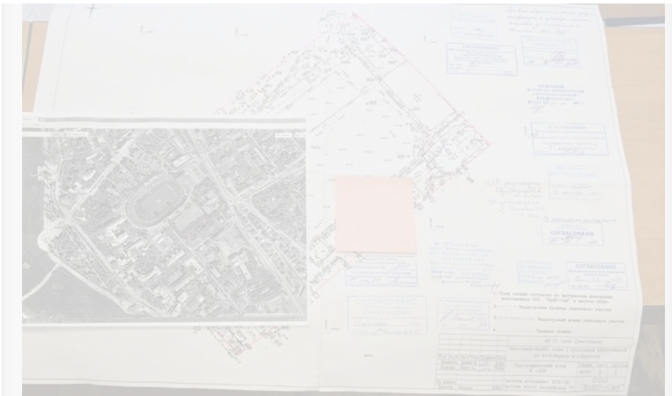
Фото, опубликованное в телеграм-канале `Говорит Степанов`, указывающее на смену категории назначения земель малого поля `Труда`