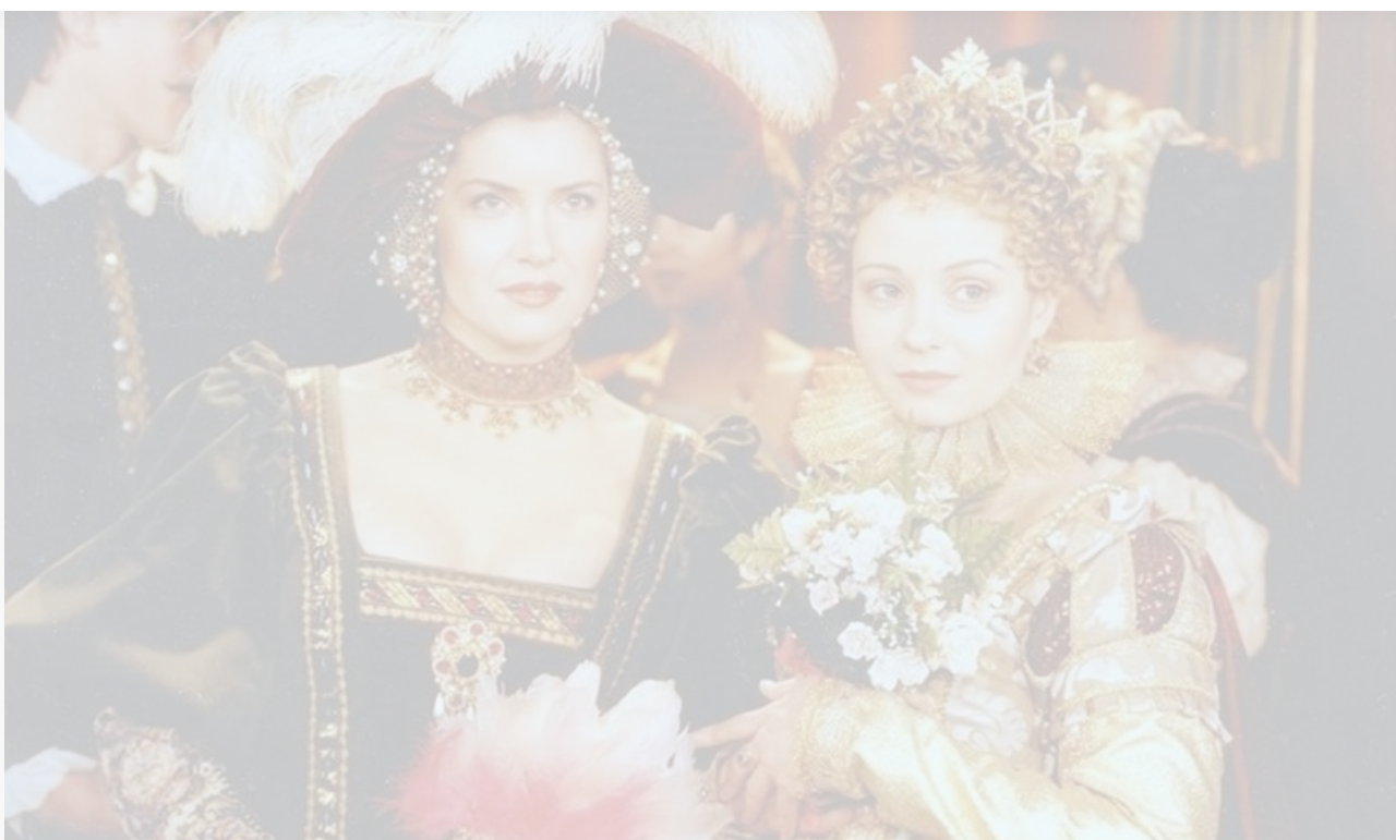
Маргарита де Валуа в фильме «Королева Марго», 1996 год