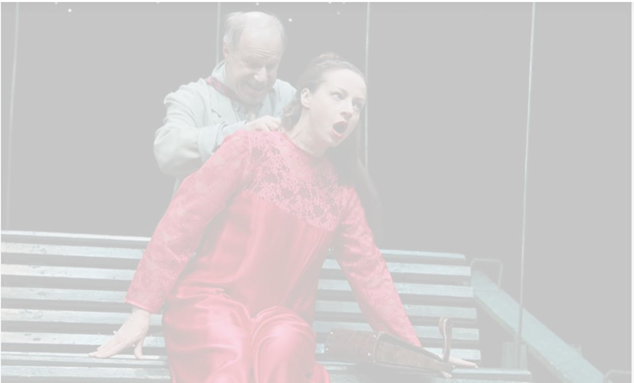
Улита в спектакле «Лес». МХТ имени Чехова, постановка 2004 года