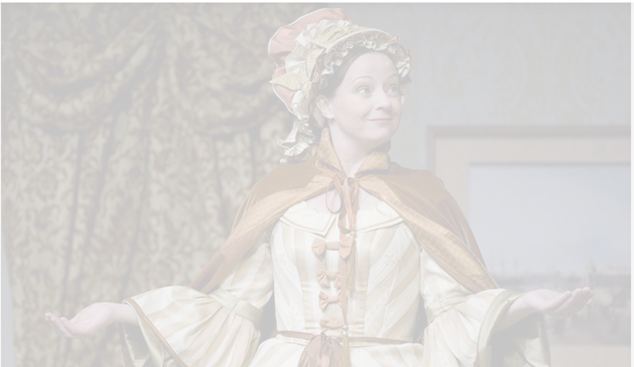
Фёкла Ивановна в спектакле «Женитьба». МХТ имени Чехова, постановка 2010 года

Женщин после сорока ни драматургия, ни кино, ни телевидение обычно не замечают. Их проблем будто бы не существует.