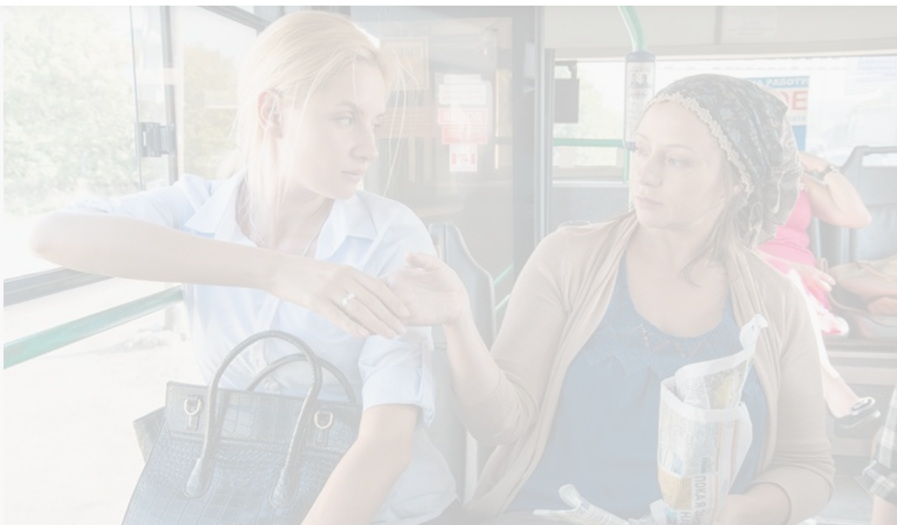
Клавдия в фильме «Идеальная жертва», 2015 год

Никто не знает, где окажется завтра. И об этом нужно помнить и взрослым, и молодым, которые порой не хотят думать о том, какие проблемы их ждут впереди.