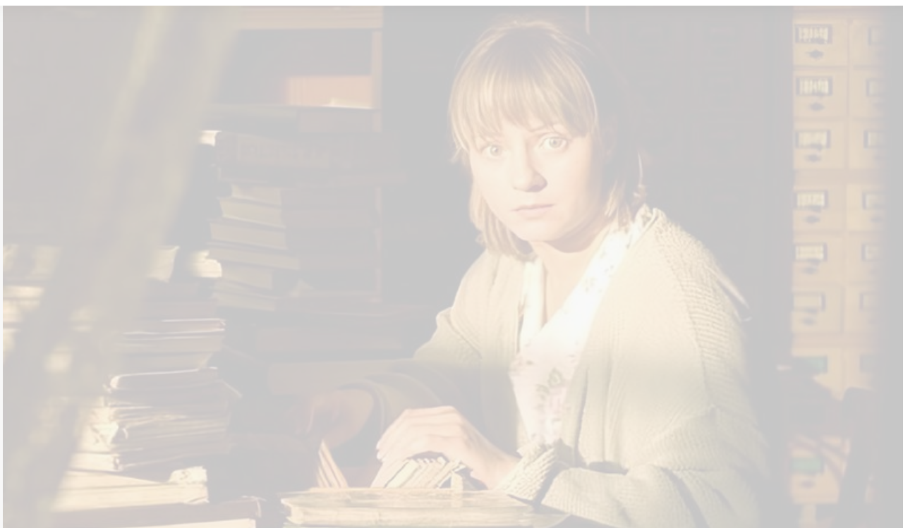
Люба в фильме «Механическая сюита», 2001 год

Если честно, очень сложно видеть себя на экране, когда ты с детства снимаешься. Ты видишь, как стареешь.