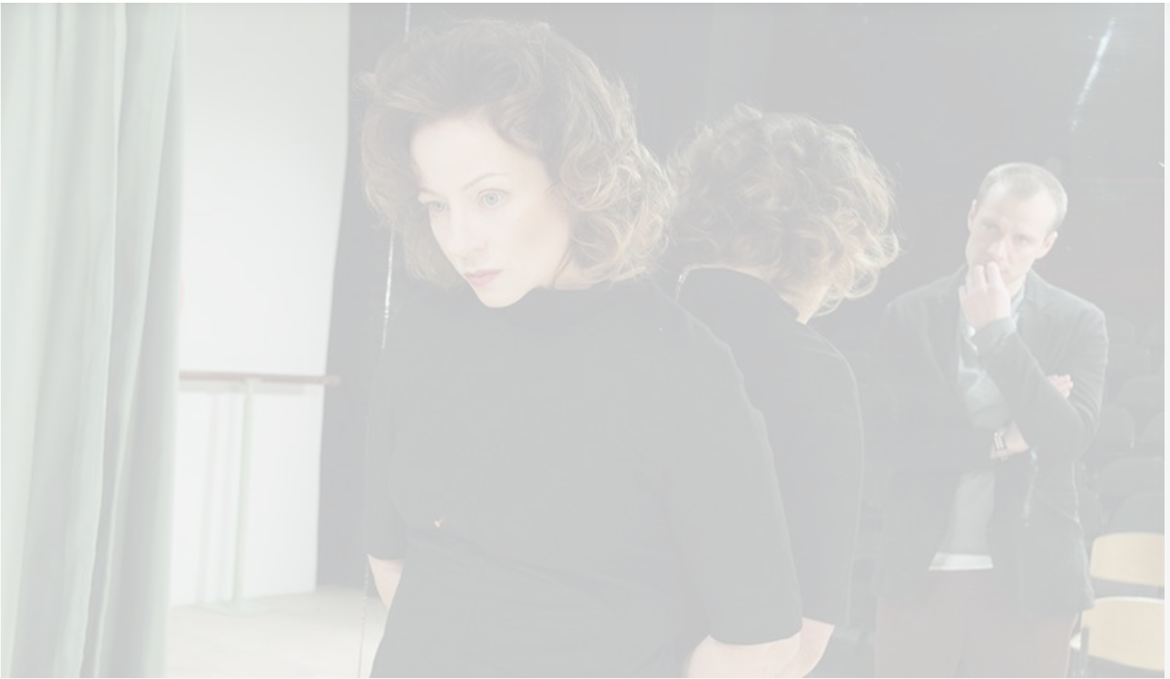
В спектакле «Предел любви». МХТ имени Чехова, постановка 2012 года