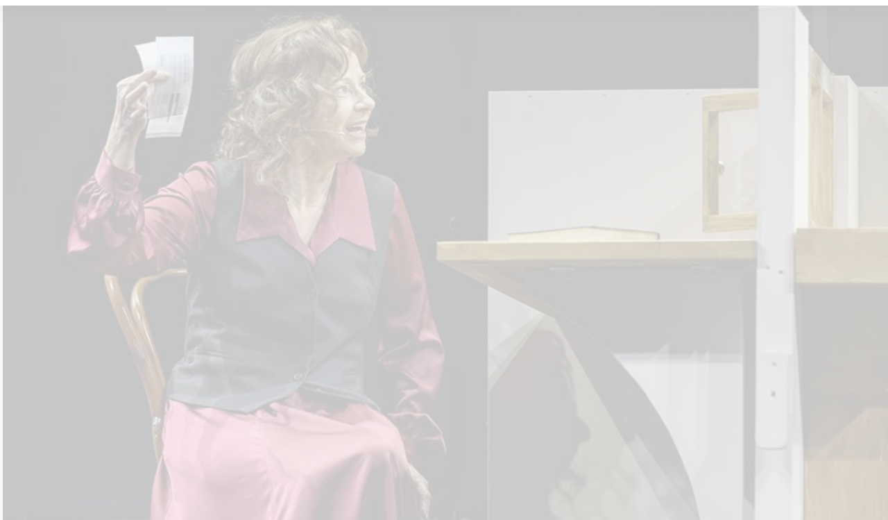
Кассир в спектакле «9 ряд. 10, 11 место». МХТ имени Чехова, постановка 2023 года