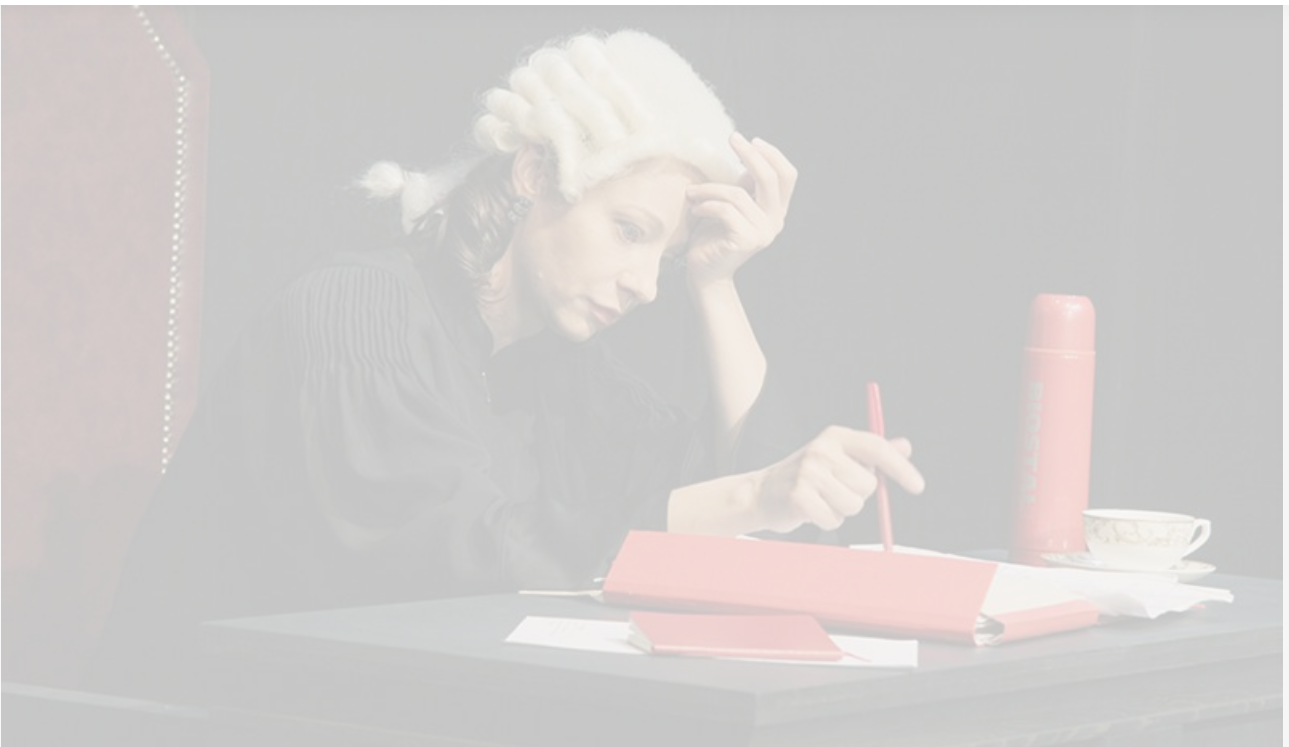
Прокурор Майерс в спектакле «Свидетель обвинения». МХТ имени Чехова, постановка 2012 года

Сойти с ума очень просто, а вот держать себя в руках – это большой труд.