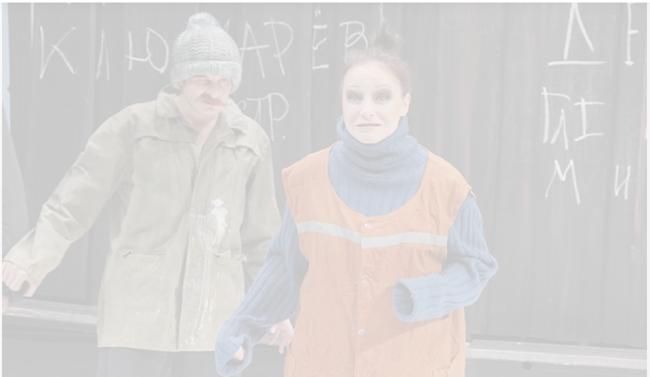
Любка в спектакле «Деревня дураков». МХТ имени Чехова, постановка 2014 года