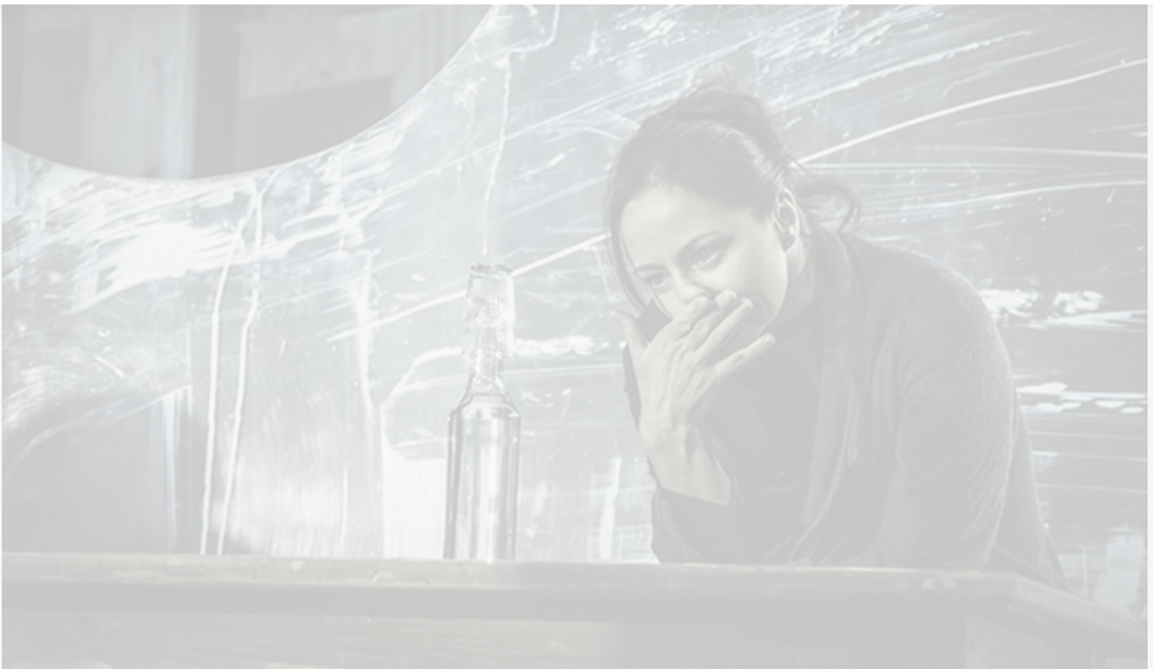
Аннинька в спектакле «Господа Головлёвы». МХТ имени Чехова, постановка 2005 года