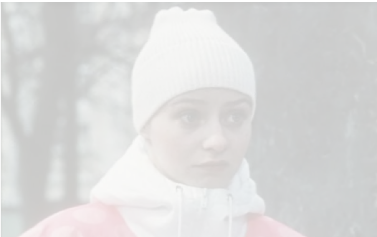
Лида в фильме «Щен из созвездия Гончих Псов», 1991 год

Если идти навстречу людям и не считать, что ты центр всего, – тогда, может быть, и жизнь станет легче.