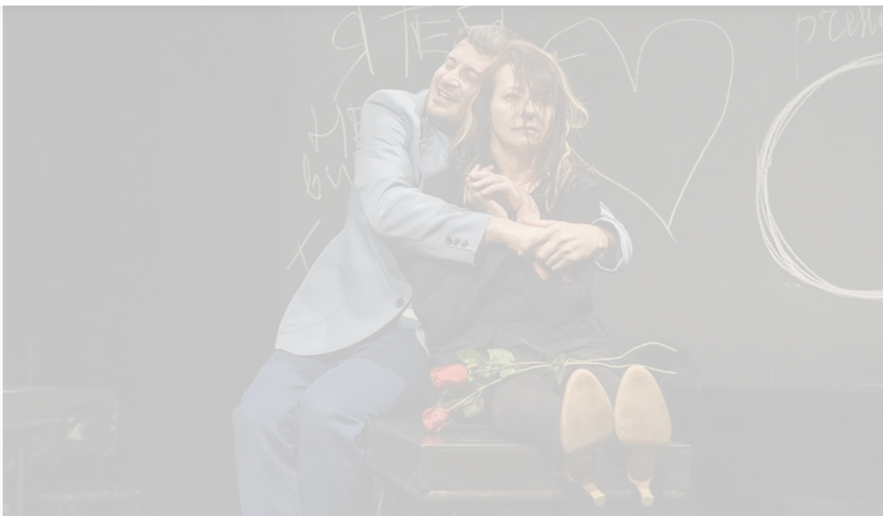
В спектакле «Космос». МХТ имени Чехова, постановка 2023 года

Так много глупостей мы делаем – от эмоций, от нерешённости собственных проблем, от того, что мы мало видели, мало читали. Да просто мало думали.