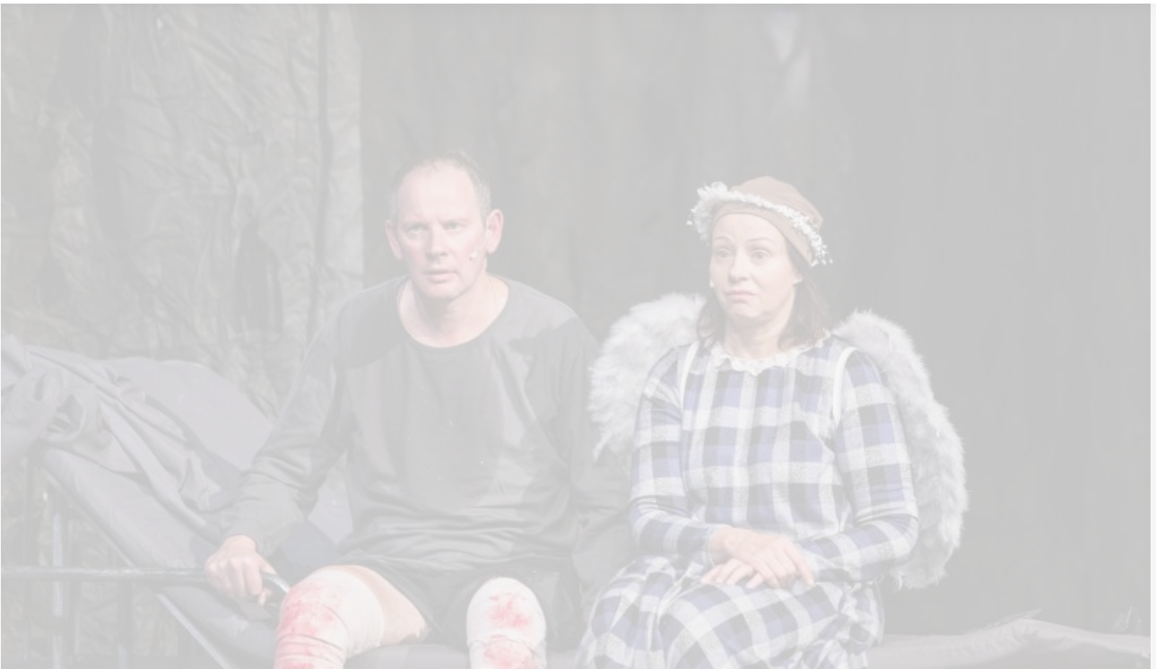
Энни в спектакле «Мизери». Современный театр антрепризы, постановка 2015 года

Чтобы услышать другого человека, надо просто поставить себя на его место. Тогда поймёшь, как общаться.