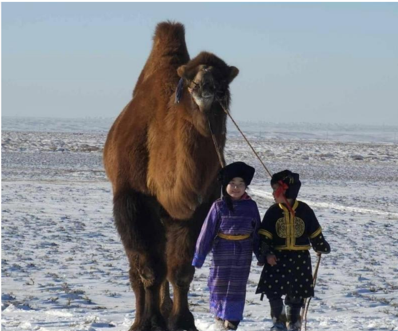
Самый рослый верблюд Монголии по кличке Высокий красный, рост которого три метра

Особое внимание уделяется созданию условий для комфортного отдыха взимний период . Это включает в себя развитие инфраструктуры, улучшение транспортной доступности и внедрение современных технологий в гостиничный сервис. Таким образом, Монголия стремится продлить туристический сезон и привлечь новых гостей.