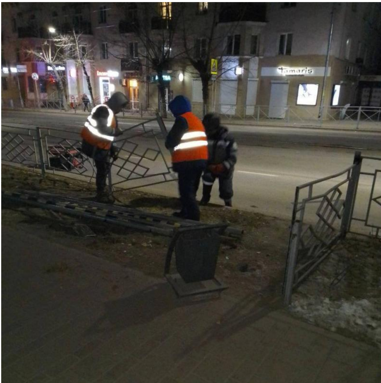
Фото: Комбинат по благоустройству Улан-Удэ

Автор: Марк Яковлев © Babr24.com БЛАГОУСТРОЙСТВО, БУРЯТИЯ