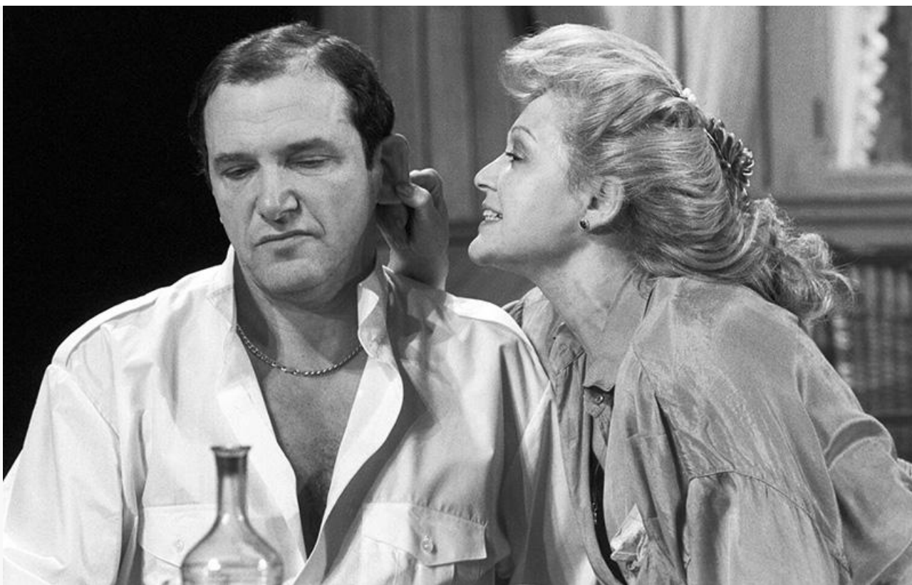
Барон в спектакле «Горбун». Театр имени Маяковского, 1991 год