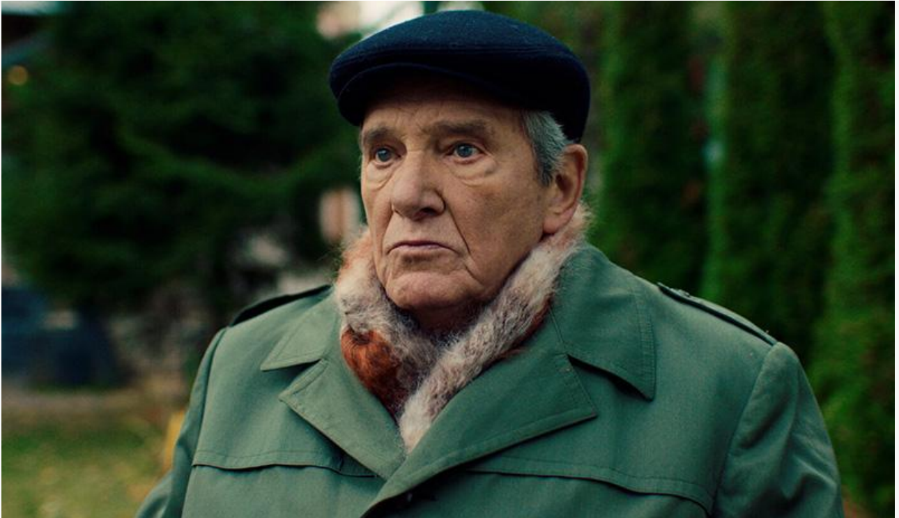
Профессор в фильме «Не дожждётся», 2023 год