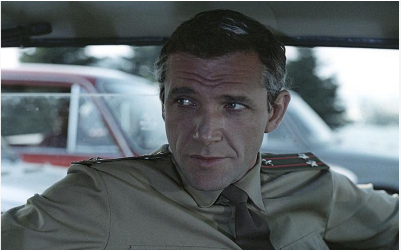
Подполковник Чагин в фильме «Тревожное воскресенье», 1983 год

В 1990 году Эммануилу Виторгану было присвоено звание «Заслуженный артист РСФСР». В 1998-м он стал народным артистом Российской Федерации.