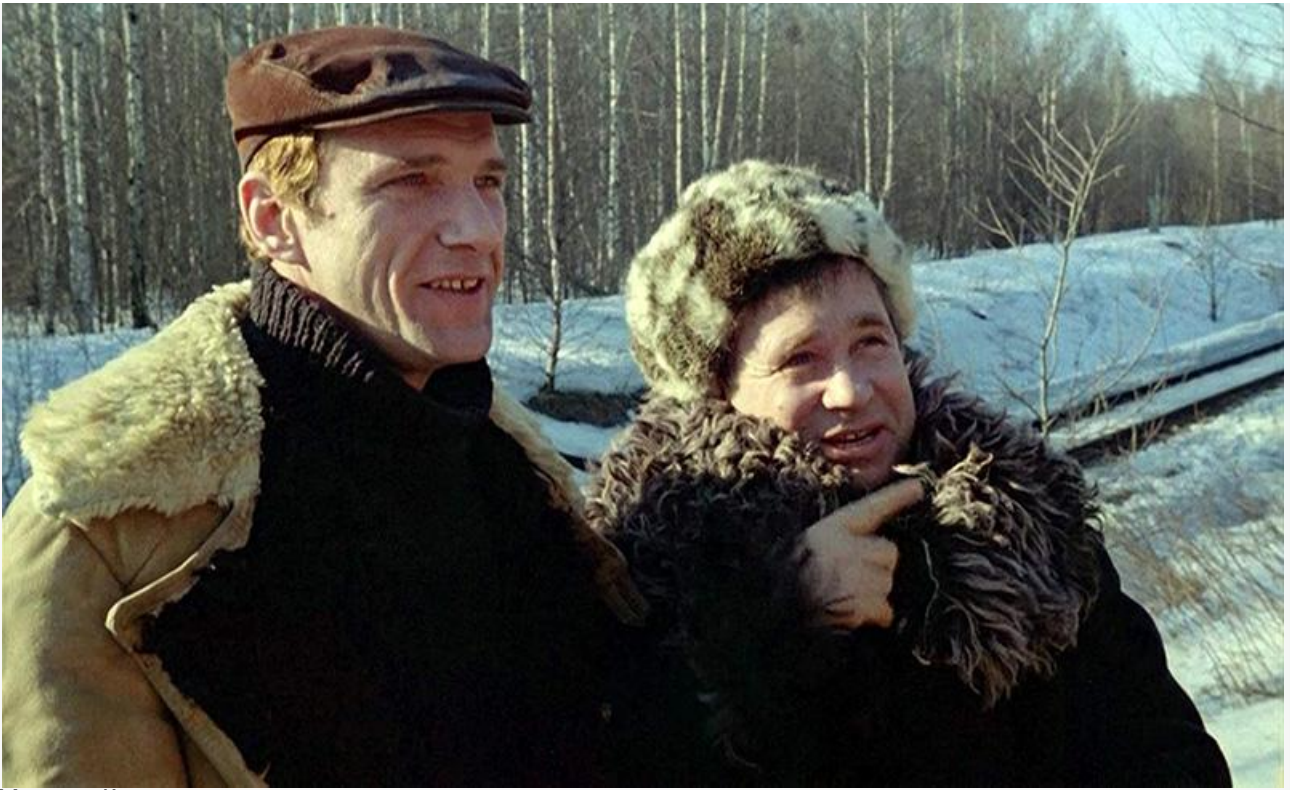
Магистр Ковров в фильме «Чародеи», 1982 год