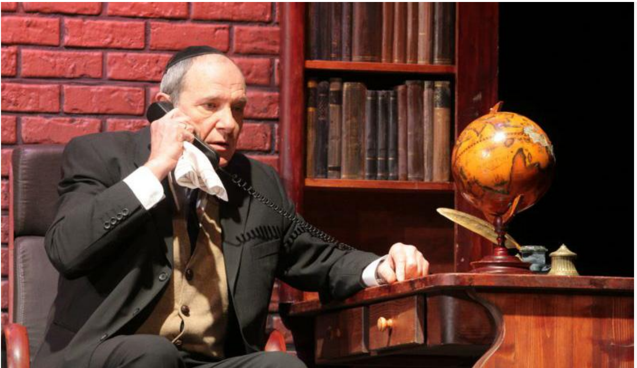
Марк в спектакле «Поздняя любовь». Специальный проект театра «Гешер» (Израиль), постановка 2010 года

В фильмографии юбиляра около 130 ролей в советских и российских фильмах и телесериалах. Среди них –