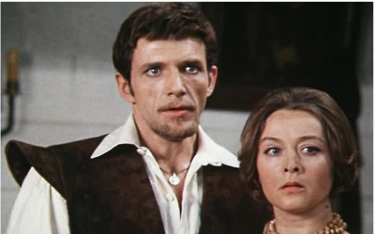
Дон Фелипе в фильме «Благочестивая Марта», 1980 год