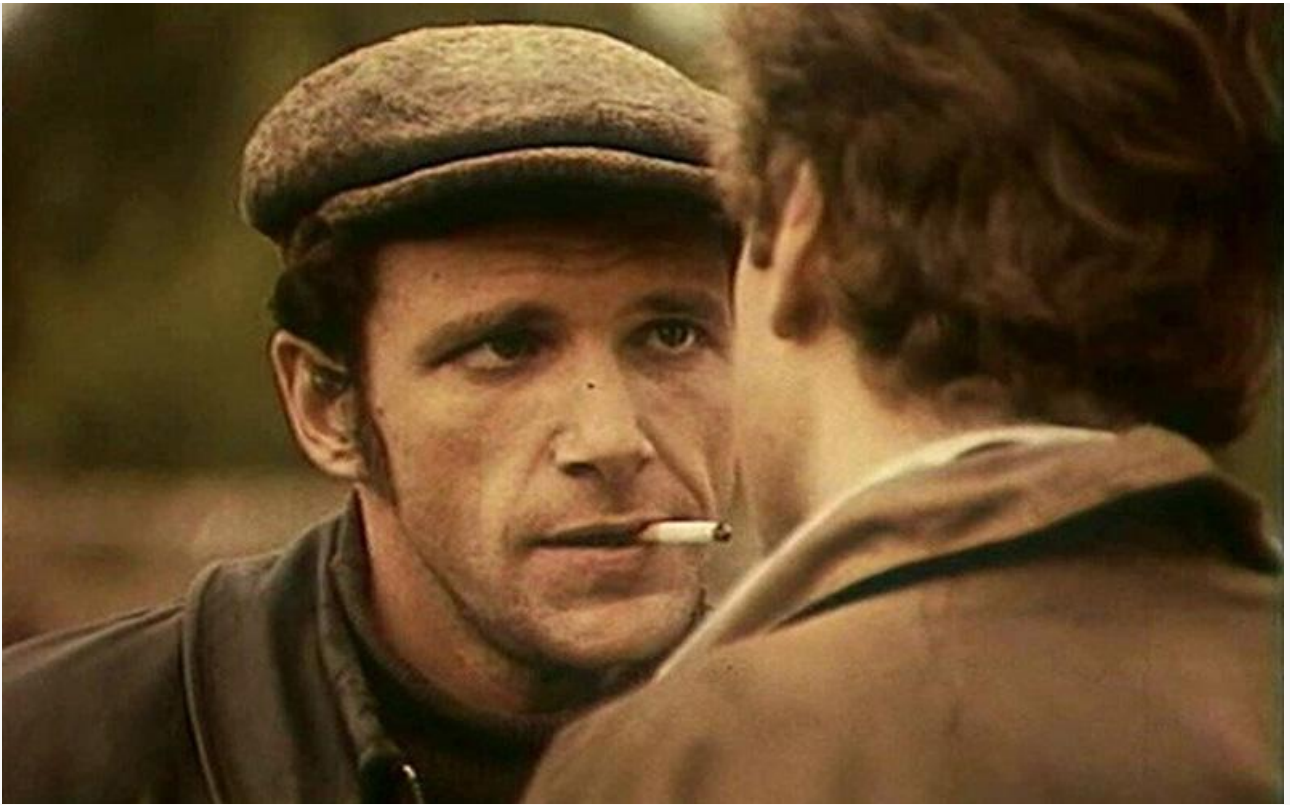
Аркадий Заварзин в фильме «И это всё о нём», 1978 год