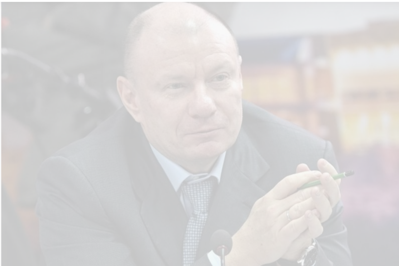
Президент ГК «Норильский никель» Владимир Потанин

тысячи работников и ветеранов отрасли, отдавших жизнь на становление тяжелой промышленности в СССР, а отработавший свое винтик системы. Система, которая должна работать на обогащение Владимира Потанина.