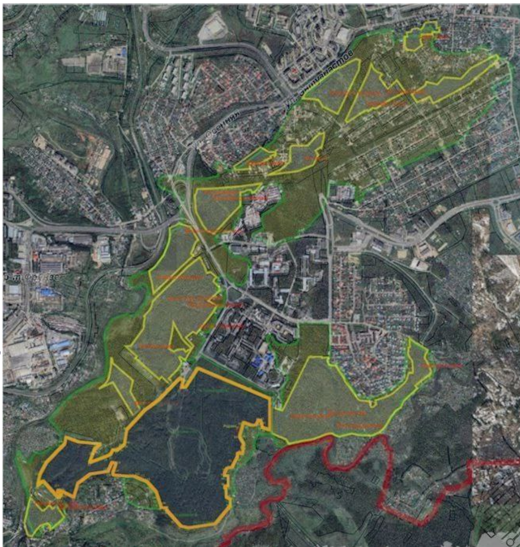
Фото: ТГ-канал «Защита Академгородка, озёр и леса»

Автор: Андрей Тихонов © Babr24.com ЭКОЛОГИЯ, ОФИЦИОЗ, ПОЛИТИКА, ТОМСК 👁 18098 18.12.2024, 23:00 📍 75