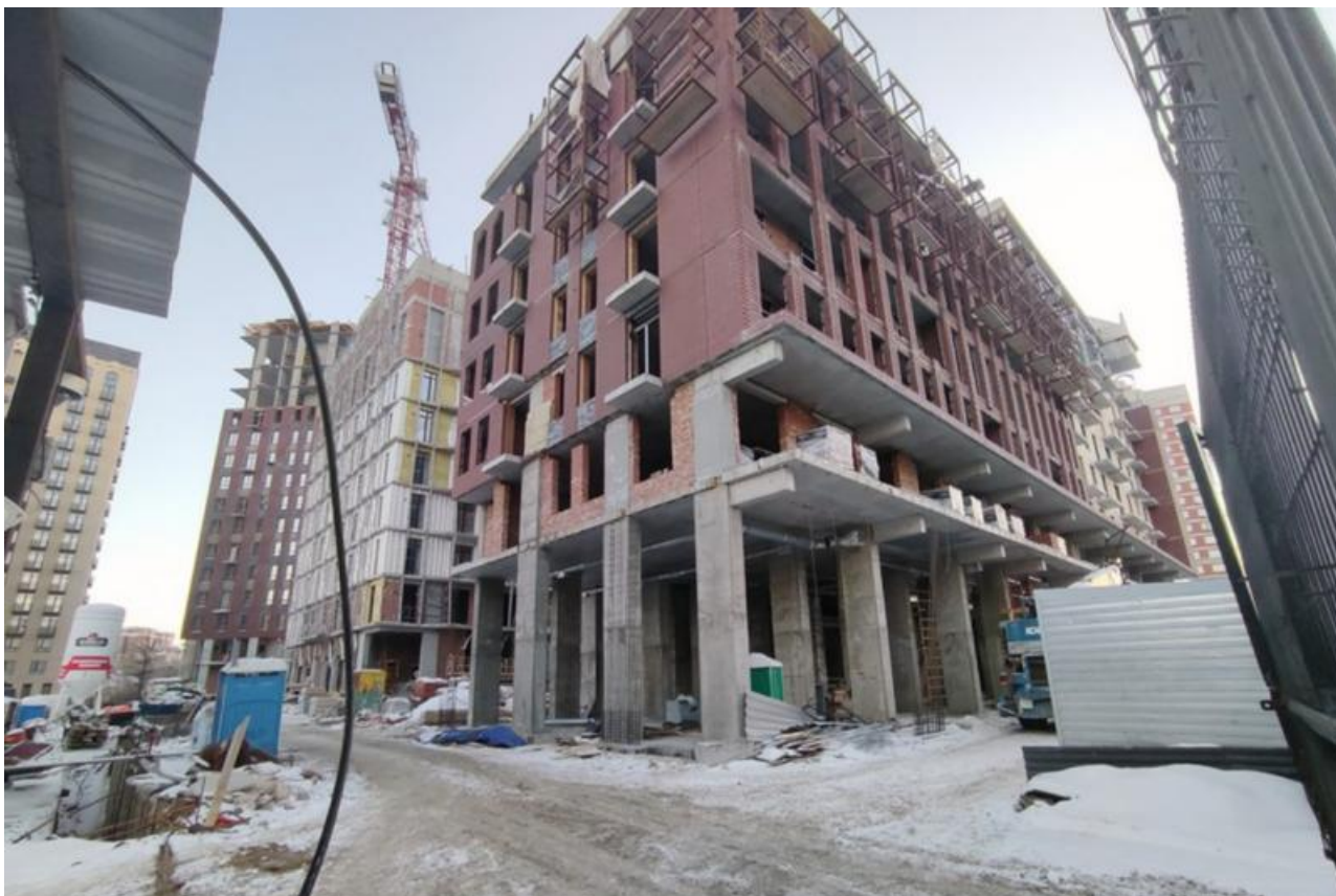
Фото: телеграм-канал «Архитектура Власти»

Автор: Ярослава Грин © Babr24.com Источник: t.me/arhvlasti НЕДВИЖИМОСТЬ, ЭКОНОМИКА И БИЗНЕС, НОВОСИБИРСК 👁 20480 18.12.2024, 12:27 🇱🇺 85 URL: https://babr24.com/?IDE=268739 Bytes: 2280 / 2174 Версия для печати Скачать PDF