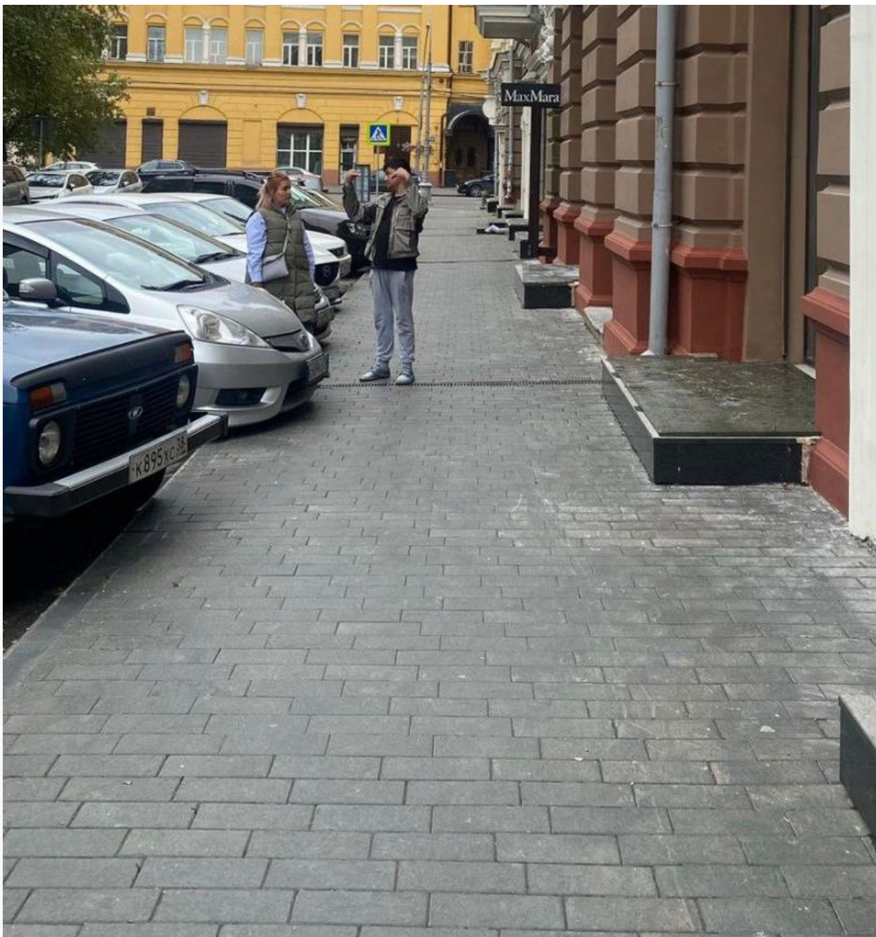
Тротуар до ремонта