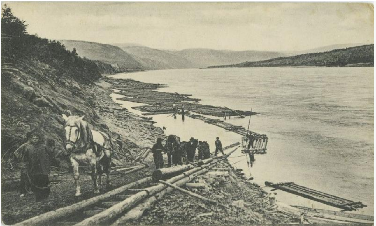
Выгрузка леса, сплавленного по Витиму