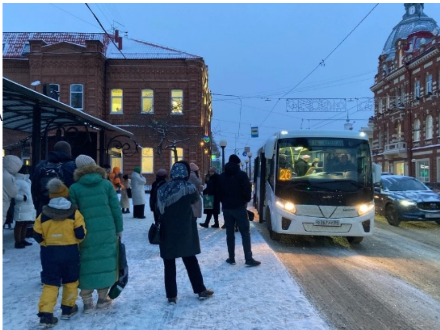
Фото: ООО СЗ «Карьероуправление», КП-Томск, тг-канал «Я из Томска»

Автор: Антон Старков © Babr24.com ТРАНСПОРТ, ОБЩЕСТВО, БЛАГОУСТРОЙСТВО, ТОМСК 👁 3916 02.12.2024, 23:28 🗨 87