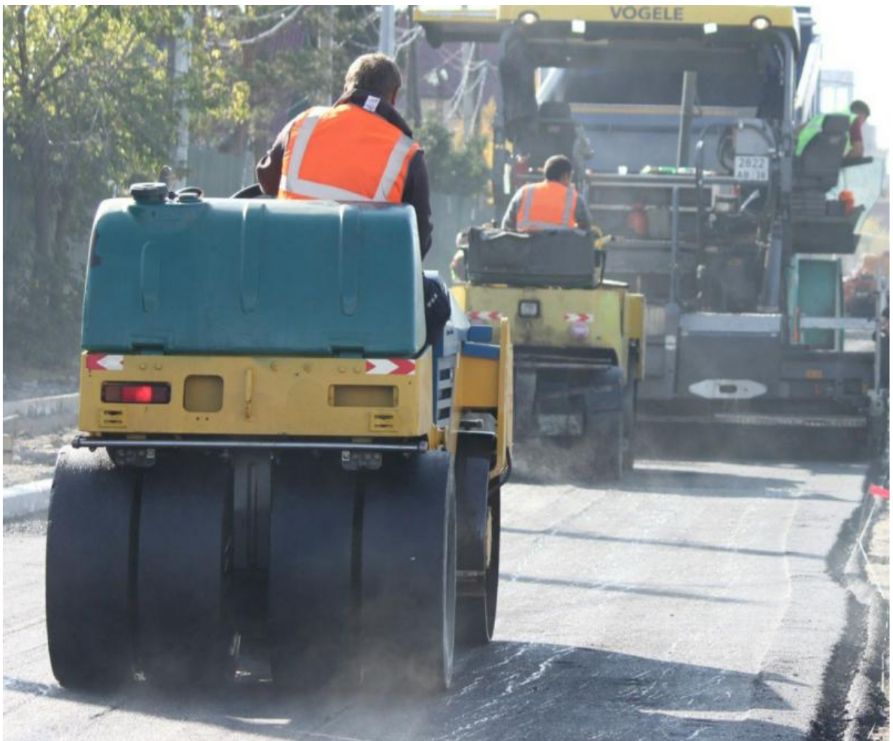
Фото из архива администрации Иркутска

Автор: Алина Саратова © Babr24.com ТРАНСПОРТ, ИРКУТСК 👁 2350 29.11.2024, 14:16 📌 57