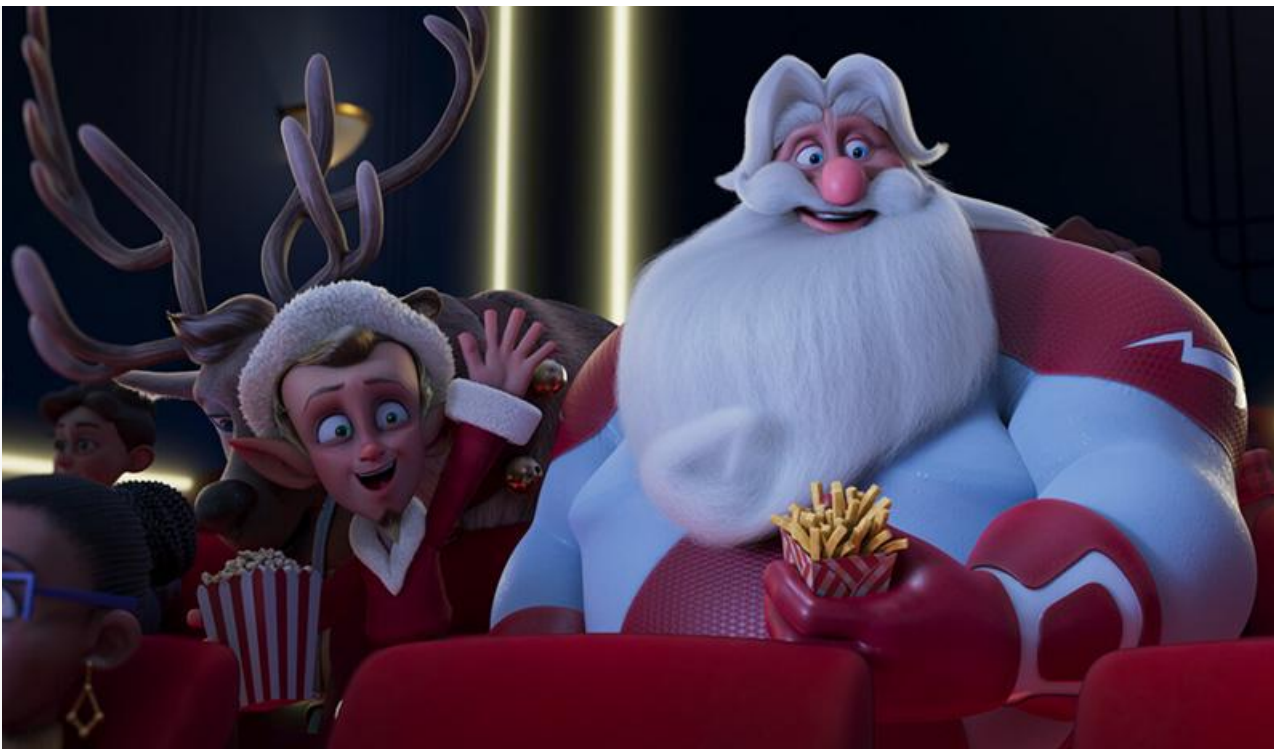
Кадр из фильма «Суперсанта»

Кроме двух лидеров проката места в десятке лидеров без особых проблем сохранили «Огниво» (50,5 миллиона с потерей в сборах 33 % и четвёртое место), «Еретик» (47 миллионов с потерей в сборах 42 % и пятое место), «Субстанция» (17,4 миллиона с потерей в сборах 32 % и восьмое место), «Руки вверх!» (17 миллионов с потерей в сборах 41 % и девятое место) и «Граф Монте-Кристо» (15 миллионов с потерей в сборах 29 % и десятое место).