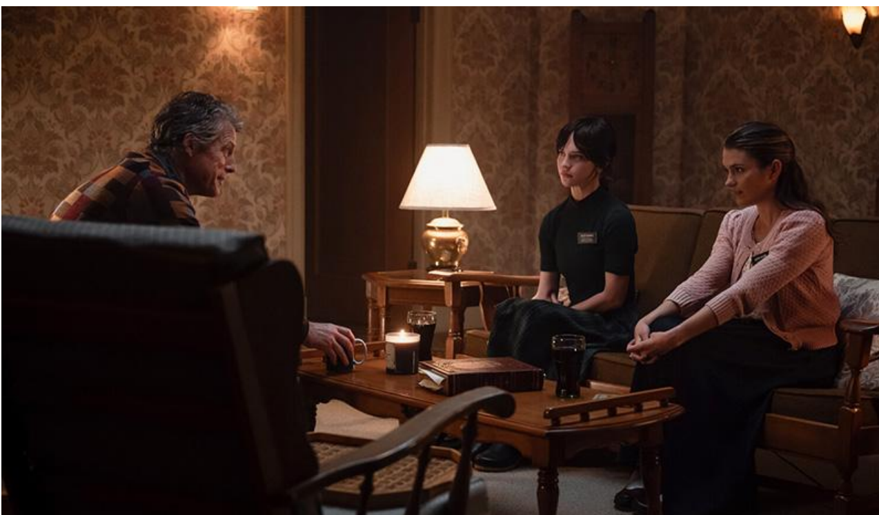
Кадр из фильма «Еретик»

Покинули топовую десятку «Ходячий замок» , «За слова отвечаю» и «Хищные земли» .