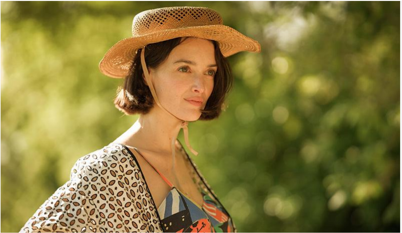
Шарлотта Ле Бон в фильме «Ники»