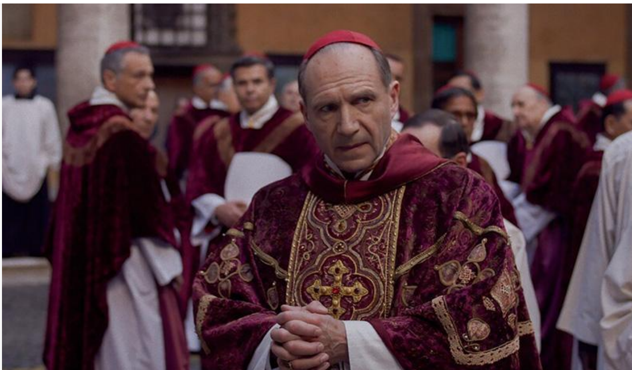
Рэйф Файнс в фильме «Конклав»

Всего на 44 тысячи рублей больше «Конклава», правда, на 1 847 экранах с посещаемостью 11 зрителей за сеанс, выручил британо-испанский мультфильм « Суперсанта ».