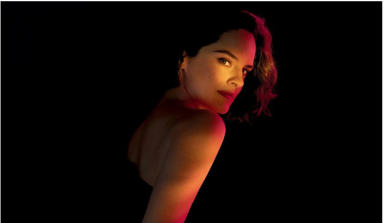
Постер к фильму «Эммануэль»