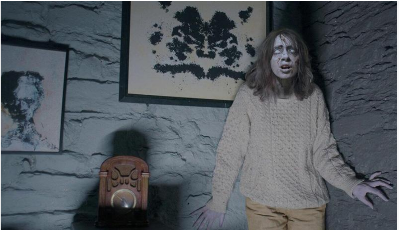
Кадр из фильма «Астрал. Медиум»

Поклонников фестивального кино порадует выход на экраны драмы Андреа Арнольд «Птица», номинированной минувшей весной на «Золотую пальмовую ветвь» Каннского кинофестиваля.