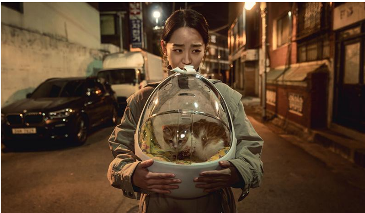
Кадр из фильма «Я слежу за тобой»