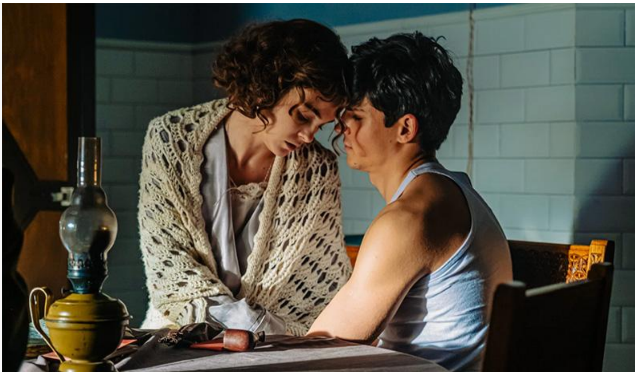
Кадр из фильма «Любовь Советского Союза»

эпизода франшизы «Манюня: Приключения в Москве» (46,4 %), но больше, чем у первого фильма «Манюня: Новогодние приключения» (26,7 %).