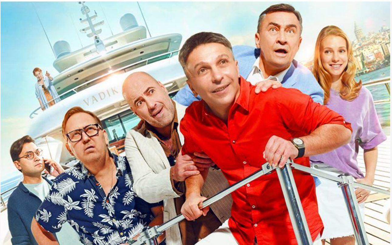
Постер к фильму «Один день в Стамбуле»