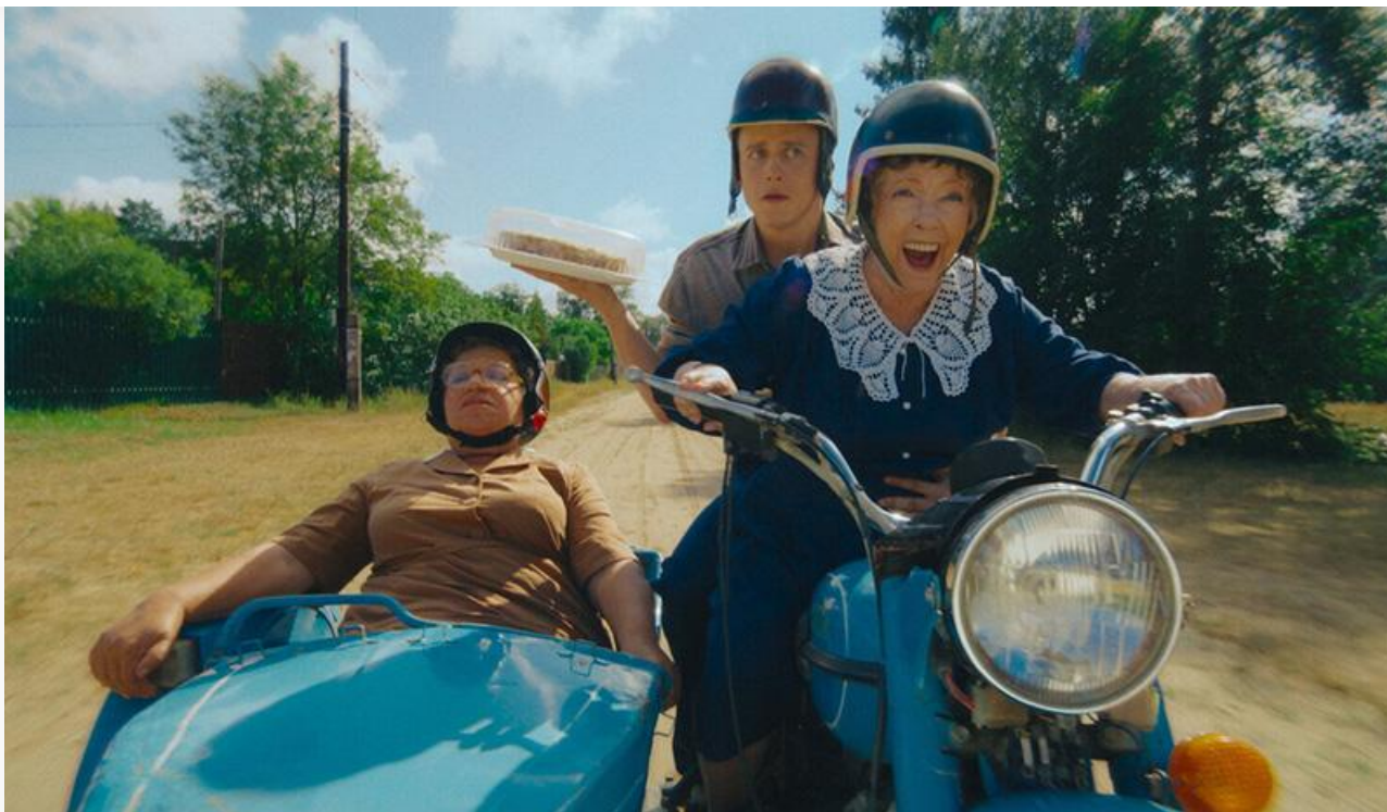
Кадр из фильма «Манюня: Приключения в деревне»

Главными новинками уикенда с точки зрения поклонников качественного кино стали триллер Эдварда Бергера « Конклав » с Рэйфом Файнсом, Стэнли Туччи, Джоном Литгоу и Изабеллой Росселини и биографическая