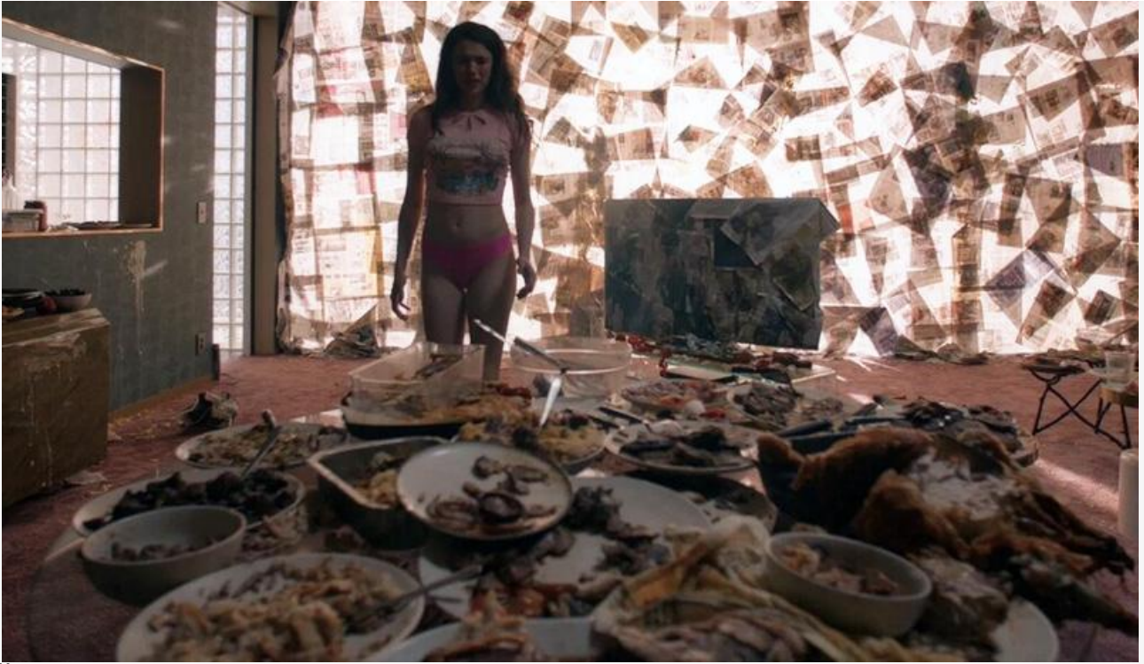
Кадр из фильма «Субстанция»

Общая касса топ-20 фильмов уикенда составила 541,2 миллиона рублей. Это на 13,05 % меньше по сравнению с предыдущими выходными .