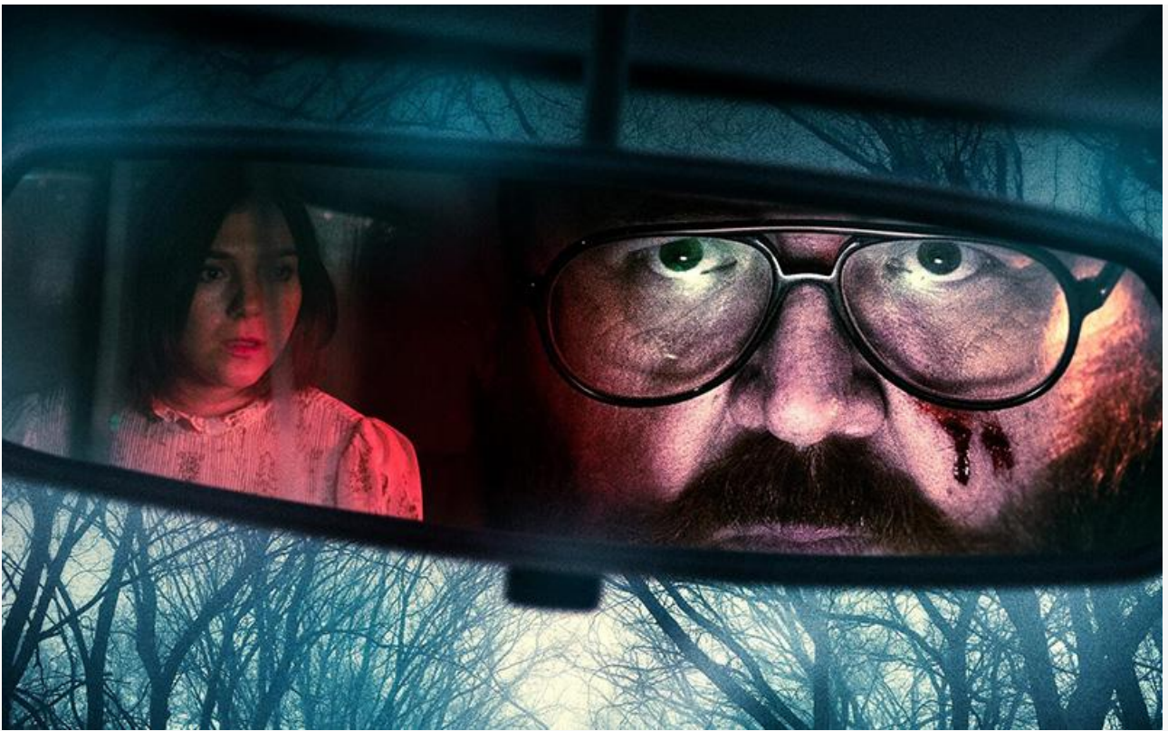
Постер к фильму «Перевозчик душ»