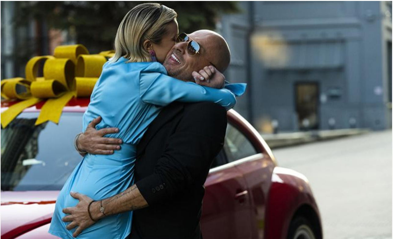
Кадр из фильма «Зять»