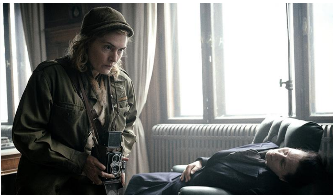
Кейт Уинслет в фильме «Великая»