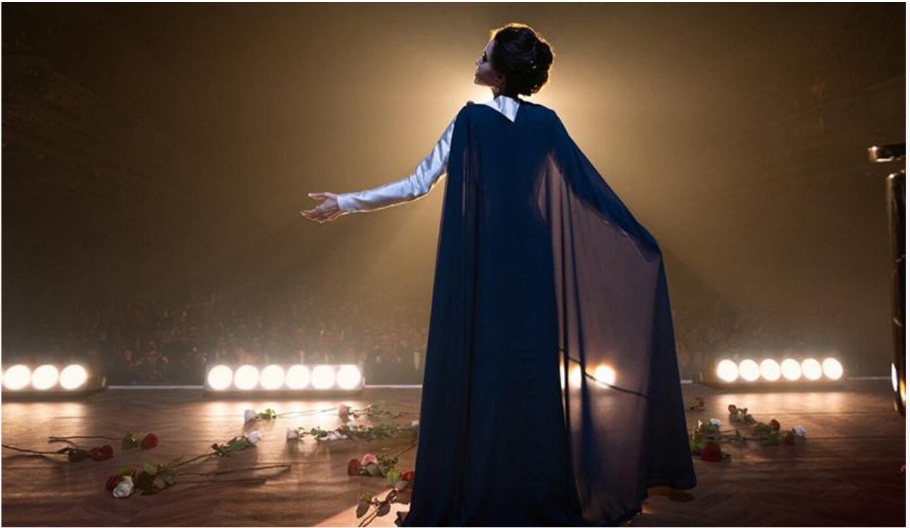
Кадр из фильма «Мария»