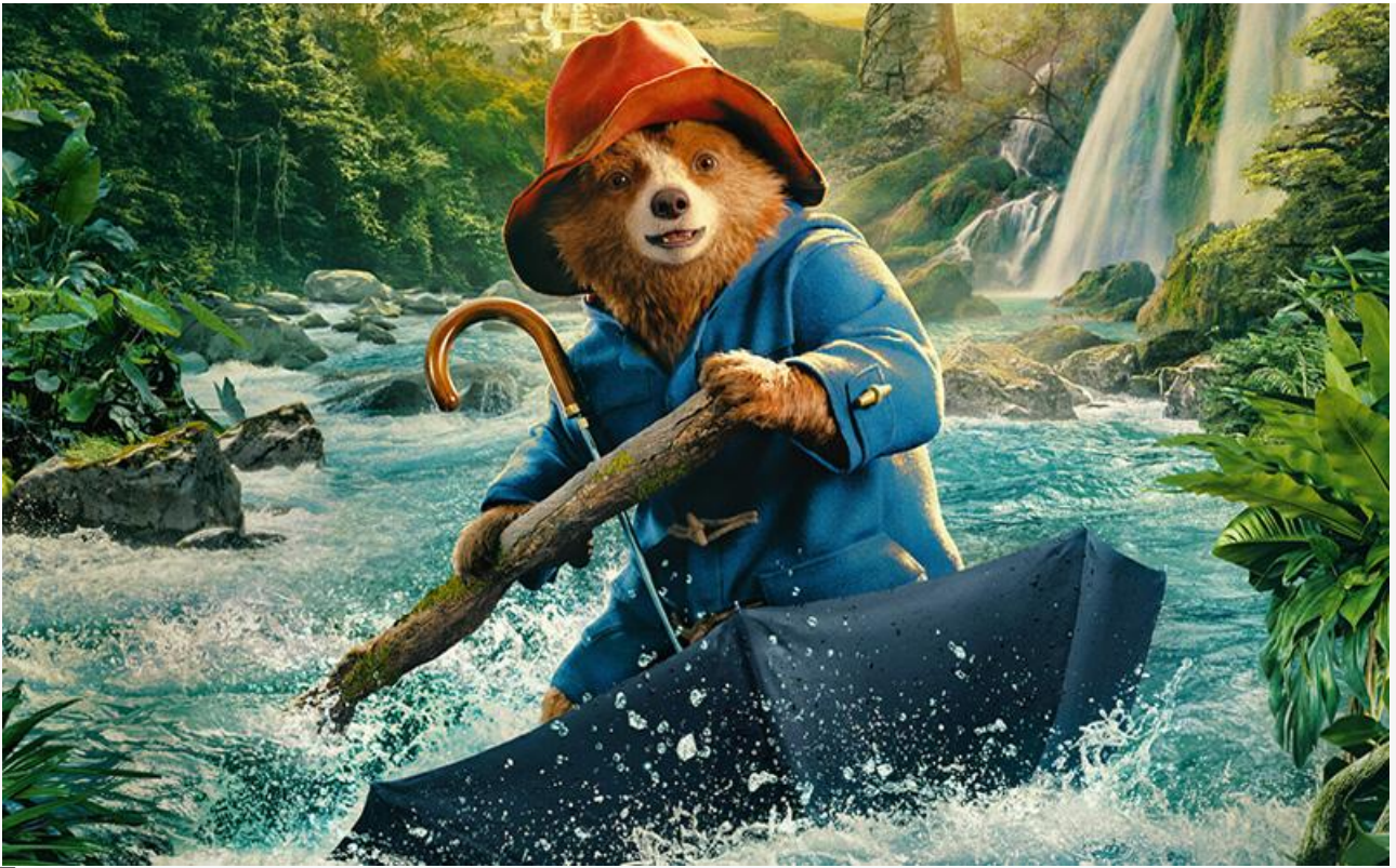
Постер к фильму «Приключения Паддингтона 3»