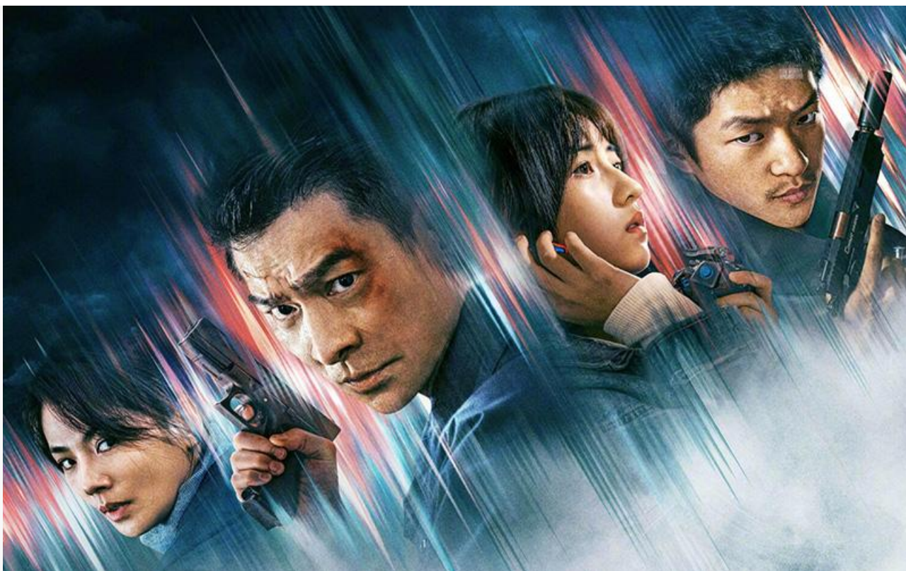
Постер к фильму «Высокое напряжение»

В формате перевыпуска зрители смогут спустя 40 лет вновь посмотреть на больших экранах народную комедию Владимира Меньшова « Любовь и голуби ».