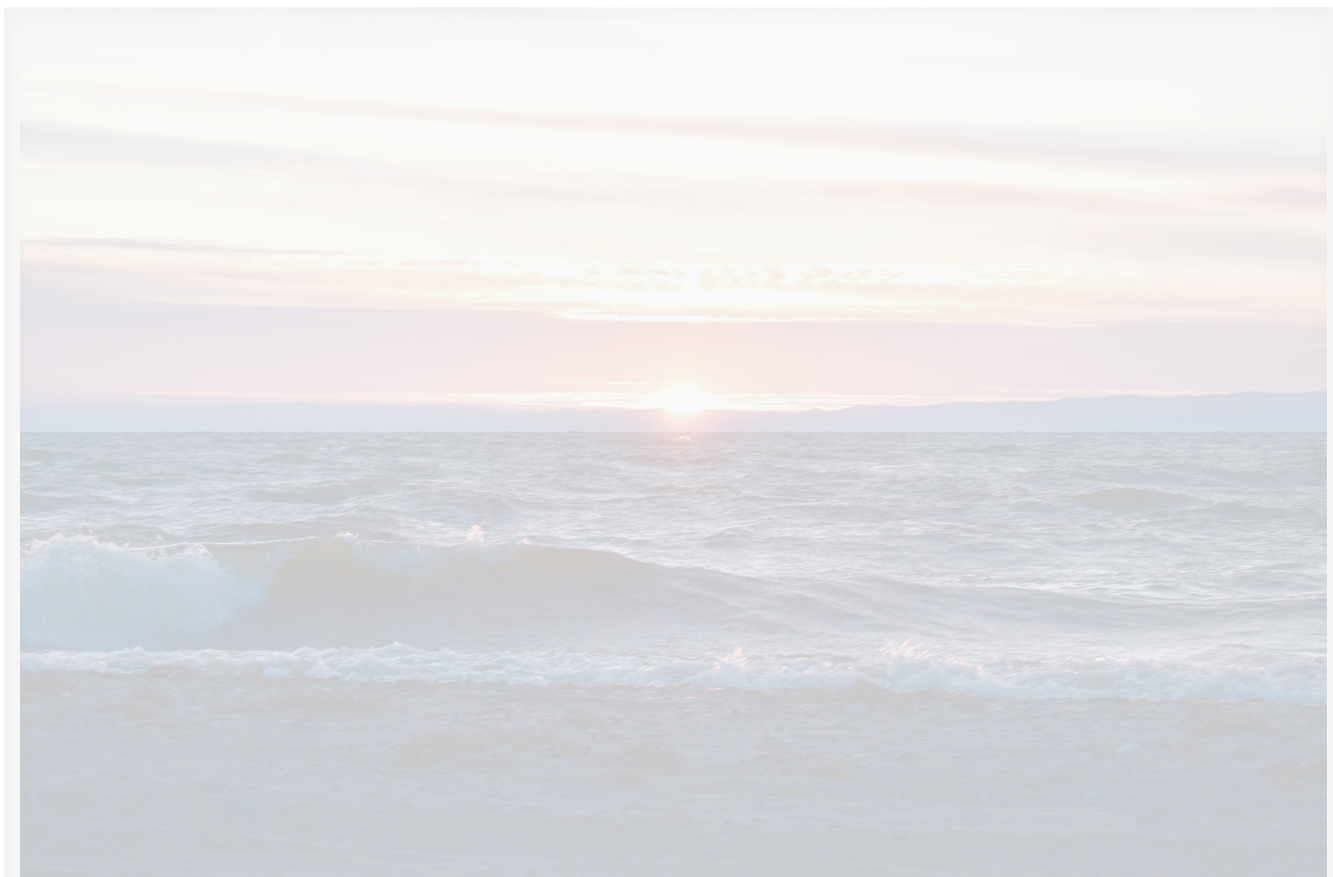
Автор: Екатерина Долинская Фото из альбома "Байкал. Виды - лето" © Фотобанк "RuBabr"

Суть инициативы ВООП заключается в переводе Байкала и прилегающих территорий в федеральное подчинение, минуя региональные власти. Предполагается, что это позволит быстрее принимать решения и устранять накопленные экологические проблемы. Председатель ВООП Вячеслав Фетисов заявил о необходимости создать долгосрочную программу социально-эколого-экономического развития региона, отмечая, что подобные идеи обсуждаются уже 25 лет, но до сих пор не реализованы.