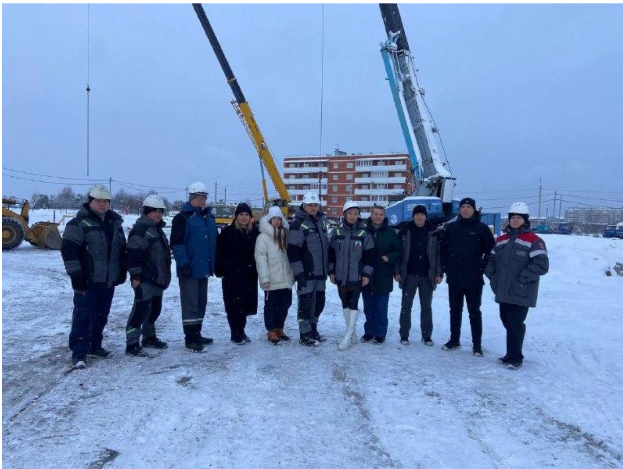
Фото: Анна Ягуда

Автор: Ярослава Грин © Babr24.com ОБЩЕСТВО, НЕДВИЖИМОСТЬ, ИРКУТСК 👁 6278 28.11.2024, 15:03 👍 72