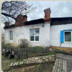
«ОСОБНЯК КРЫСИНА. ОСОБНЯК, ЖИЛОЙ ДОМ, ХОЗ. ПОСТРОЙКА»