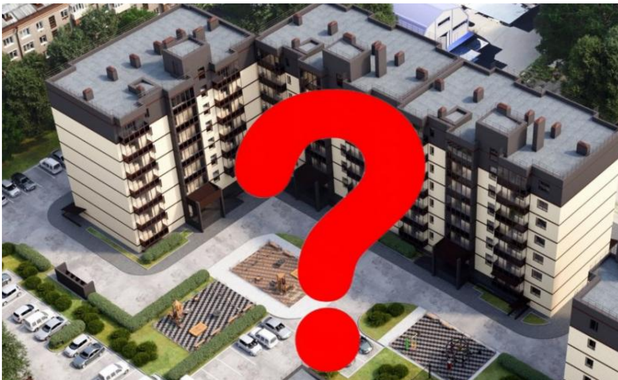
Фото: https://irkutsk.domclick.ru , drive2.ru

Автор: Георгий Булычев © Babr24.com СКАНДАЛЫ, НЕДВИЖИМОСТЬ, ОБЩЕСТВО, ИРКУТСК 👁 3955 26.11.2024, 05:00 🗨 92