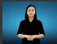
Тоо болон тооны нэрийн илэрхийлэл