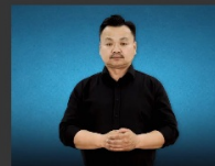
Цагаан толгойн хурууны үсэг

Появление первого электронного словаря жестового языка открывает новые перспективы для интеграции глухонемых в общество. Платформа позволяет изучать жестовый язык в удобной форме, способствует развитию коммуникативных навыков и устранению барьеров в общении. Кроме того, словарь является важным инструментом для повышения осведомленности общества о культуре и потребностях глухонемых.