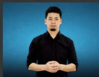
Монгол дохионы хэлний дүрэм