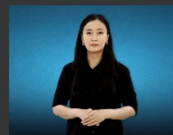
Үгээр хайх монгол дохионы хэлний толь бичиг