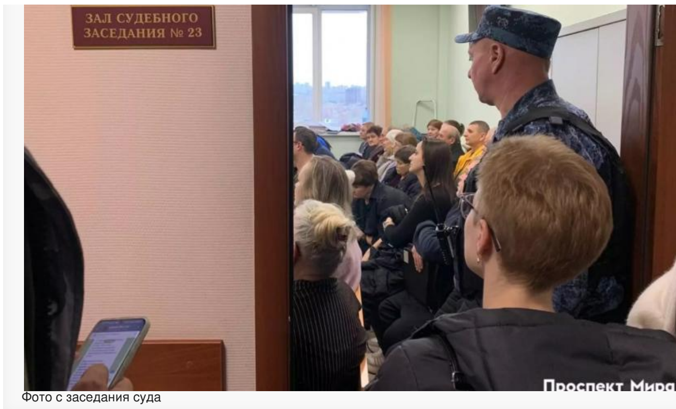
Фото с заседания суда

В ответ представитель администрации Красноярска заявил, что жители микрорайона были уведомлены о переводе домов в другой статус ещё в 2022 году и время на оспаривание КРТ они упустили сами. Представитель застройщика также добавил, что местные жители были в курсе, что попадают под КРТ.