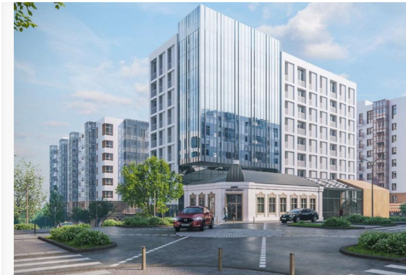
Концепция «Николаевских кварталов»

Николаевка — это старинный район в Красноярске, состоящий преимущественно из частного сектора. В 2022 году микрорайон попал под КРТ, теперь на его месте планируют построить многоэтажные жилые дома и различные социальные объекты, а у самой Николаевки появится новое имя — «Николаевские кварталы». При этом все частные дома в микрорайоне примерно на 18 гектарах земли будут сносить, так как механизм КРТ не допускает наличия старых строений в центре нового района.