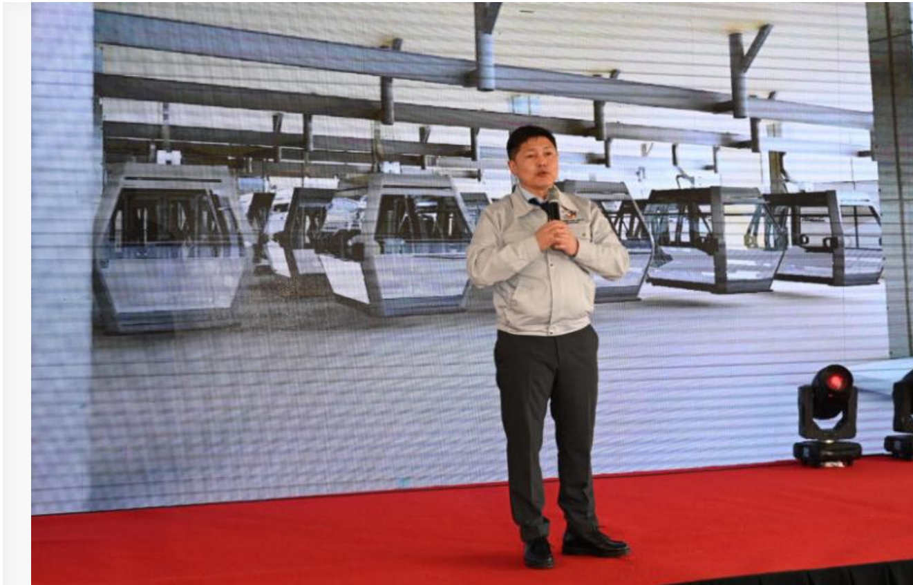
Мэр Улан-Батора Нямбаатар Хишгээ

Заявлено, что канатная дорога станет не только альтернативой традиционным видам транспорта, но и важным туристическим объектом. Пропускная способность составит до трех тысяч человек в час. Это существенно разгрузит наземный транспорт . Кроме того, проект канатной дороги менее затратный и реалистичный по сравнению со строительством метро , которое в условиях Улан-Батора требует значительных финансовых и временных ресурсов.