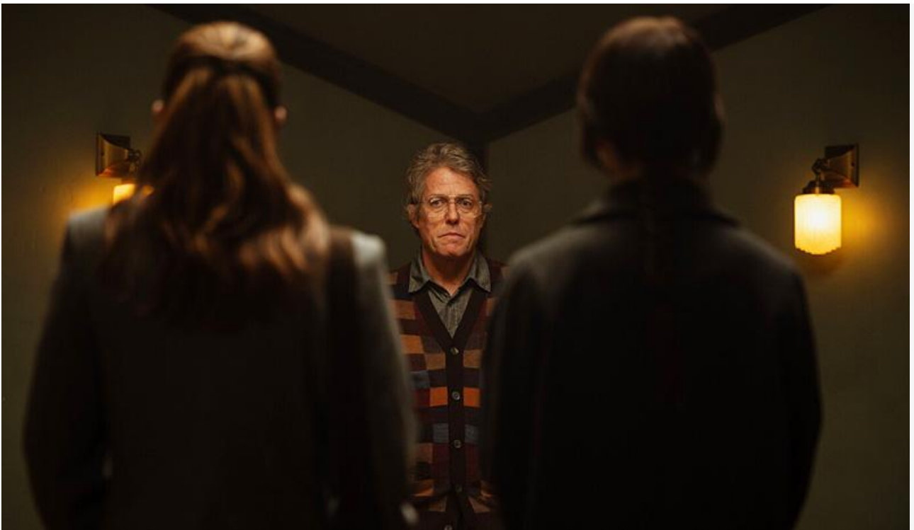
Кадр из фильма «Еретик»