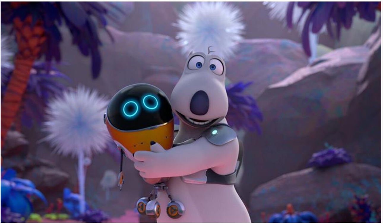
Кадр из фильма «Бернард: Миссия Марс»

Продолжает удивлять «Субстанция» . Очередные потери в сборах ставшего культовым боди-хоррора составили всего 14 %, что позволило шедевру Корали Фаржа всего на 299 экранах пополнить копилку на 40,9 миллиона рублей и занять по итогам уикенда четвертое место. Всё идёт к тому, что в ближайшее время «Субстанция» обойдёт по общим сборам «Министерство неджентльменских дел» и на пару с «Графом Монте-Кристо» станет самым успешным официальным зарубежным релизом российского проката 2024 года, ни разу при этом не возглавив чарт.