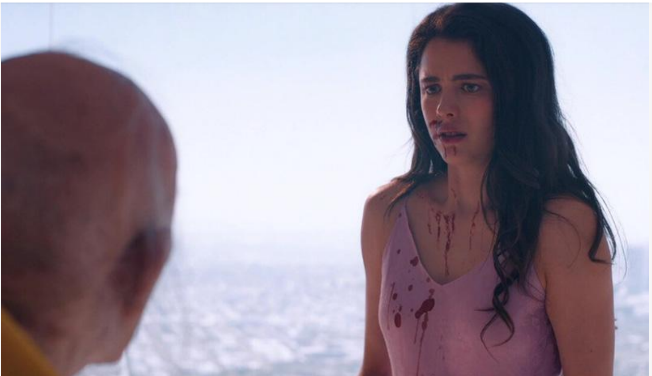
Кадр из фильма «Субстанция»

«Граф Монте-Кристо» , к слову, тоже уверенно держится в прокате. Свой восьмой уикенд в России экранизация романа Дюма отметила 33 миллионами на 297 экранах с потерей в сборах 11 %.