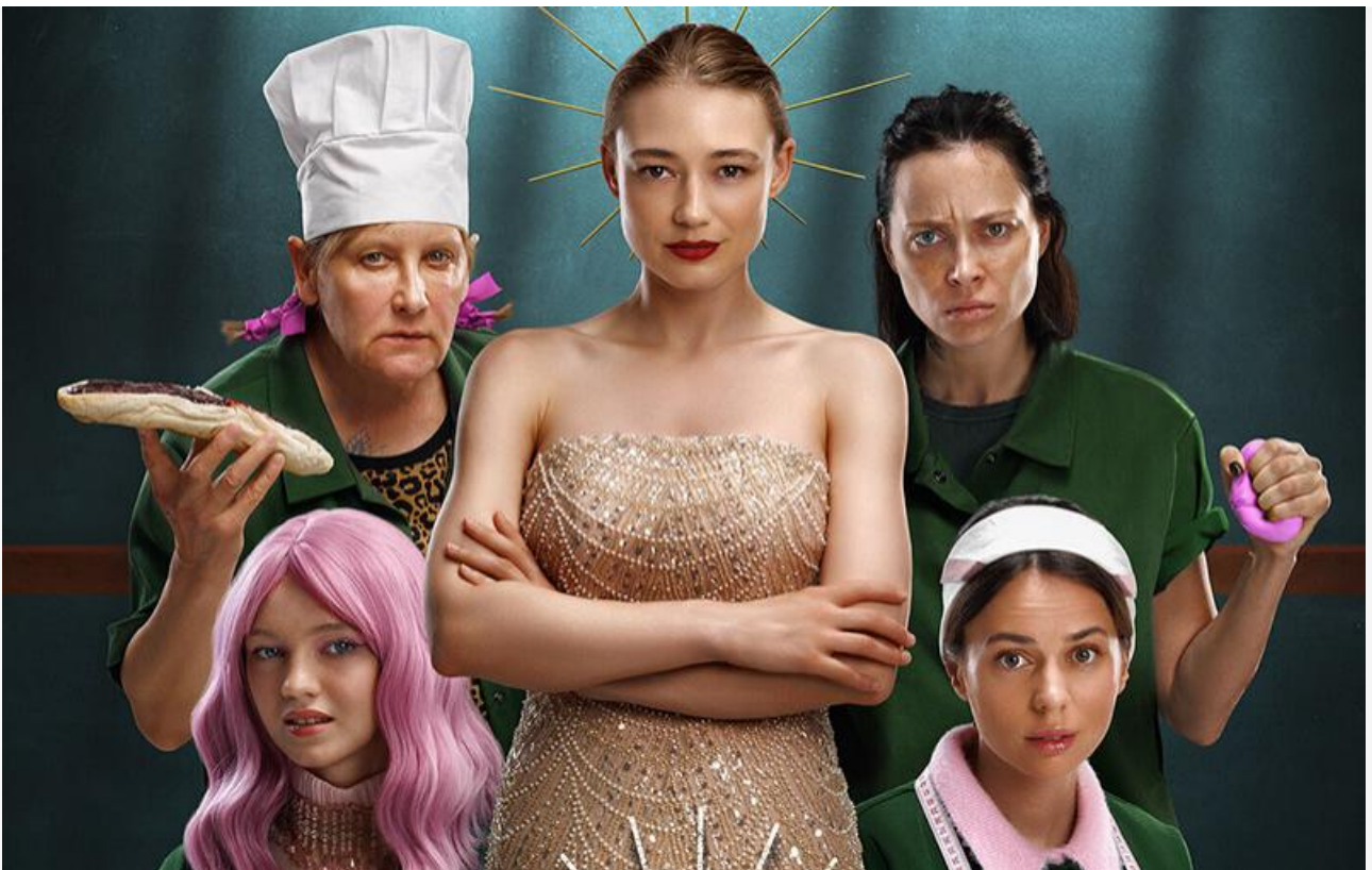
Постер к фильму «За слова отвечаю»

Хорошие шансы найти своего зрителя у британской комедии ужасов Эроса Лина «Вампиры лёгкого поведения» (18+) по роману Мэтта Хэйга «Семья Рэдли» и американского хоррора Д.В.Медофф «Реинкарнация. Возвращение ведьмы» (18+).