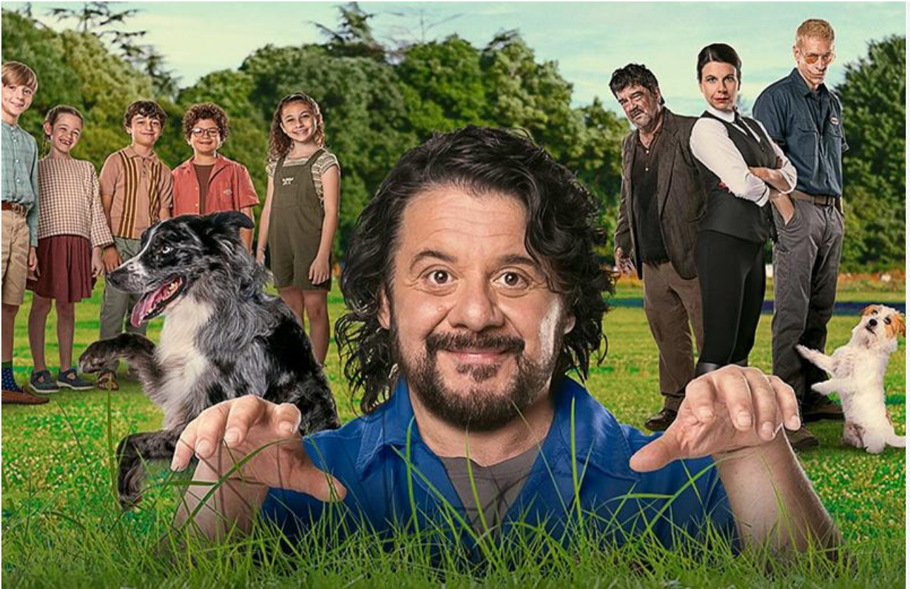
Постер к фильму «Академия четвероногих»