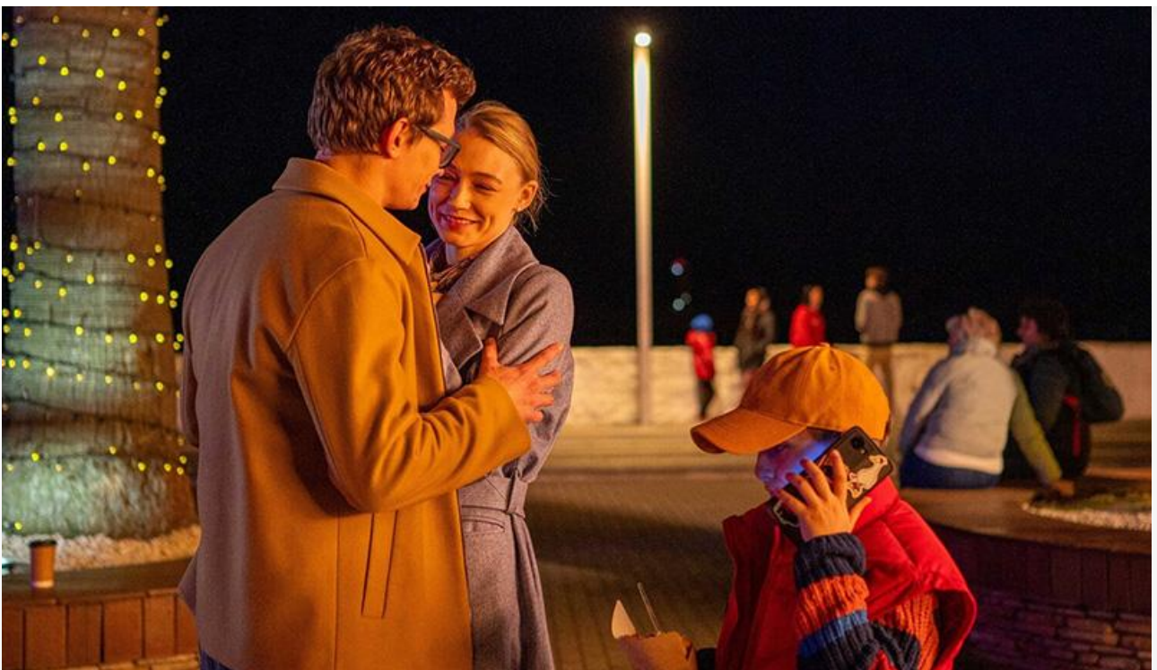
Кадр из фильма «Возвращение попугая Кеши»

Покинули топ-10 «Время жить» , «Ужасающий 3» и «Лес чудес» .