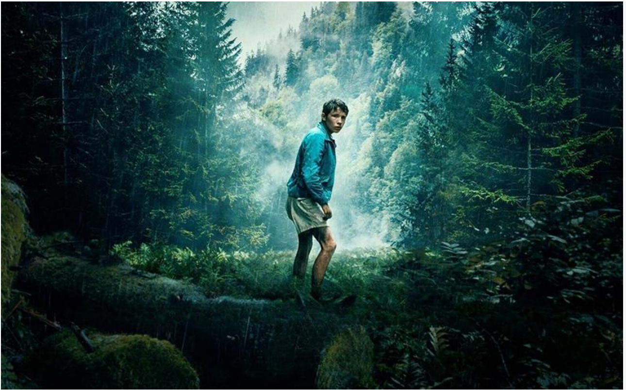
Постер к фильму «В плену стихии»