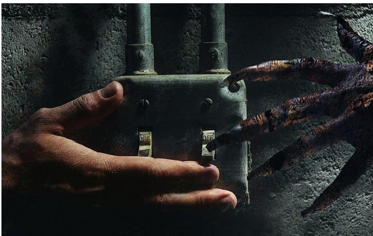
Постер к фильму «Реинкарнация».