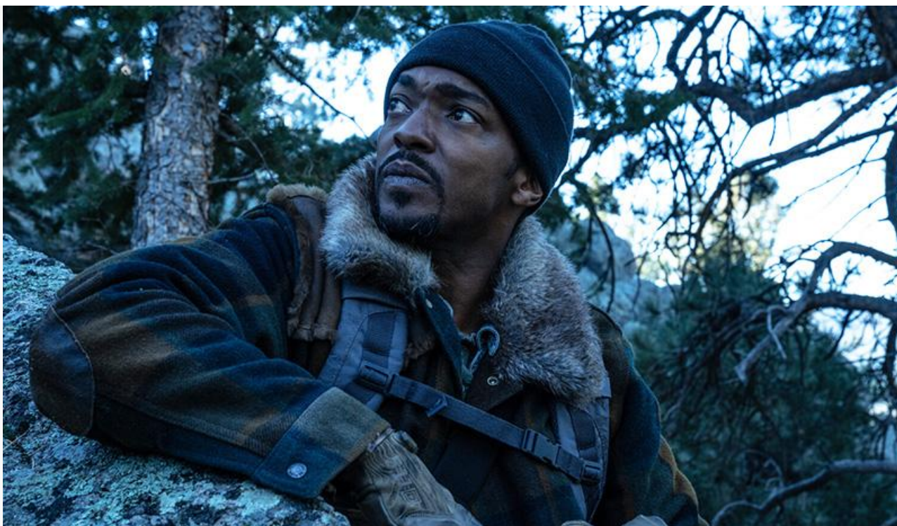
Энтони Маки в фильме «Хищные земли»

А вот комедии «Новый год в Берёзовке» Ольги Ланд, «Поймай собаку, если сможешь» Анны Курбатовой и «В баню!» Данила Иванова заработали на троих 30,8 миллиона и завершили уикенд на 12, 13 и 20 строках чарта соответственно. Чтобы понять масштаб провала, достаточно сказать, что средняя посещаемость фильма «В баню!» составила 4,5 зрителя за сеанс.