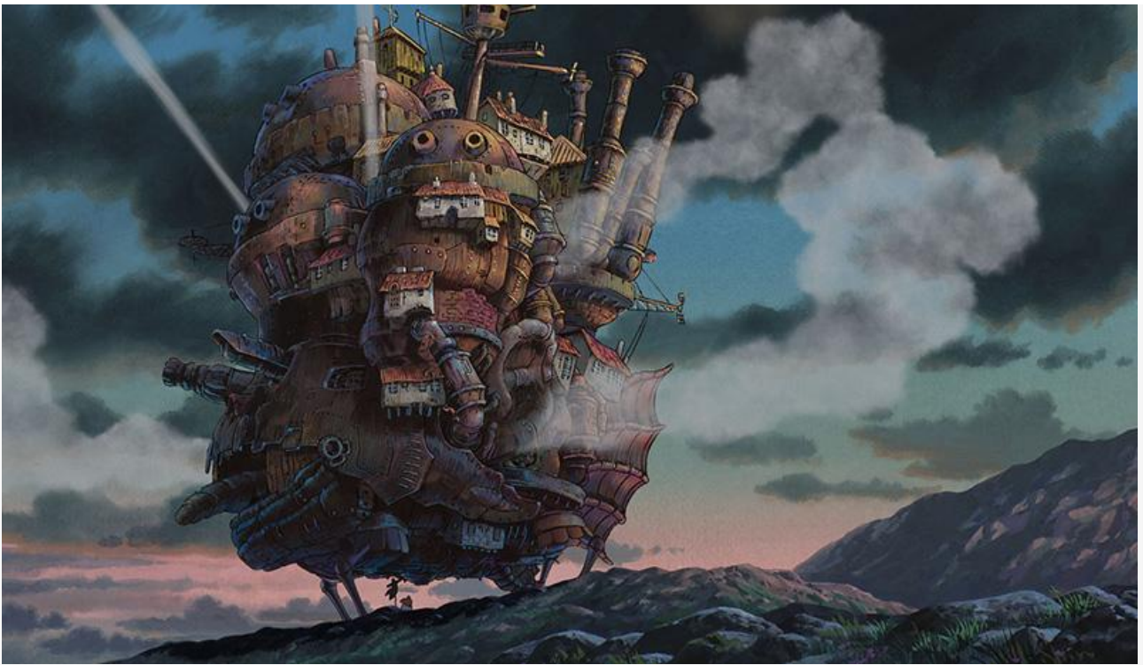
Кадр из фильма «Ходячий замок»