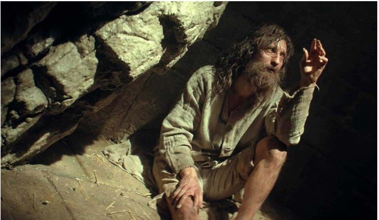
Пьер Нинэ в фильме «Граф Монте-Кристо»

Две премьеры предыдущего уикенда – «Возвращение попугая Кеши» и «Федя. Народный футболист» – не обзавелись хорошими «сарафанами», потеряв в сборах 59 и 53 % соответственно и с доходом 28,6 и 26,3 миллиона дружно опустившись с третьей и четвёртой на седьмую и восьмую строки чарта.