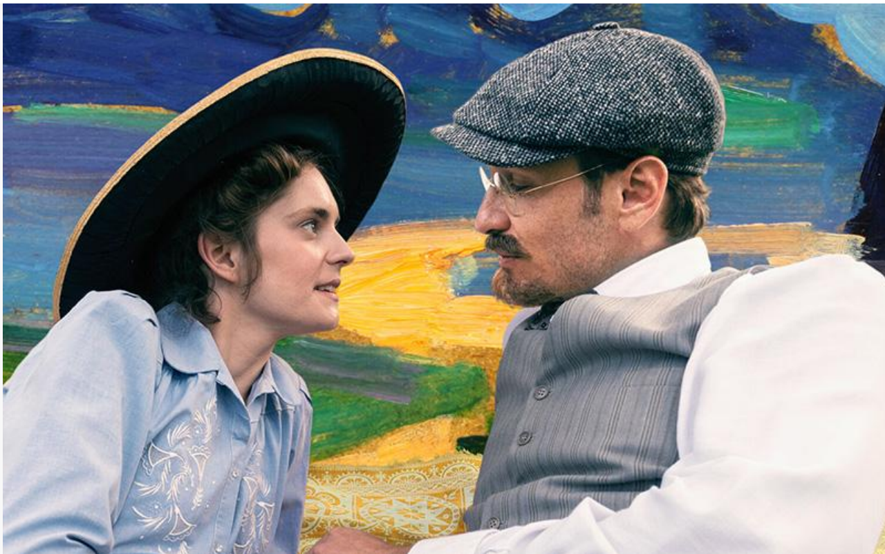
Постер к фильму «Кандинский и его муза»

Также на экраны выходят комедия Алекса Некто «Анна и Ванно. Ванна и вино» (18+), семейная лента Владимира Аленикова «Мятежники» , американская приключенческая драма Эндрю Кайтлингера «В плену стихии» , китайская комедия Пэна Дамо и Янь Фэя «Миллиардер в трущобах» , итальянская семейная комедия Андреа Джублина «Академия четвероногих» и китайский мультфильм Лукаса Цяо «Легенда об Ориксе» .