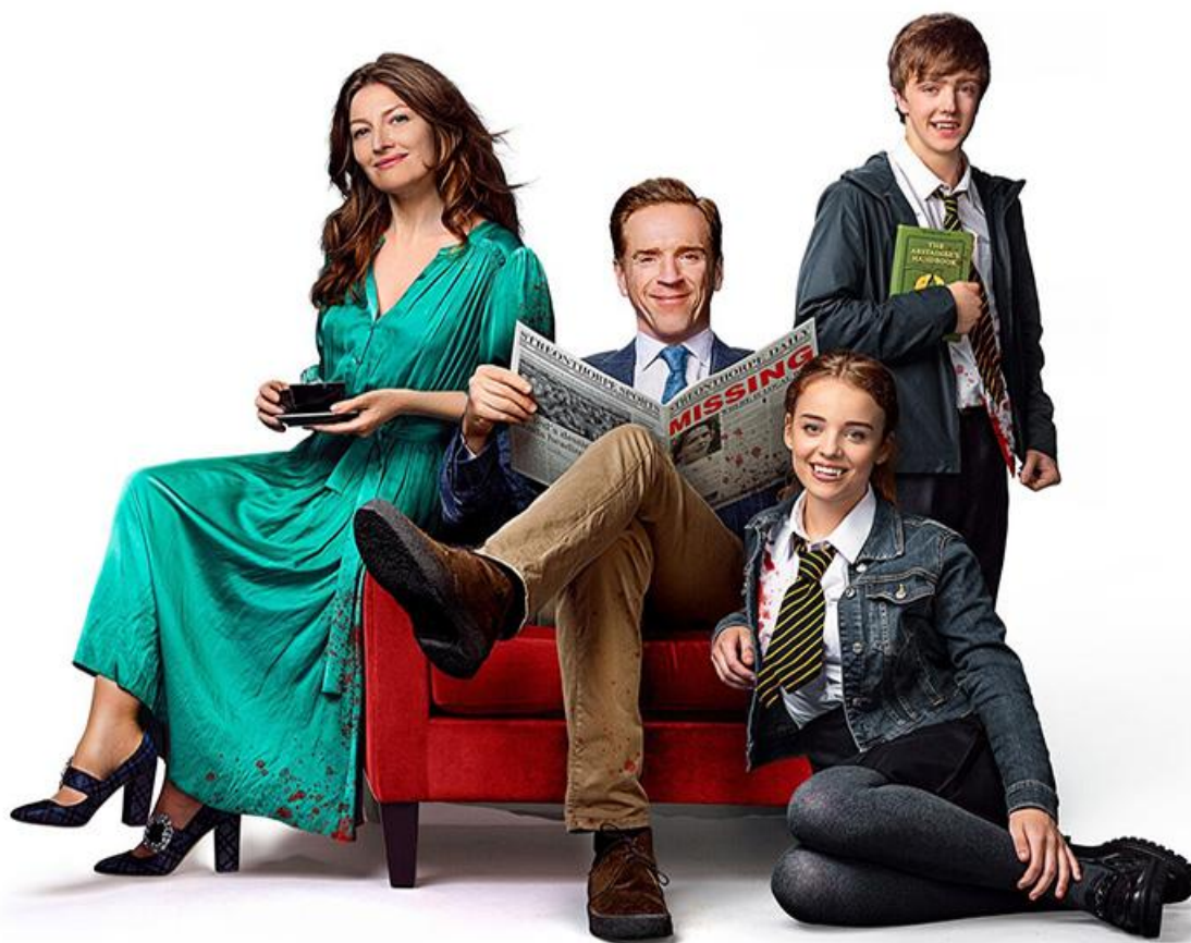
Постер к фильму «Вампиры лёгкого поведения»

драма Мехди Идира и Гран Кор Маляда «Месье Азнавур» с Тахаром Рахимом в образе легендарного шансонье.