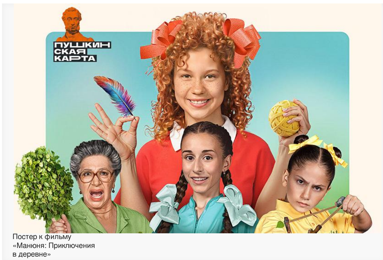
Постер к фильму «Манюня: Приключения в деревне»