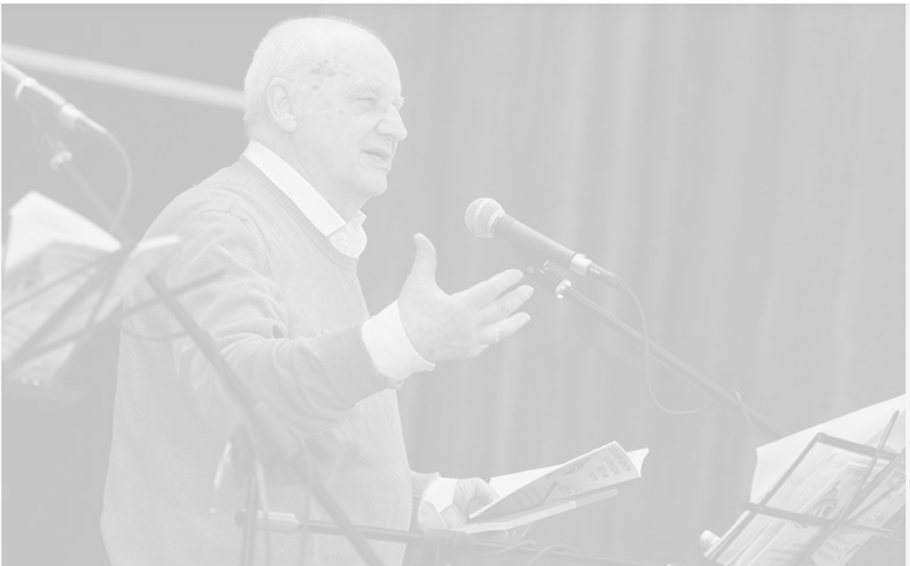
На презентации книги «Сто стихотворений», 2014 год

Также о смерти многолетнего соавтора сообщили барды Татьяна и Сергей Никитины.