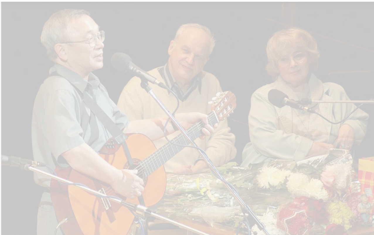
Юлий Ким на 75-летию Дмитрия Сухарева в Политехническом музее, 2005 год

Сотрудничал с Сухаревым и известный композитор Геннадий Гладков . Итогом их совместного творчества стал мюзикл по Александру Островскому «На бойком месте», экранизированный Алексеем Сахаровым в 1999 году и получивший Приз зрительских симпатий кинофестиваля «Литература и кино» и премию «Ника» в категории «Лучшая музыка».