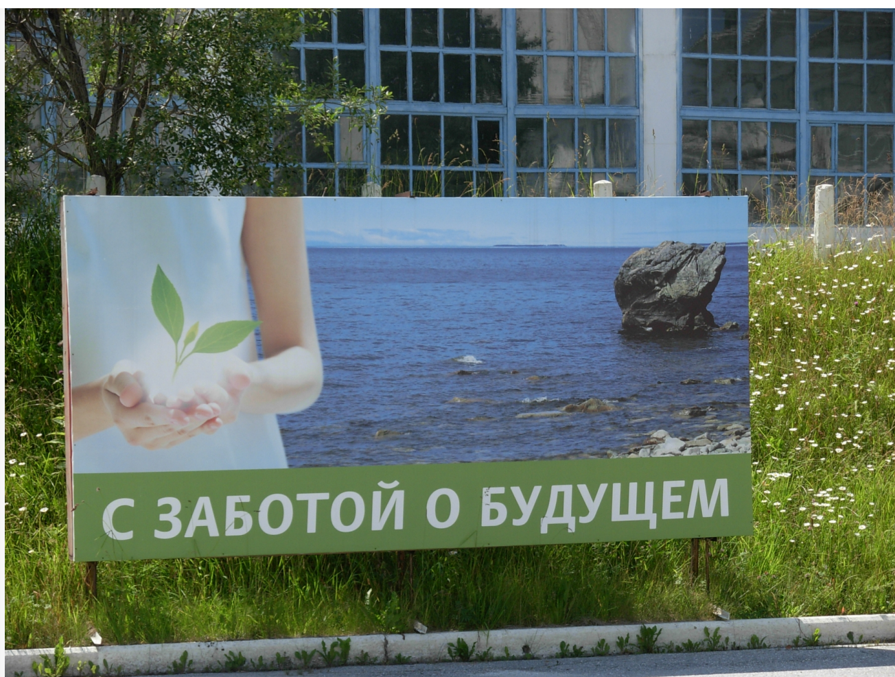
Автор: Алёна Штерн Фото из альбома "Иркутская область. Байкальск. БЦБК" © Фотобанк "RuBabr"

В 2008 году Росприроднадзор настоял на том, чтобы БЦБК перешел на выпуск небеленой целлюлозы и замкнутый водооборот. Но это решение стало точкой невозврата: продукция оказалась невостребованной, и предприятие стало убыточным. В 2009 году комбинат был закрыт, а в 2013 году окончательно признан банкротом.