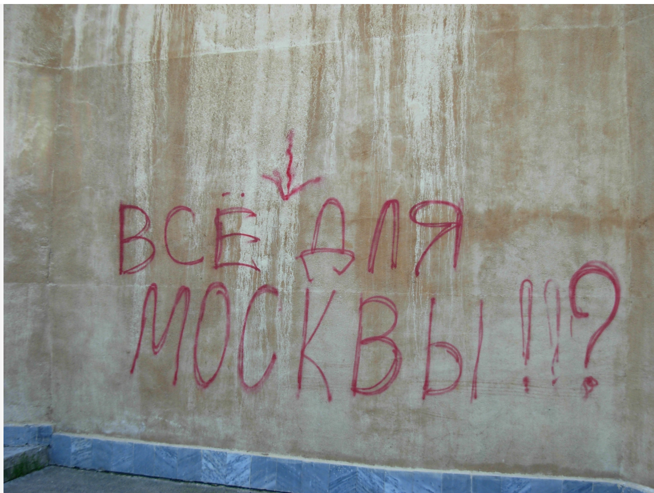
Автор: Даниил Тетерин Фото из альбома "Иркутская область. Байкальск. Лето" © Фотобанк "RuBabr"

Возникает закономерный вопрос: куда уходят миллионы рублей ежегодных бюджетных расходов? Проверял ли кто-то вообще, проводились ли работы по откачке воды?