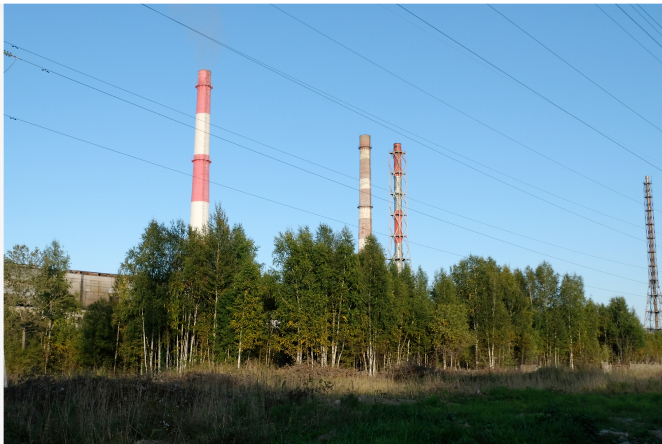
Автор: Алёна Штерн Фото из альбома "Иркутская область. Байкальск. БЦБК" © Фотобанк "RuVabr"

Мастер-план развития Байкальска, предложенный ВЭБ.РФ, обещал превращение города в туристическую зону мирового уровня. Однако за 12 лет после закрытия комбината ничего существенного сделано не было. Байкальск остается городом, где реальность расходится с грандиозными обещаниями.