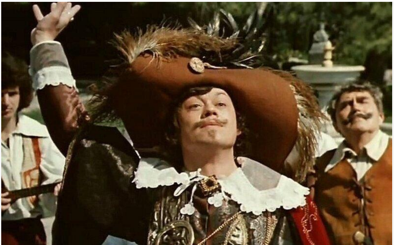
Маркиз Рикардо в фильме «Собака на сене», 1977 год