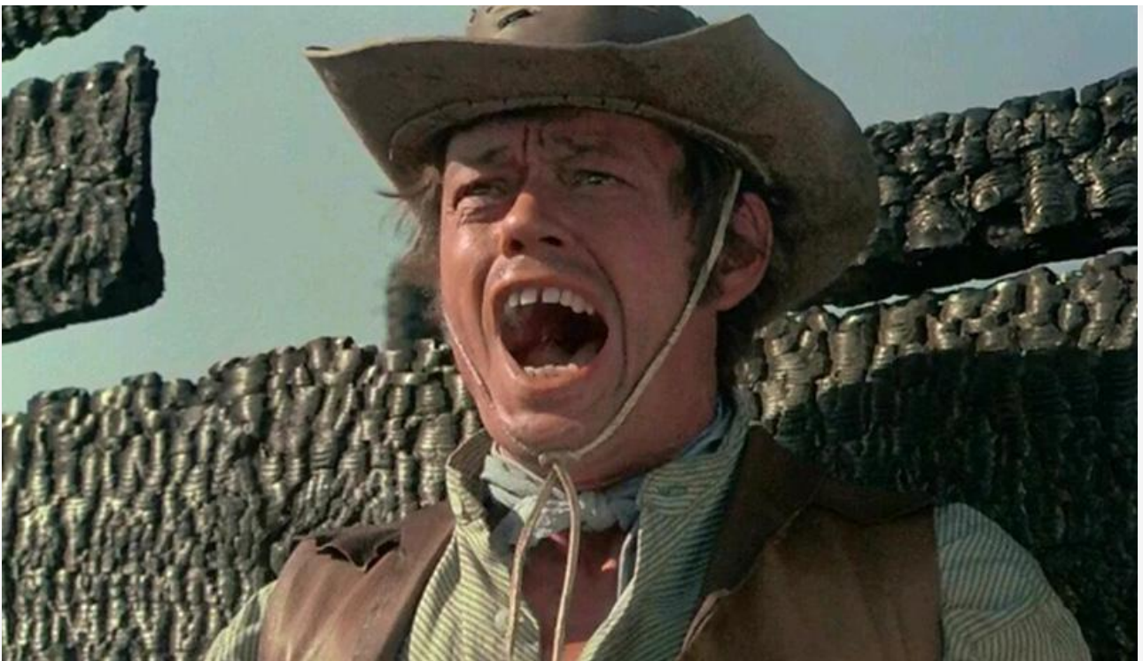
Билли Кинг в фильме «Человек с бульвара Капуцинов», 1987 год

Голосом Караченцова говорили с отечественных экранов Жан-Поль Бельмондо, Патрик Девер и индеец Джо Талгата Нигматуллина в «Приключениях Тома Сойера и Гекльберри Финна», а также герои многочисленных мультфильмов.