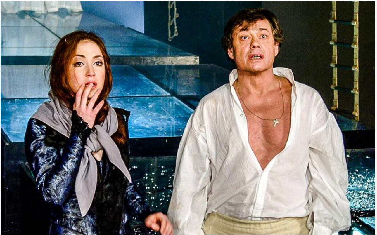
Граф Резанов в спектакле «Юнона и Авось». Театр Ленком, постановка 1981 года

Первую главную роль в кино – студента Владимир Бусыгина в телевизионной драме Виталия Мельникова по пьесе Александра Вампилова «Старший сын» – Николай Караченцов сыграл спустя восемь лет после окончания Школы-студии.