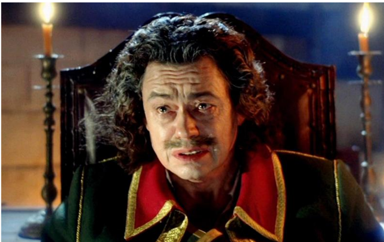
Пётр I в фильме «Тайны дворцовых переворотов. Россия, век XVIII», 2000 год