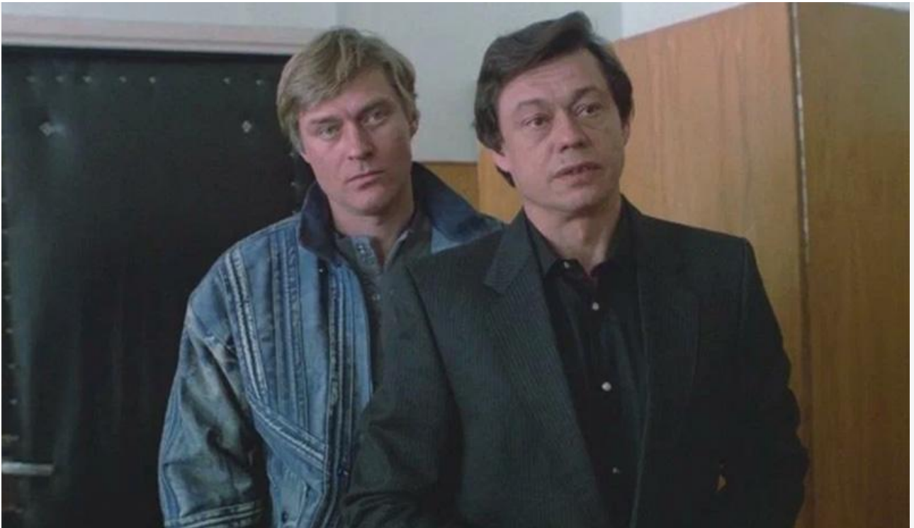
Марат Муханов в фильме «Криминальный квартет», 1989 год