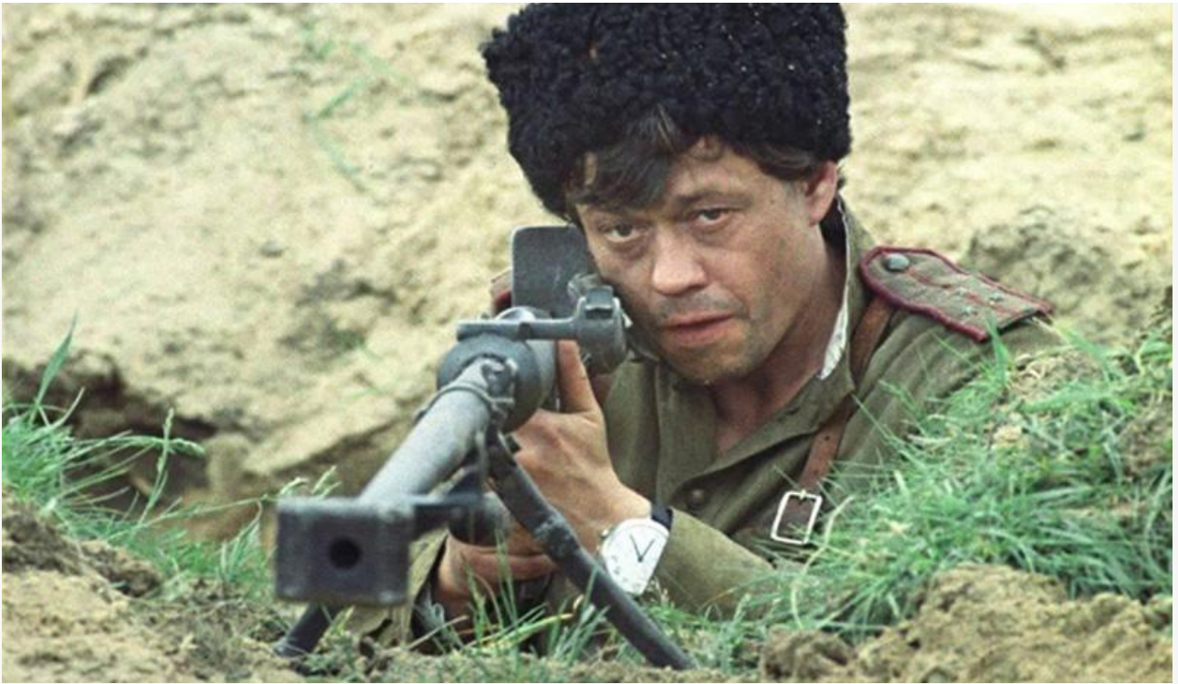
Старший лейтенант Николай Орлов в фильме «Батальоны просят огня», 1985 год

Николай Караченцов вошёл в историю как самый поющий из востребованных театральных и киноактёров. Им было записано более 200 песен и выпущено полтора десятка дисков.