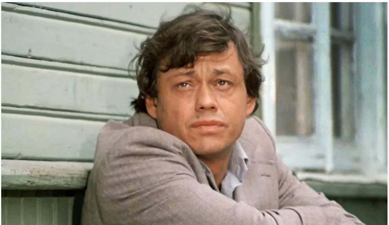
Вася Ходас в фильме «Белые росы», 1983 год