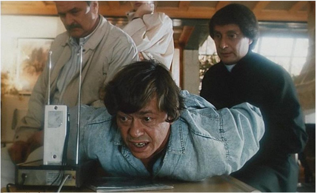
Даниэль Корбан в фильме «Ловушка для одинокого мужчины», 1990 год