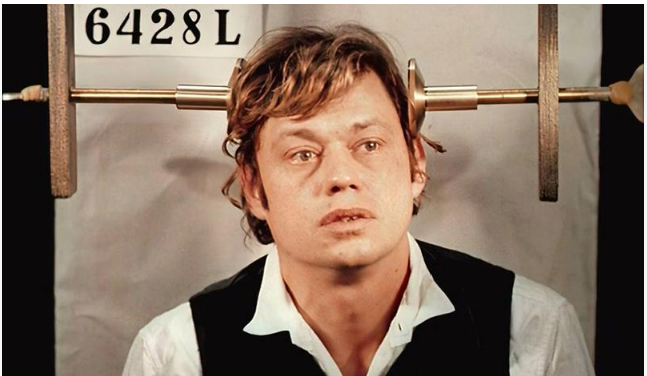
Джефферсон Хоуп в фильме «Шерлок Холмс и доктор Ватсон: Кровавая надпись», 1979 год