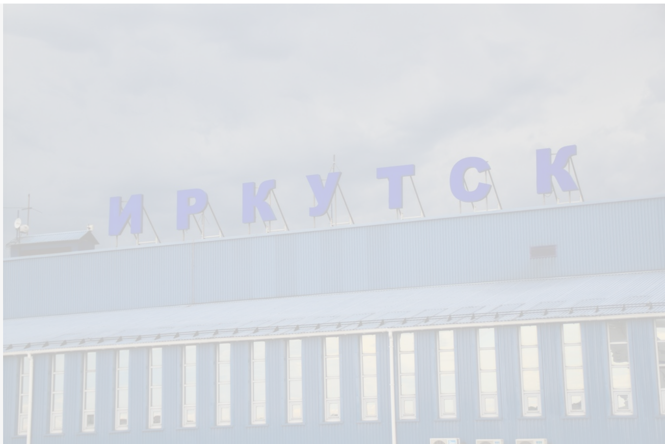
Автор: Кирилл Шипицин Фото из альбома "Иркутск. Аэропорт" © Фотобанк "RuVabr"