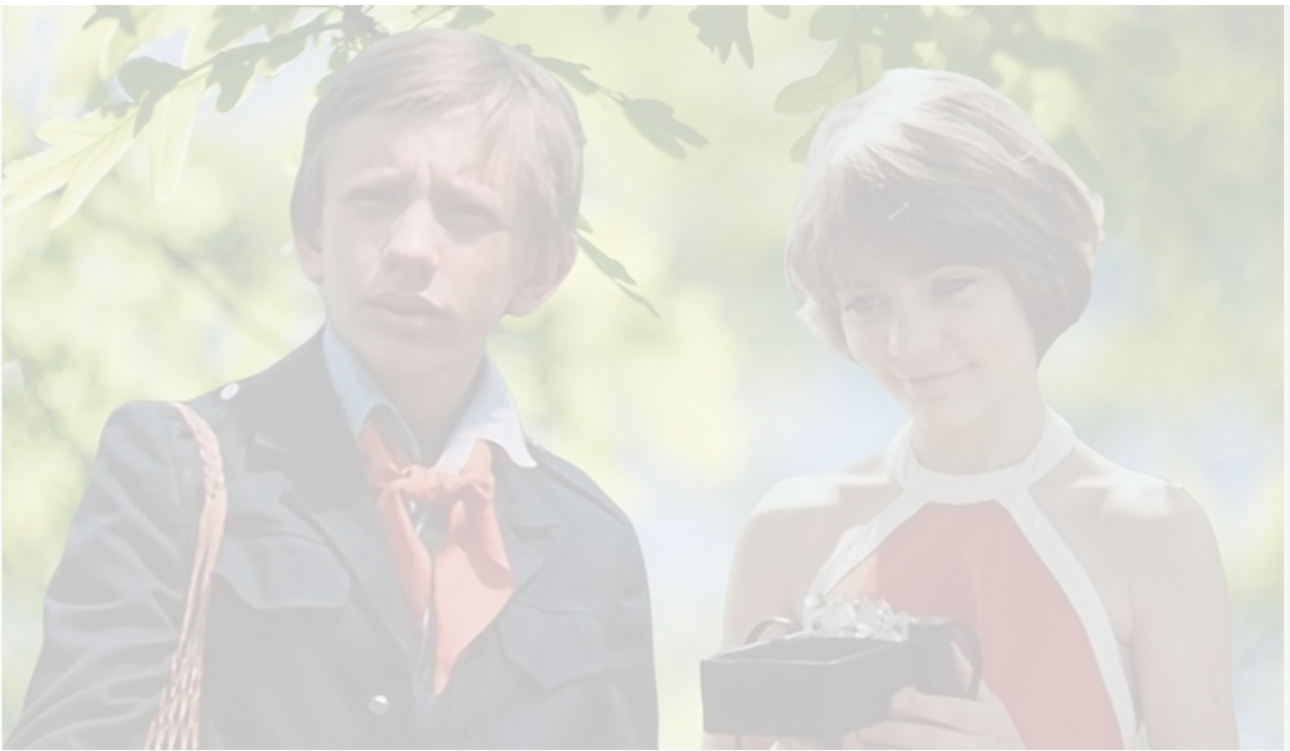
Кадр из фильма «Гостя из будущего», 1984 год

Человека надо принимать таким, какой он есть. Иначе растеряешь друзей.