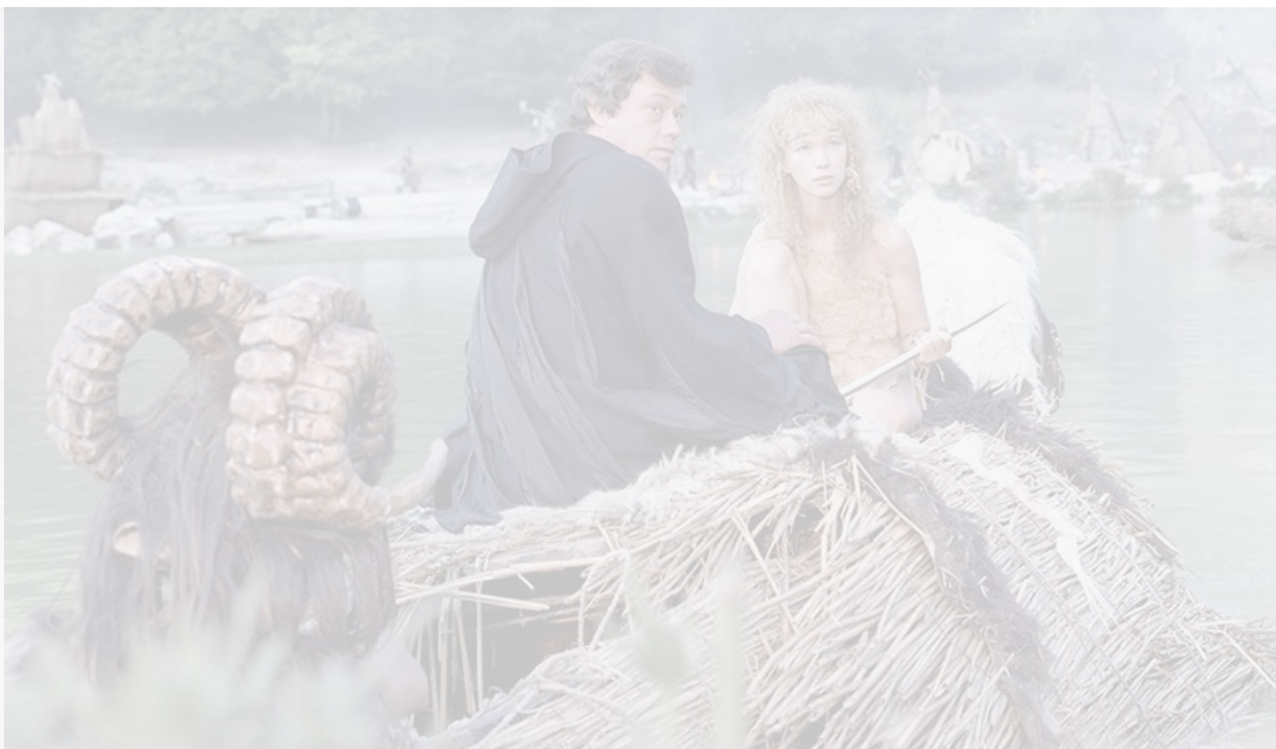
Кадр из фильма «Подземелье ведьм», 1990 год

Правда всегда в конце концов побеждает, но, если мы не поможем ей, она может победить слишком поздно.