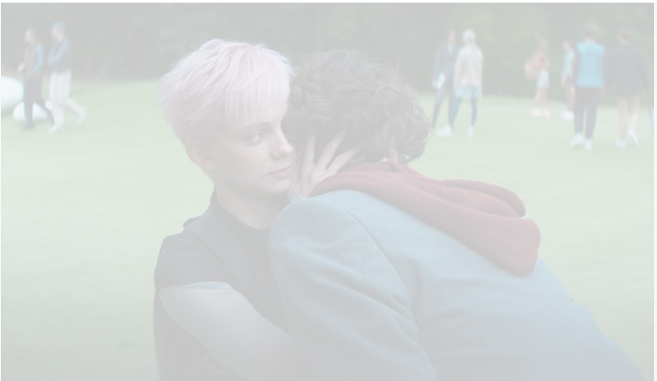
Кадр из фильма «Сто лет тому вперёд», 2024 год

В нашем государстве императорские указы не проверяются. Один мальчик проверил – и где он висит?