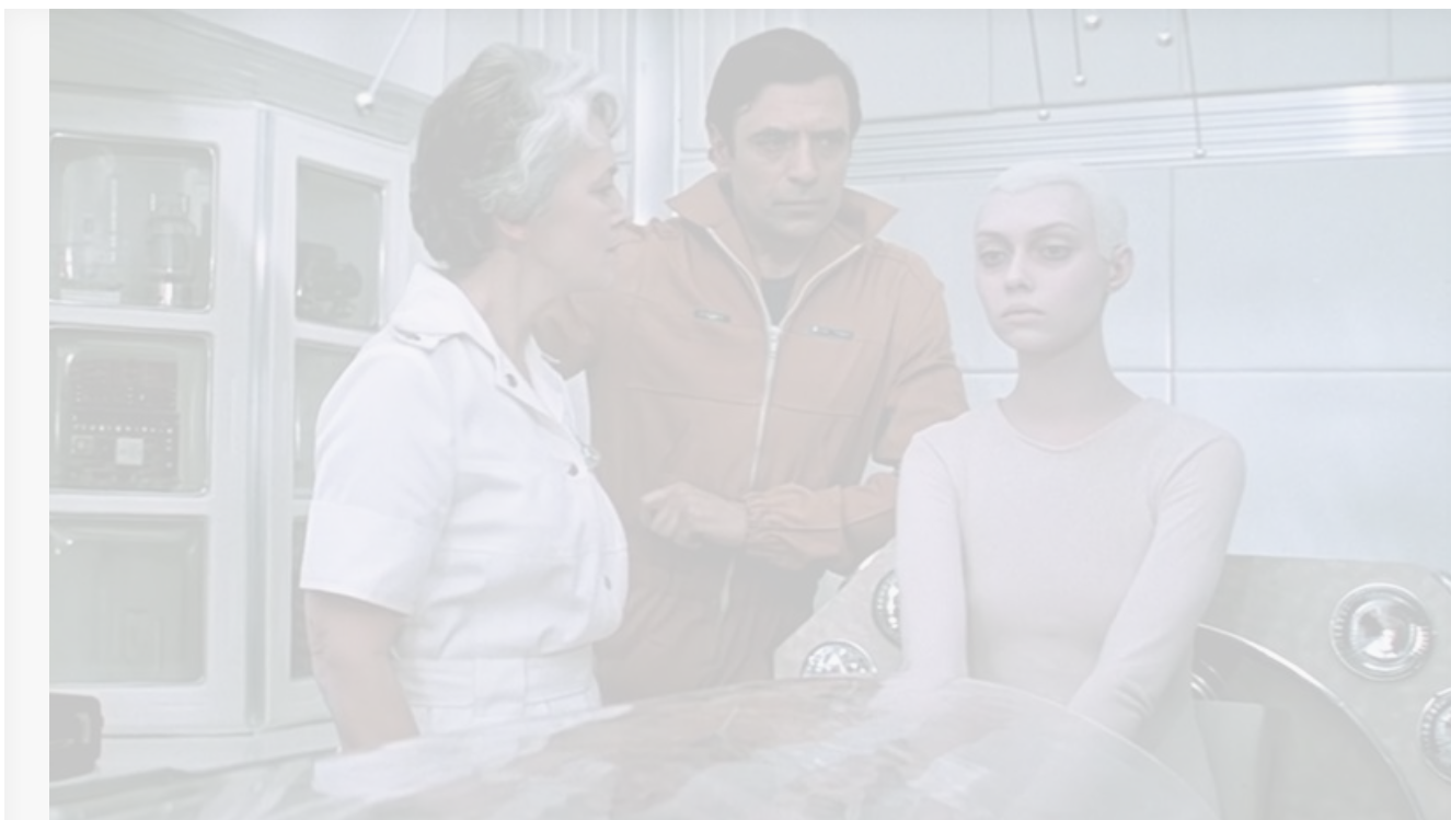
Кадр из фильма «Через тернии к звёздам», 1980 год

К юбилею Кира Булычёва, ушедшего из жизни 5 сентября 2003 года в возрасте 68 лет, мы по традиции публикуем цитаты из его произведений и кадры из снятых по ним фильмам.