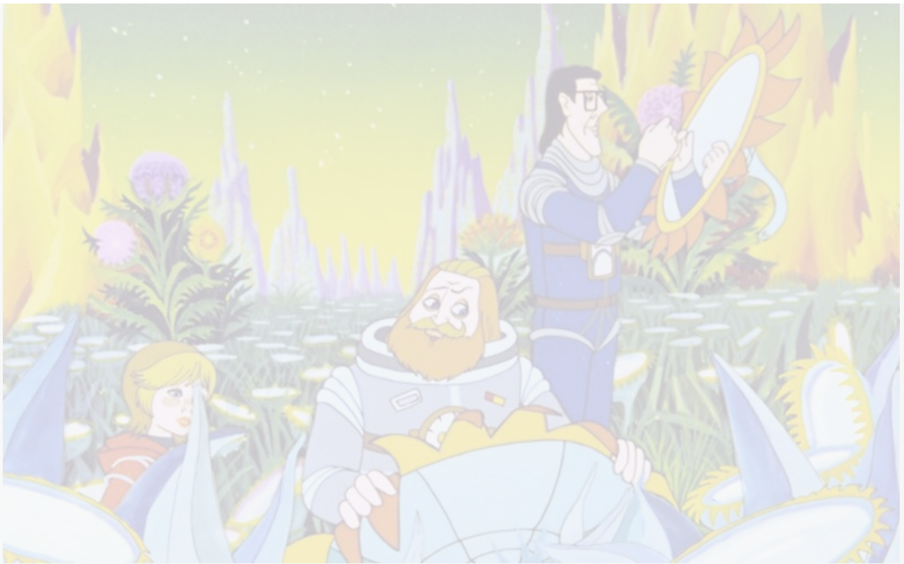
Кадр из фильма «Тайна третьей планеты», 1981 год

Традиция – это то, что никому не нужно, но от чего трудно отказаться.