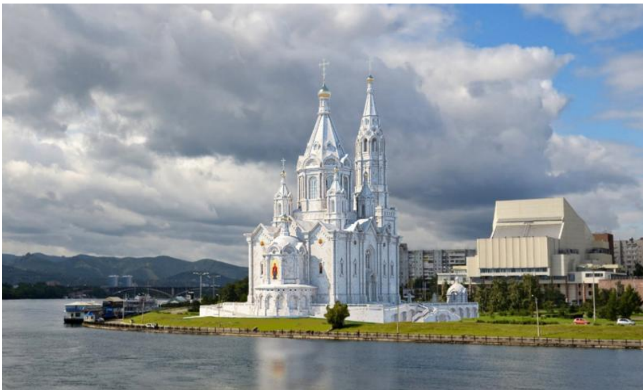
Фото: Красноярская епархия РПЦ

Автор: Денис Большаков © Babr24.com РЕЛИГИЯ, ПОЛИТИКА, ОБЩЕСТВО, КРАСНОЯРСК 👁 31904 18.10.2024, 17:29 🔄 191