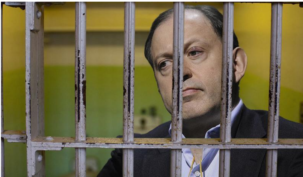
Фото: t.me/kras_mash , dela.ru

Автор: Анна Роменская © Babr24.com СКАНДАЛЫ, ТРАНСПОРТ, ЭКОНОМИКА И БИЗНЕС, КРАСНОЯРСК 👁 12518 17.10.2024, 16:32 🏠 123