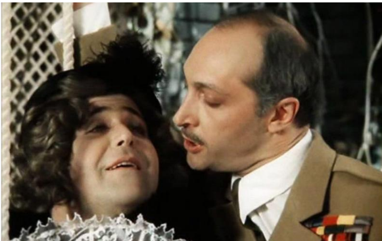
Полковник Френсис Чесней в фильме «Здравствуйте, я ваша тётя!», 1975 год