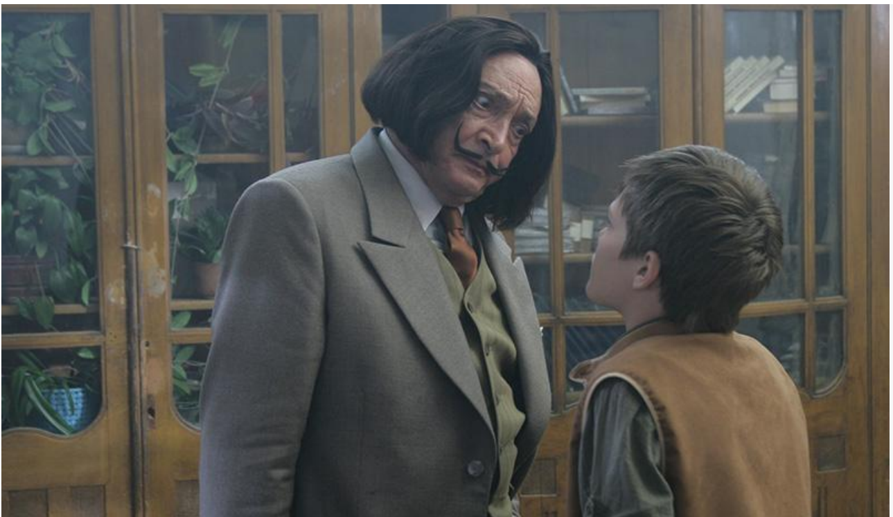
Директор школы в фильме «Сказка. Есть». Последняя роль в кино, 2011 год

Режиссёрская кинокарьеря Михаила Козакова началась в 1978 году с ныне культовой телевизионной мелодрамы «Безымянная звезда» с Анастасией Вертинской и Игорем Костолевским в главных ролях. Ещё больший успех ждал следующий фильм мастера – комедийную мелодраму «Покровские ворота» по пьесе Леонида Зорина, с успехом шедшей на сцене Театра на Малой Бронной. Картина не только прославила юного