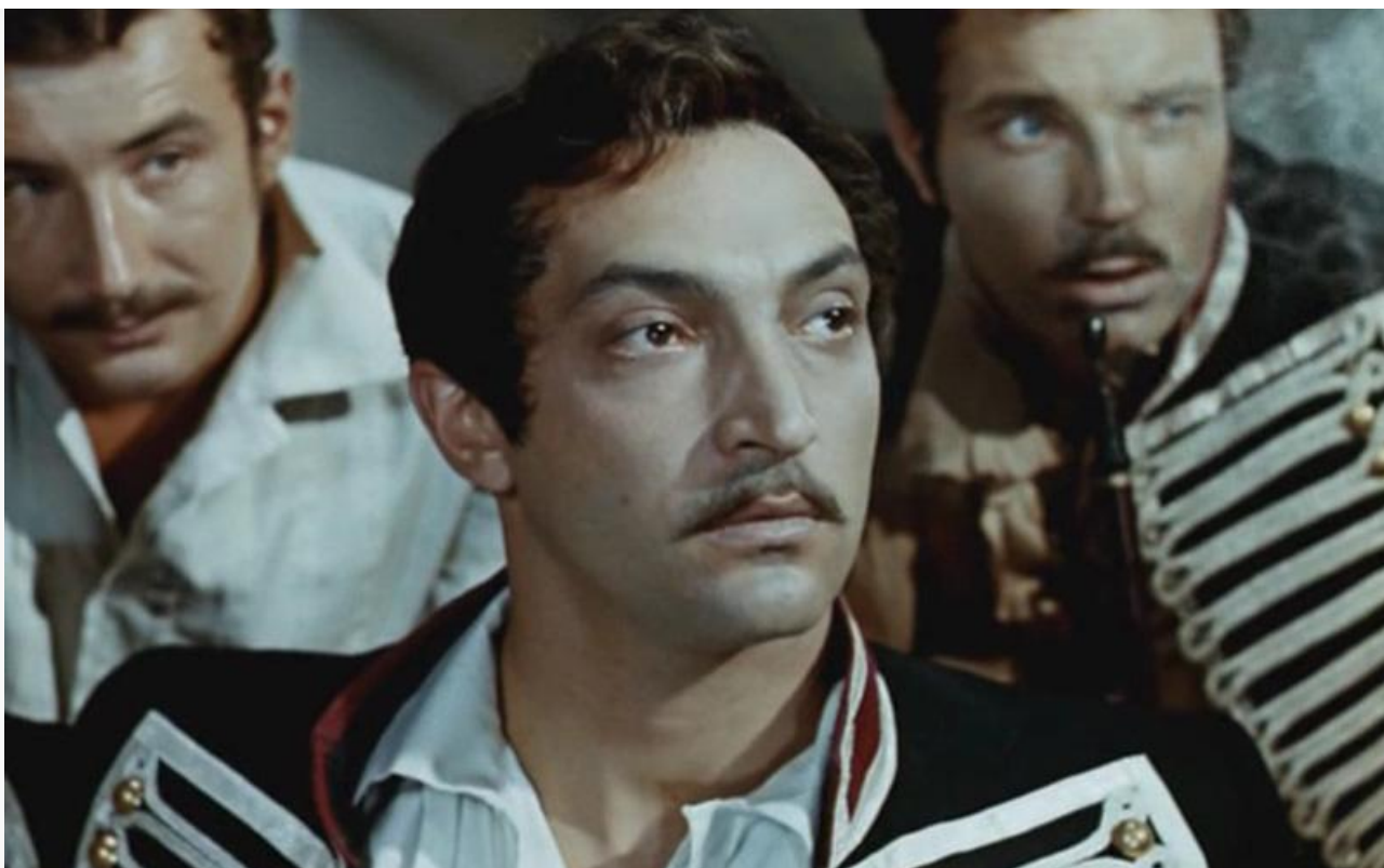
Сильвио в фильме «Выстрел», 1966 год