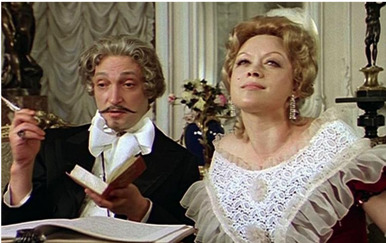
Виконт де Розальба в фильме «Соломенная шляпка», 1974 год