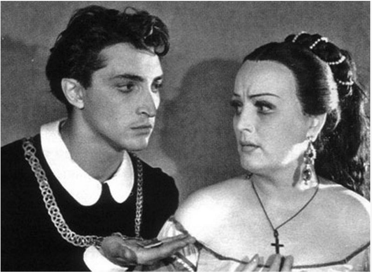
Гамлет в спектакле «Гамлет». Театр имени Маяковского, 1956 год

Мятущаяся натура Козакова удержала его в «Маяковке» на три сезона. Затем были «Современник», МХАТ, Театр на Малой Бронной, Ленком, Камерный театр Тель-Авива, и, уже после возвращения из Израиля, «Русская антреприза Михаила Козакова» и участие в постановках Театра имени Комиссаржевской, Театра имени Моссовета и театра «Школа современной пьесы».