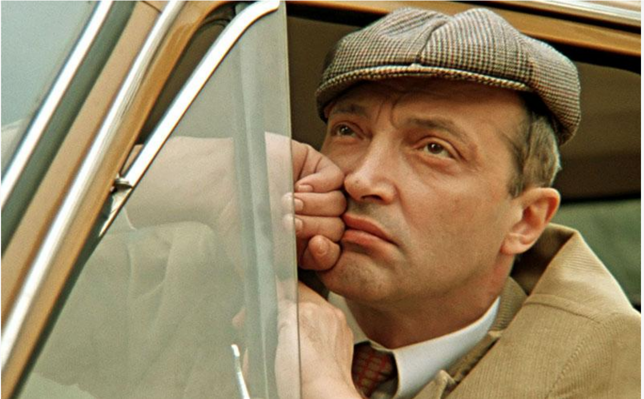
В фильме «Покровские ворота», 1982 год

В 1969 году Михаилу Козакову было присвоено звание «Заслуженный артист