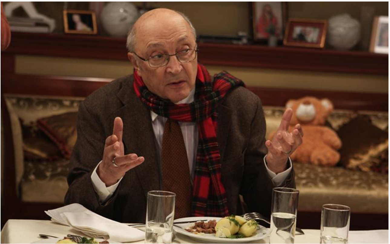
Доктор Коган в фильме «Любовь-морковь 3», 2011 год