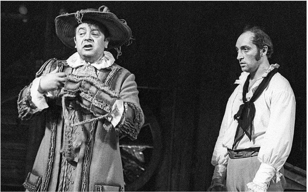
Дон Жуан в спектакле «Дон Жуан». Театр на Малой Бронной, 1973 год

В кино и на телевидении Михаил Козаков сыграл более 70 разноплановых ролей. Наиболее знаковые из них – Педро Зурита в «Человеке-амфибии» Геннадия Казанского и Владимира Чеботарёва, Сильвио в экранизации повести Пушкина «Выстрел» Наума Трахтенберга, виконт де Розальба в «Соломенной шляпке» Леонида Квинихидзе, полковник Френсис Чесней в «Здравствуйте, я ваша тётя!» Виктора Титова, Грильо в «Господине оформителе» Олега Тепцова, Александр Таиров в «Смерти Таирова» Бориса Бланка.