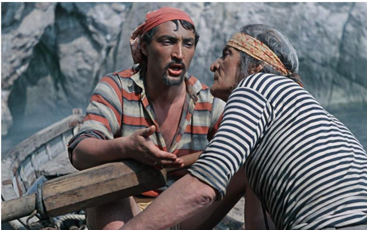
Педро Зурита в фильме «Человек-амфибия», 1961 год