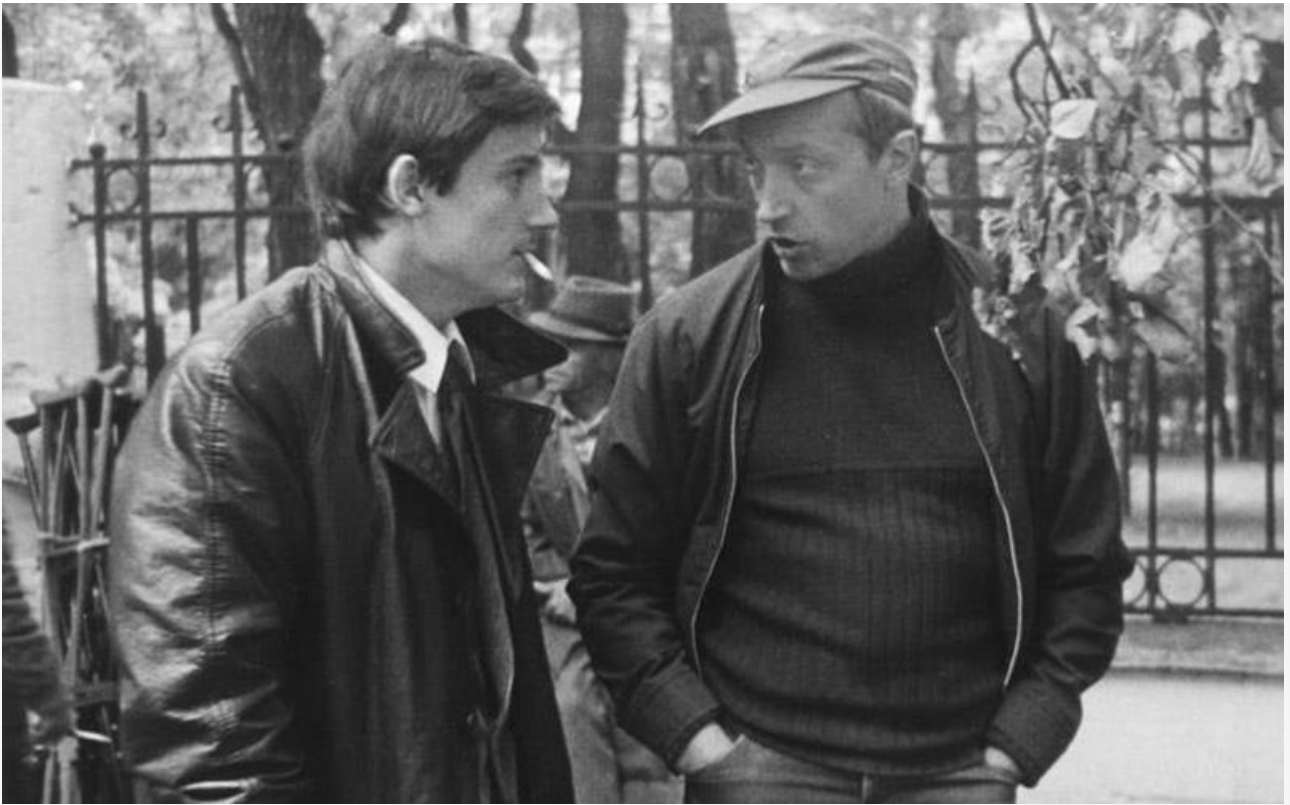
С Олегом Меньшиковым на съёмках фильма «Покровские ворота»