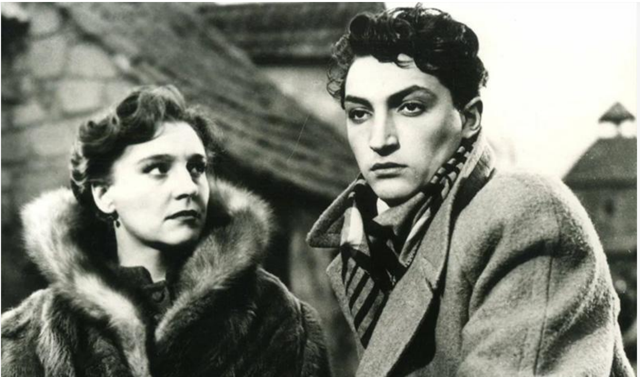
Шарль Тибо в фильме «Убийство на улице Данте». Дебют в кино,