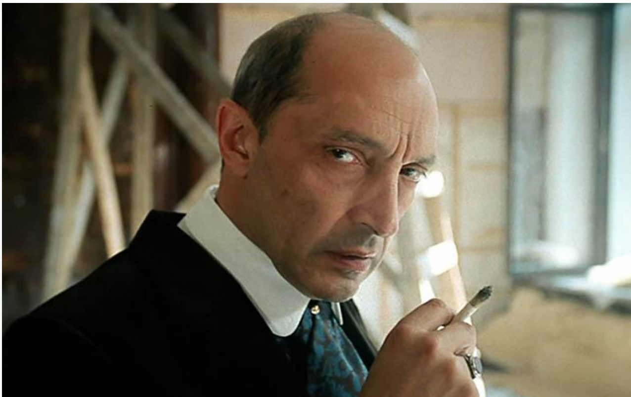
Грильо в фильме «Господин оформитель», 1988 год

Кроме того, голосом Михаила Козакова говорили с экранов Жан-Клод Бриали в «Дьяволе и десяти заповедях», Рольф Хоппе в «Трёх орешках для Золушки», Марлон Брандо в «Супермене», Александр Трофимов в «Д'Артаньяне и трёх мушкетёрах», а также Антуан Эго в «Рататуте», падишах в «Муке-сороходе» и очаровательный застенчивый Слонёнок в серии мультфильмов Ивана Уфимцева и Леонида Шварцмана «38 попугаев».