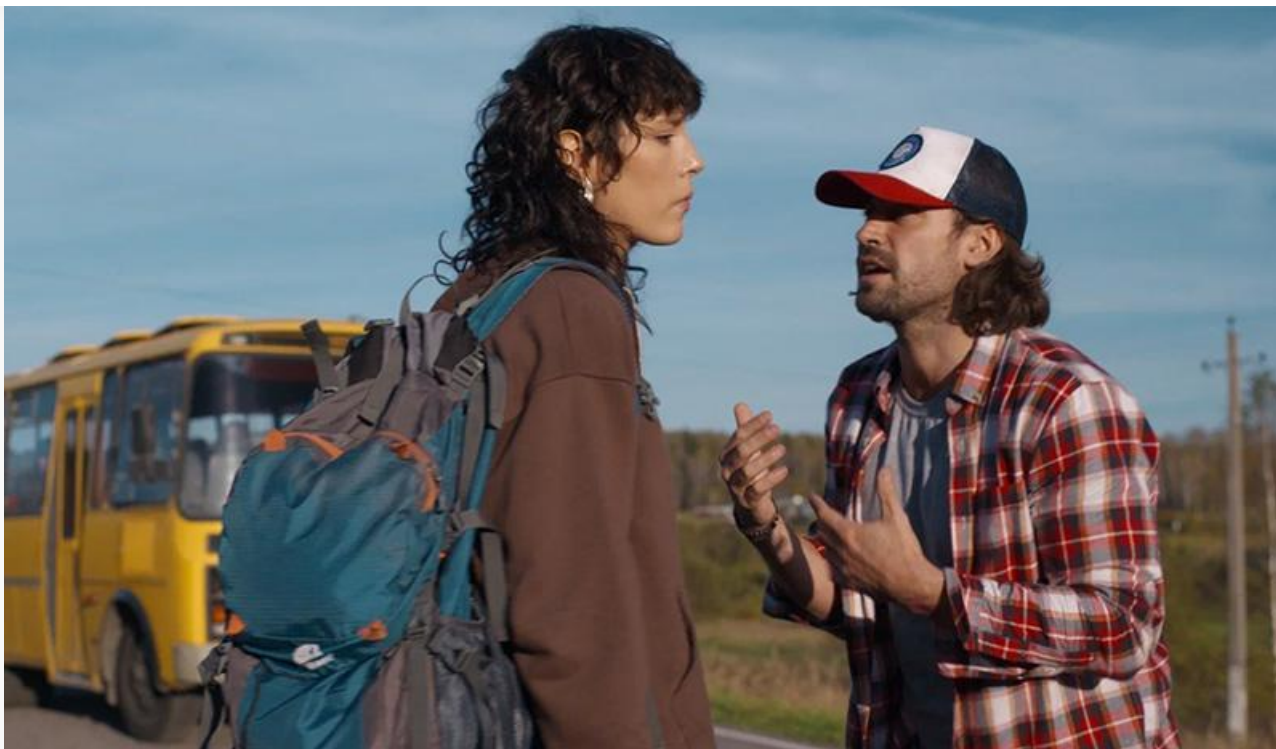
Кадр из фильма «Говорит Земля!»