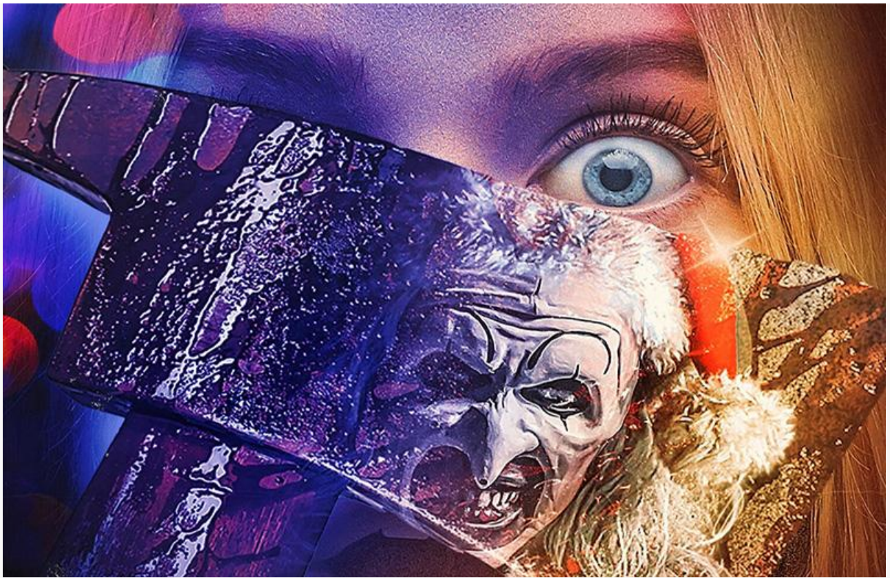
Постер к фильму «Ужасающий 3»