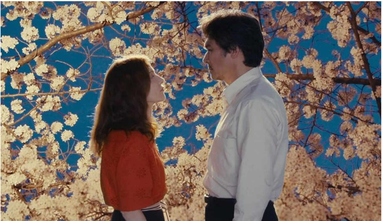
Кадр из фильма «Сидони в Японии»