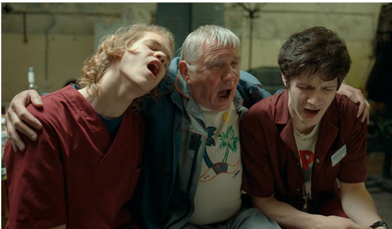
Кадр из фильма «Особенности»