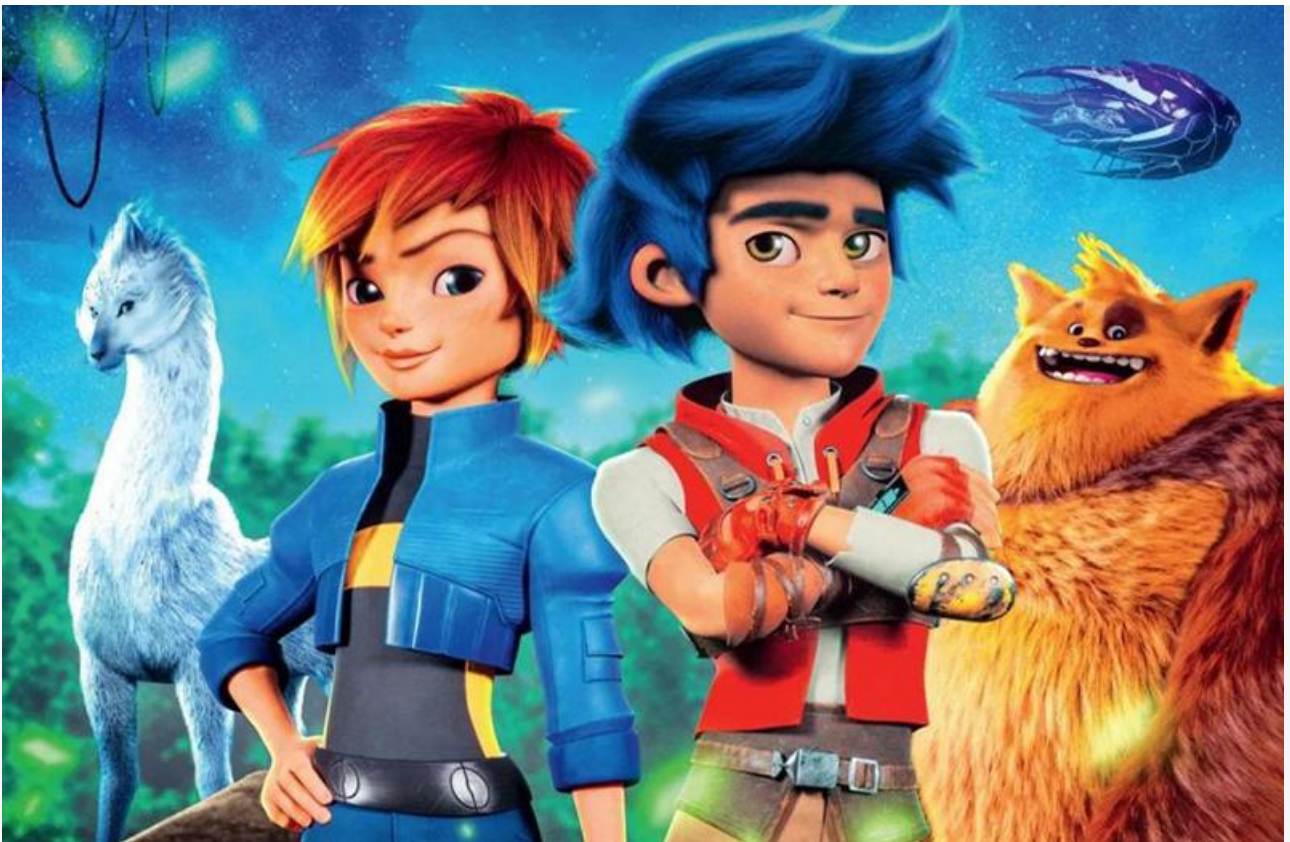
Постер к фильму «Пушистое превращение»