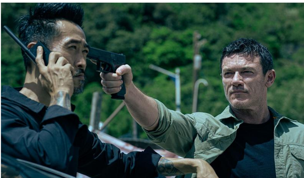
Люк Эванс в фильме «Агент на уикенд»