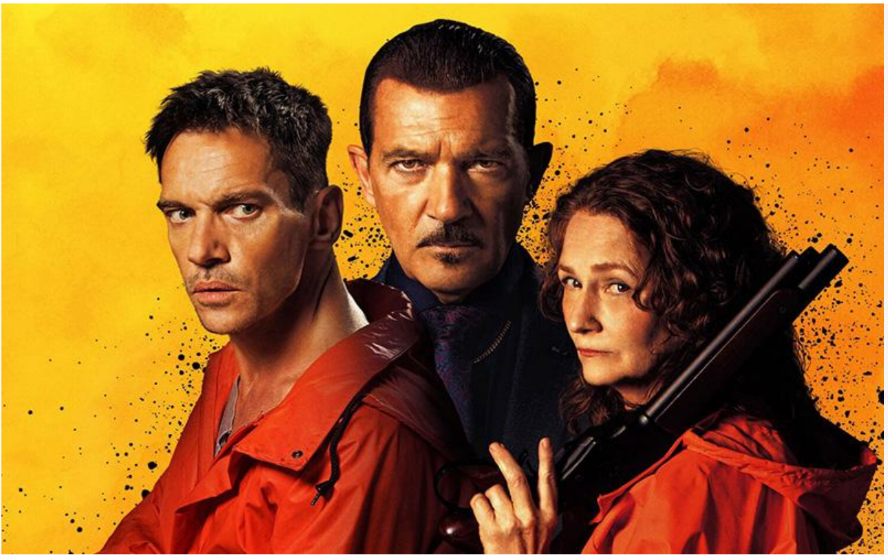
Постер к фильму «Команда зачистки»