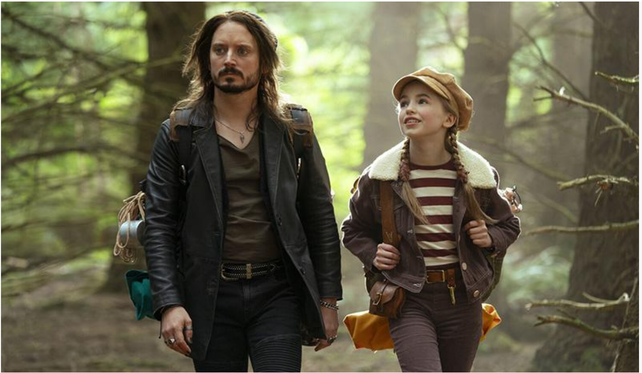
Кадр из фильма «Фантастическое путешествие»

Внимание поклонников фильмов ужасов в ближайшие выходные будет сосредоточено на « Ужасающем 3 » (18+) Дэмиена Леоне. Кроме того, впервые на больших экранах России будет показан южнокорейский хоррор Ким Джи-уна « История двух сестёр » (18+), мировая премьера которого состоялась в 2003 году.