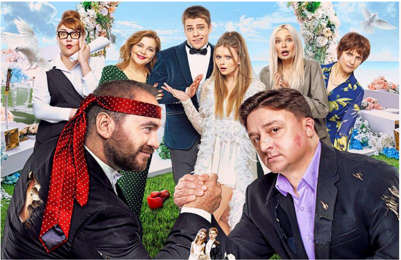
Постер к фильму «Битва пап»