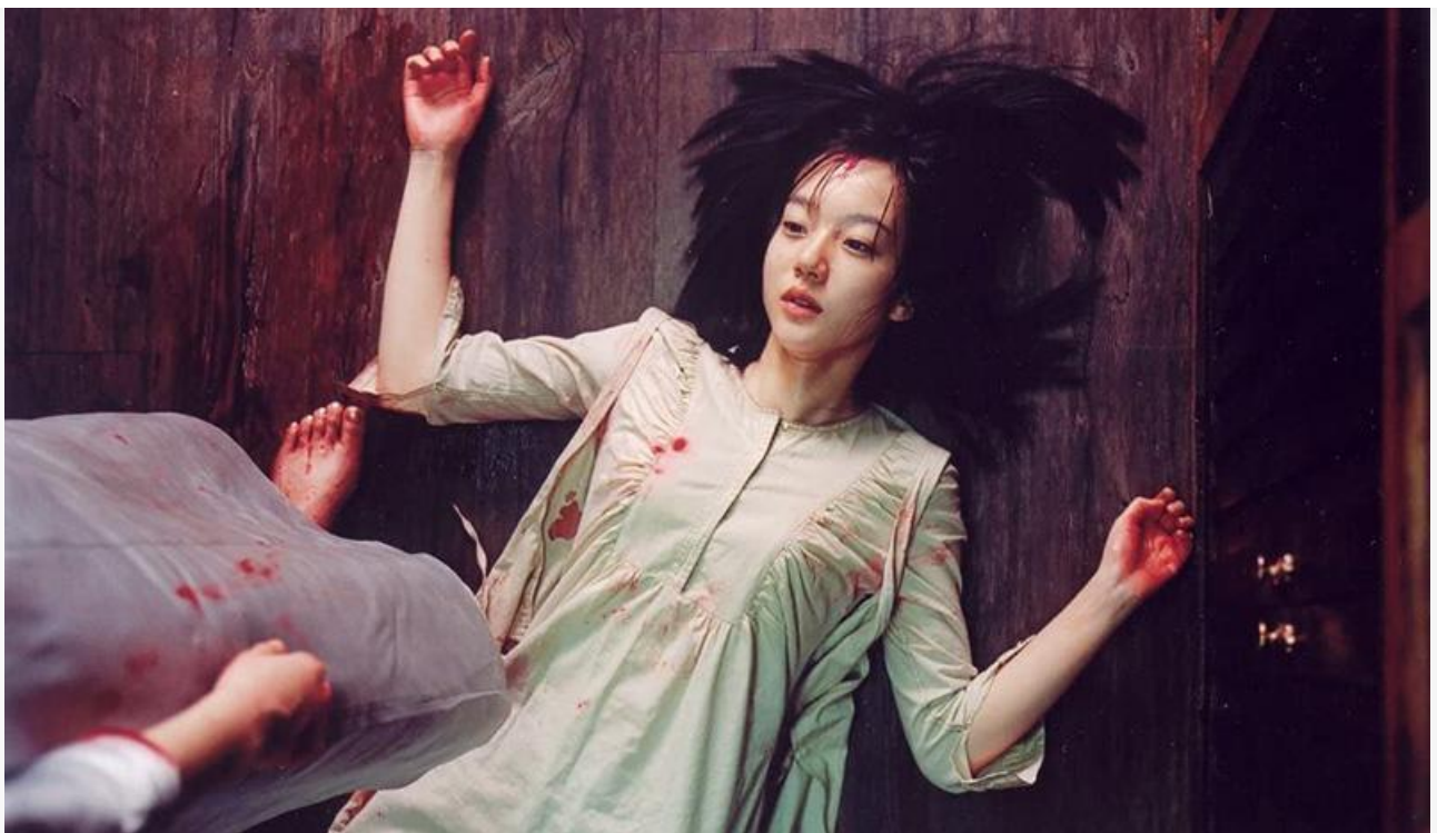
Кадр из фильма «История двух сестёр»