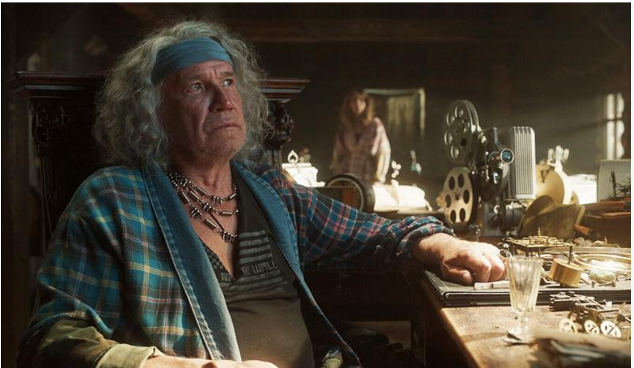
Сергей Гармаш в фильме «Василиса и хранители времени»

Прекрасно держится в прокате боди-хоррор Корали Фаржеа «Субстанция» с Маргарет Куолли и Деми Мур, к своему третьему уикенду потерявший в сборах минимальные 7 % и всего на 344 экранах пополнивший копилку на 36,9 миллиона рублей.