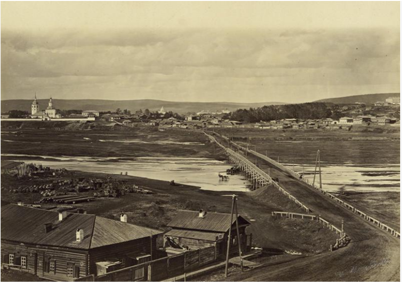
Знаменское предместье Иркутск

Еще в 19-м веке строительство дач на берегах Ушаковки было признаком статуса и престижа. Дорогие участки земли покупали в основном состоятельные люди: купцы и банкиры. Однако владельцы дач должны были представить проекты, которые бы приносили пользу простым горожанам.