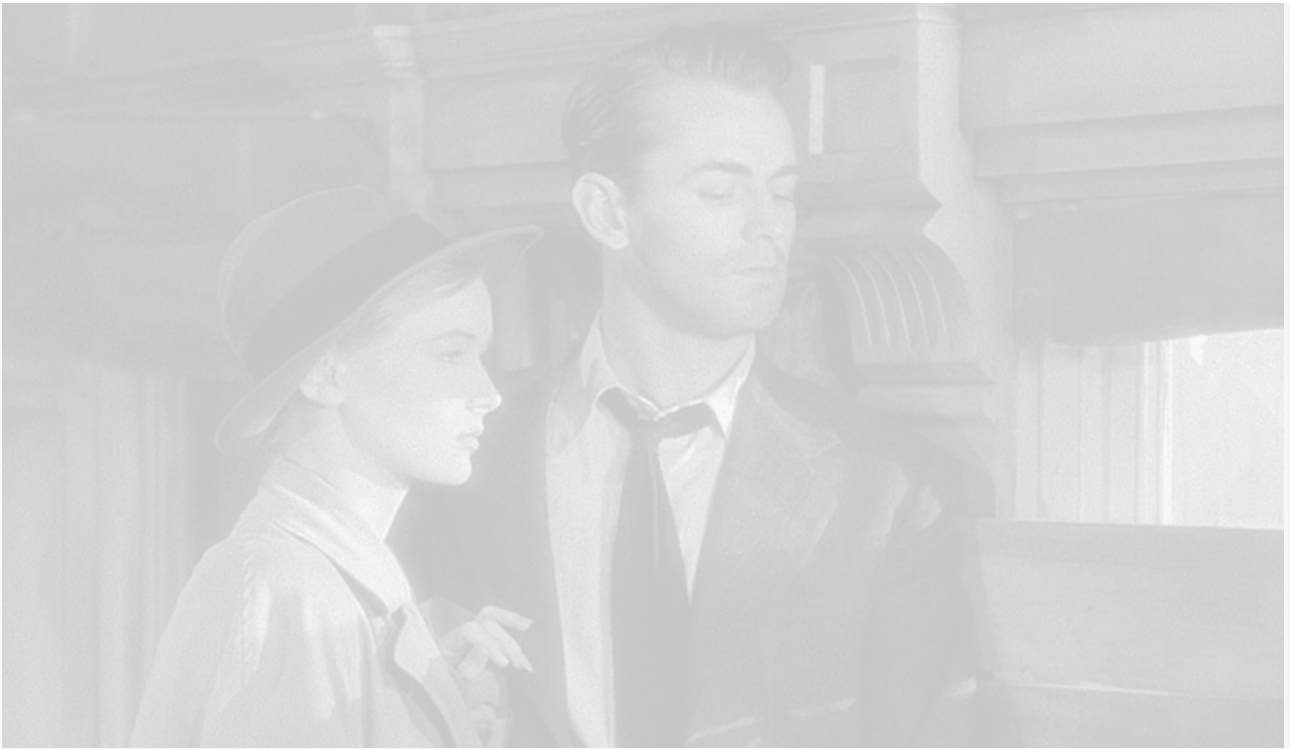
Вероника Лэйк и Алан Лэдд в фильме «Оружие для найма» по роману «Наёмный убийца». США, 1942 год

Многолетний банковский опыт научил меня, что обшарпанный потребитель виски предпочтительнее и надёжнее, чем хорошо одетый потребитель пива.