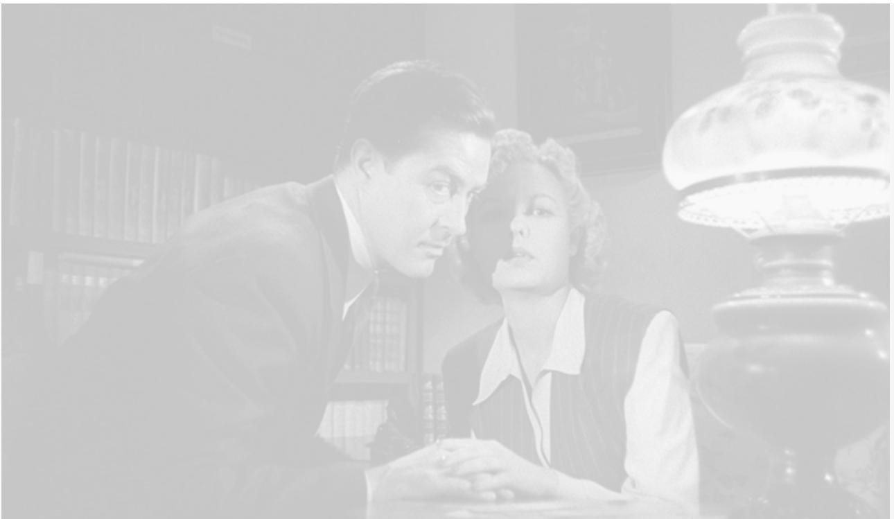
Рэй Милланд и Марджори Рейнольдс в фильме «Министерство страха» по одноимённому роману. США, 1943 год

– Если бога нет, для меня всё на свете бессмысленно.