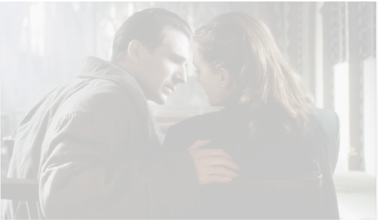
Рэйф Файнс и Джулианна Мур в фильме «Конец романа» по одноимённой повести. Великобритания, США, 1999 год

Если вы не можете сменить привычный бар на другой, значит, вы постарели.