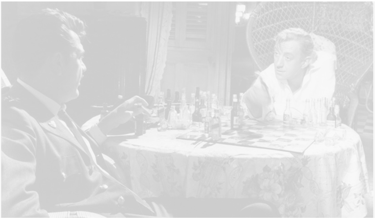
Алекс Гиннесс и Эрнст Ковач в фильме «Наш человек в Гаване» по одноимённому роману. Великобритания, 1959 год

Любому католику известно, что легенда, в которую верят, обладает той же ценностью и силой воздействия, что и истина.