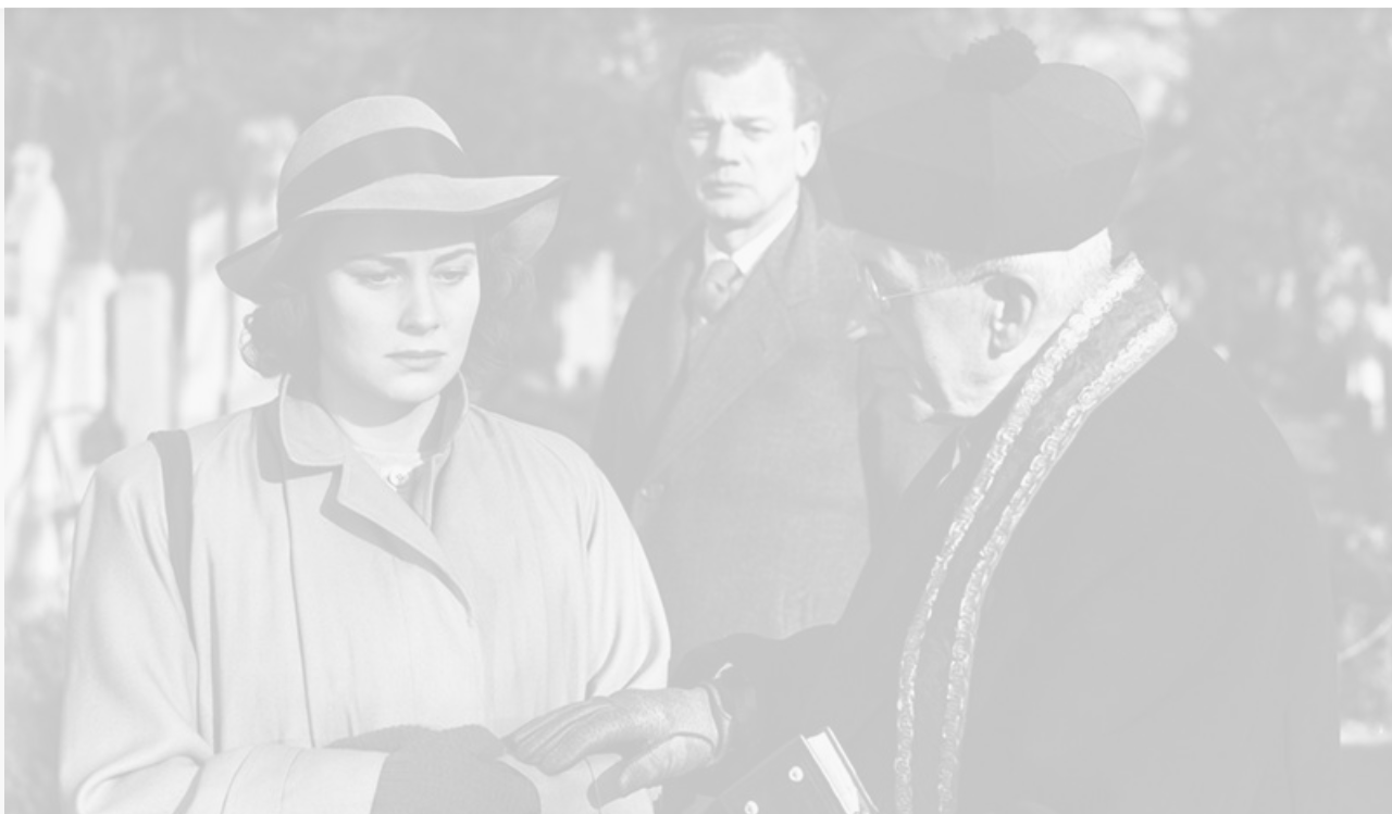
Кадр из фильма «Третий человек». Великобритания, 1949 год

Годом ранее фильм Кэрола Рида по сценарию Грина «Третий человек» удостоился премии BAFTA в категории «Лучший фильм» и «Золотой пальмовой ветви» Каннского кинофестиваля. В 1999 году Британский институт кино признал «Третьего человека» лучшим британским фильмом XX века.