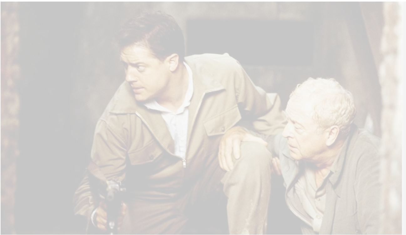
Брендан Фрейзер и Майкл Кейн в фильме «Тихий американец» по одноимённому роману. Великобритания, Германия, США, Вьетнам, Франция, 2001 год

Я завидовал тем, кто верит в Бога, но не доверял им. Я знал, что они поддерживают свой дух басней о неизменном и вечном. Смерть куда надёжнее бога, и с её приходом уходит повседневная угроза, что умрёт любовь.