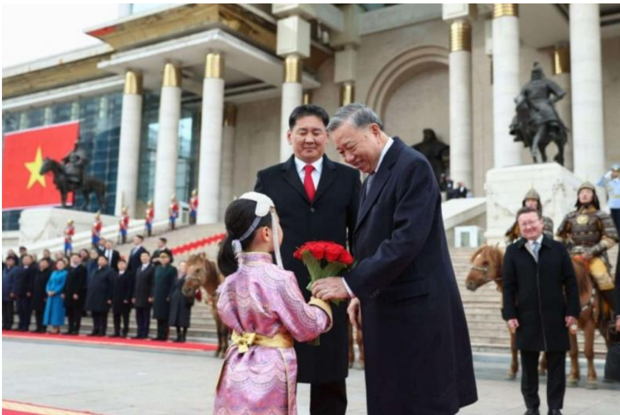
Фото: пресс-служба правительства Монголии

Автор: Денис Большаков © Babr24.com ПОЛИТИКА, ЭКОНОМИКА И БИЗНЕС, МОНГОЛИЯ 👁 15298 02.10.2024, 12:15 📄 183