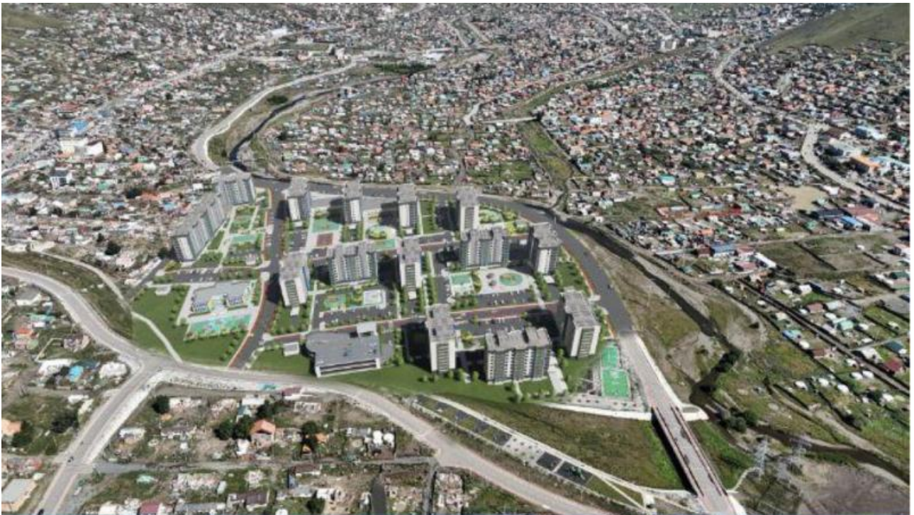
Проект будущего города