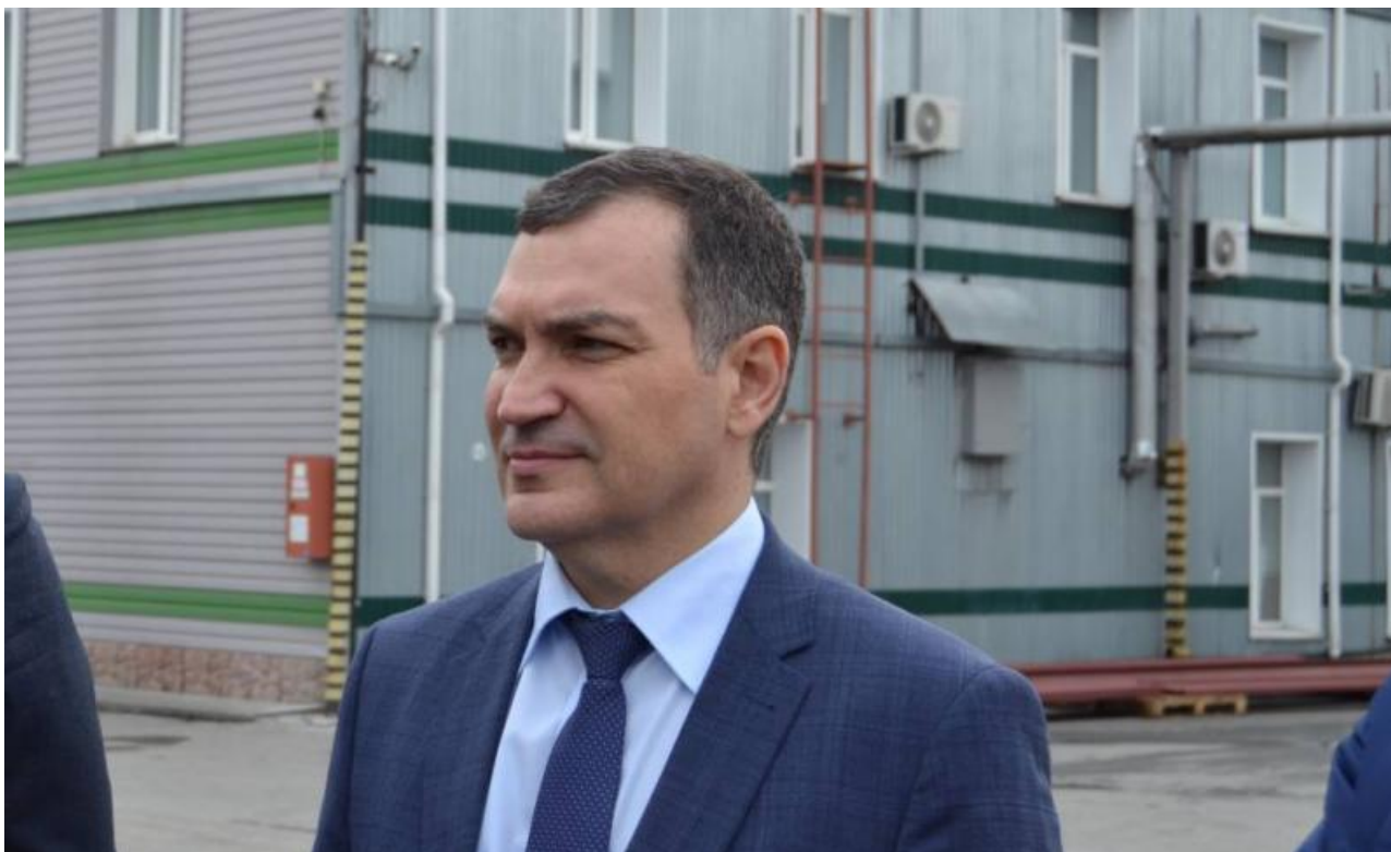
Фото: пресс-служба правительства Новосибирской области

Автор: Ярослава Грин © Babr24.com Источник: t.me/sidpolit ПОЛИТИКА, НОВОСИБИРСК 👁 17400 01.10.2024, 16:30 📄 90