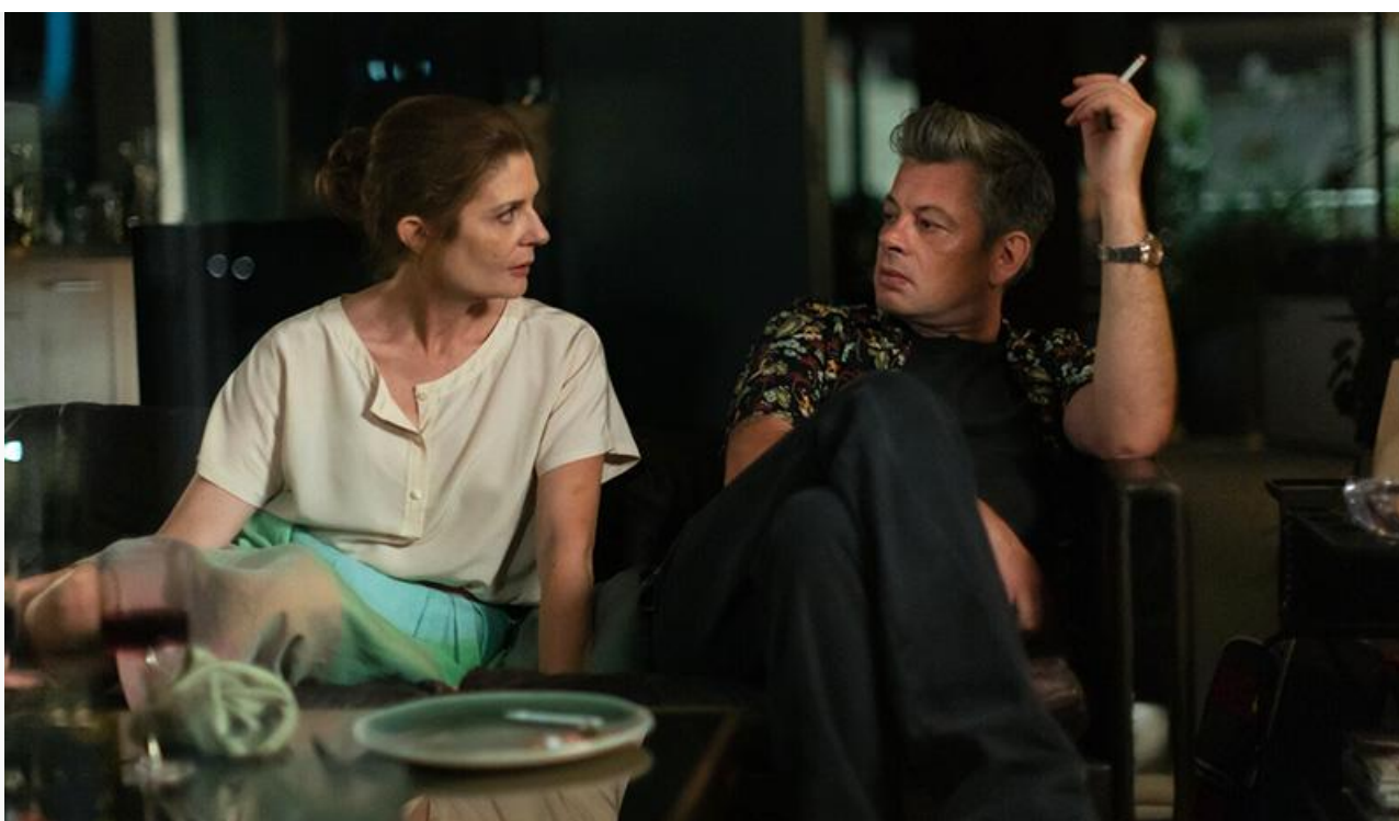
Кадр из фильма «Мой Марчелло»

В формате перевыпуска зрители смогут вновь увидеть на больших экранах вестерн Серджио Корбуччи «Джанго» , впервые вышедший на экраны в 1966 году, и аниме Хаяо Миядзаки 1989 года «Ведьмина служба доставки» .