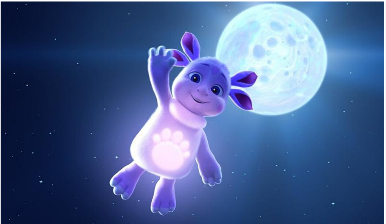
Кадр из фильма «Лунтик. Возвращение домой»

Относительно успешно, пропустив вперёд лишь «Лунтика» и «Графа Монте-Кристо», начали прокат боди-хоррор Корали Фаржеа «Субстанция» с Маргарет Куолли и Деми Мур, забравший «бронзовые медали» уикенда с суммой 31,7 миллиона и средней посещаемостью 121,2 зрителя за сеанс, иронично-фантастическая комедия Анны Курбатовой «Маме снова 17» со Светланой Ходченковой, собравшая 26,8 миллиона при средней посещаемости 43,5 зрителя за сеанс и занявшая четвёртое место, и супергеройский боевик ужасов Брайана Тейлора «Хеллбой: Проклятие Горбуна» с Джеком Хеси, привлёкший в среднем 39,3 зрителя за сеанс и ставший пятым с прибылью 26,1 миллиона рублей.