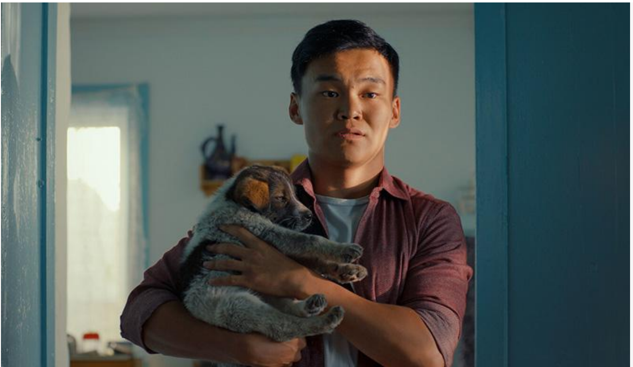
Бато Шойнжонов в фильме «9 секунд»