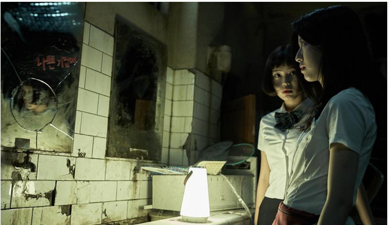
Кадр из фильма «Астрал. Шёпот мёртвых 2»

Серебряный и бронзовый призёры предыдущего уикенда – « Игра киллера » Дж. Дж. Петри и « Любовь зла » Дениса Гуляра и Гайка Асатряна – потеряли в сборах существенные 59 и 65 % и с доходом 9,8 и 7,6 миллиона откатились на шестое и восьмое места.