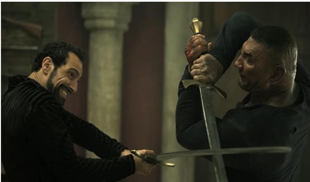
Кадр из фильма «Игра киллера»

Покинули топ-10 «Ворон», «Холоп из Парижа», «Обе две», «Приют: Шёпот призраков» и «Легенда».