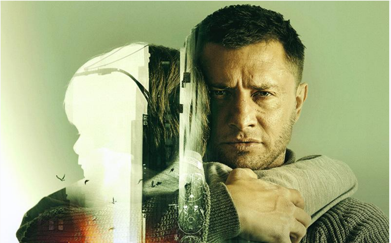
Постер к фильму «Мужское слово»