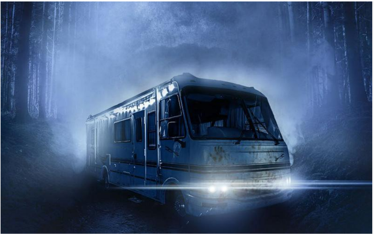
Постер к фильму «Полтергейст: Другое измерение»