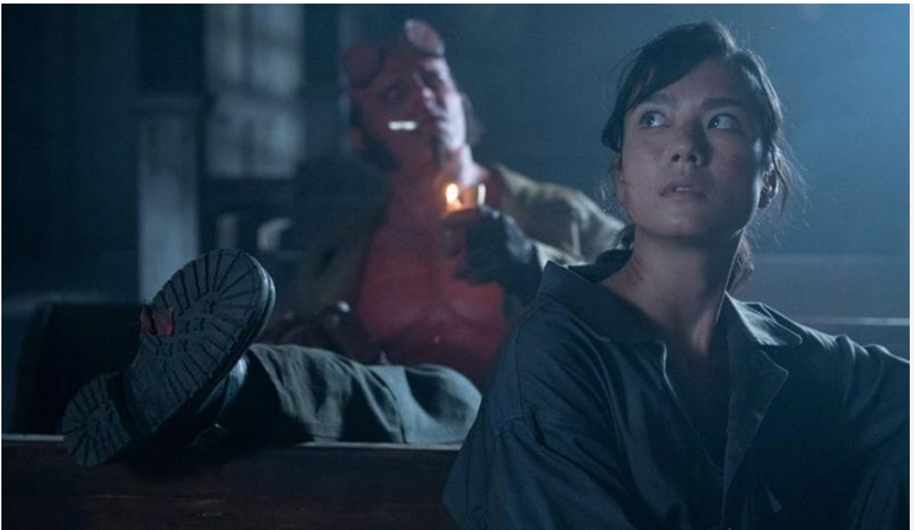
Кадр из фильма «Хеллбой: Проклятие Горбуна»