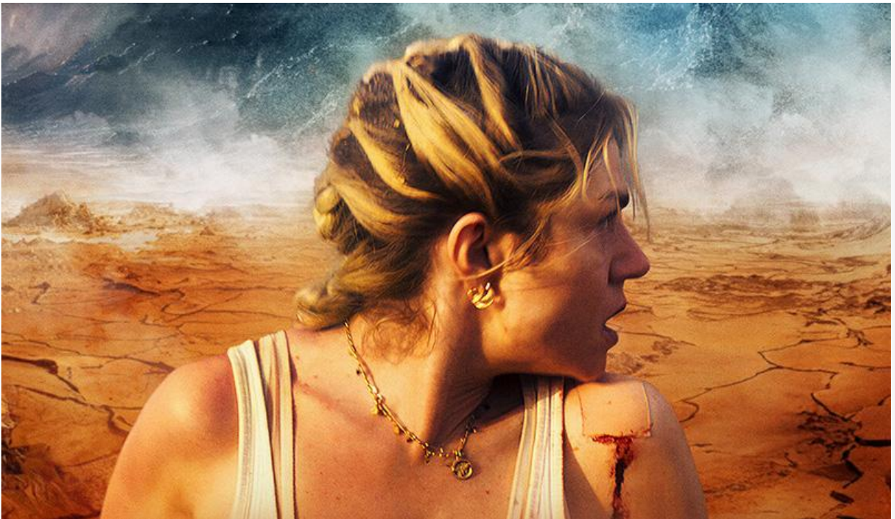
Постер к фильму «Последний день Земли»

Поклонников фильмов ужасов ждут в кинотеатрах американские хорроры «Астрал. Стереоскоп демона» (18+) Лены Цодыковской и «Полтергейст: Другое измерение» (18+) Энди Фикмена.