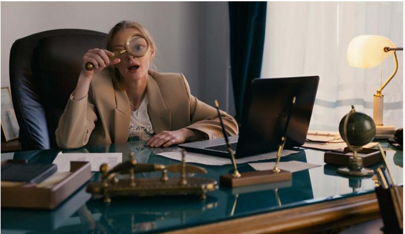
Светлана Ходченкова в фильме «Маме снова 17»