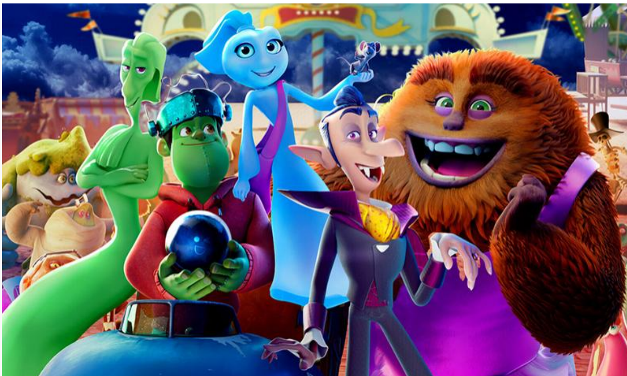
Постер к фильму «Команда монстров»