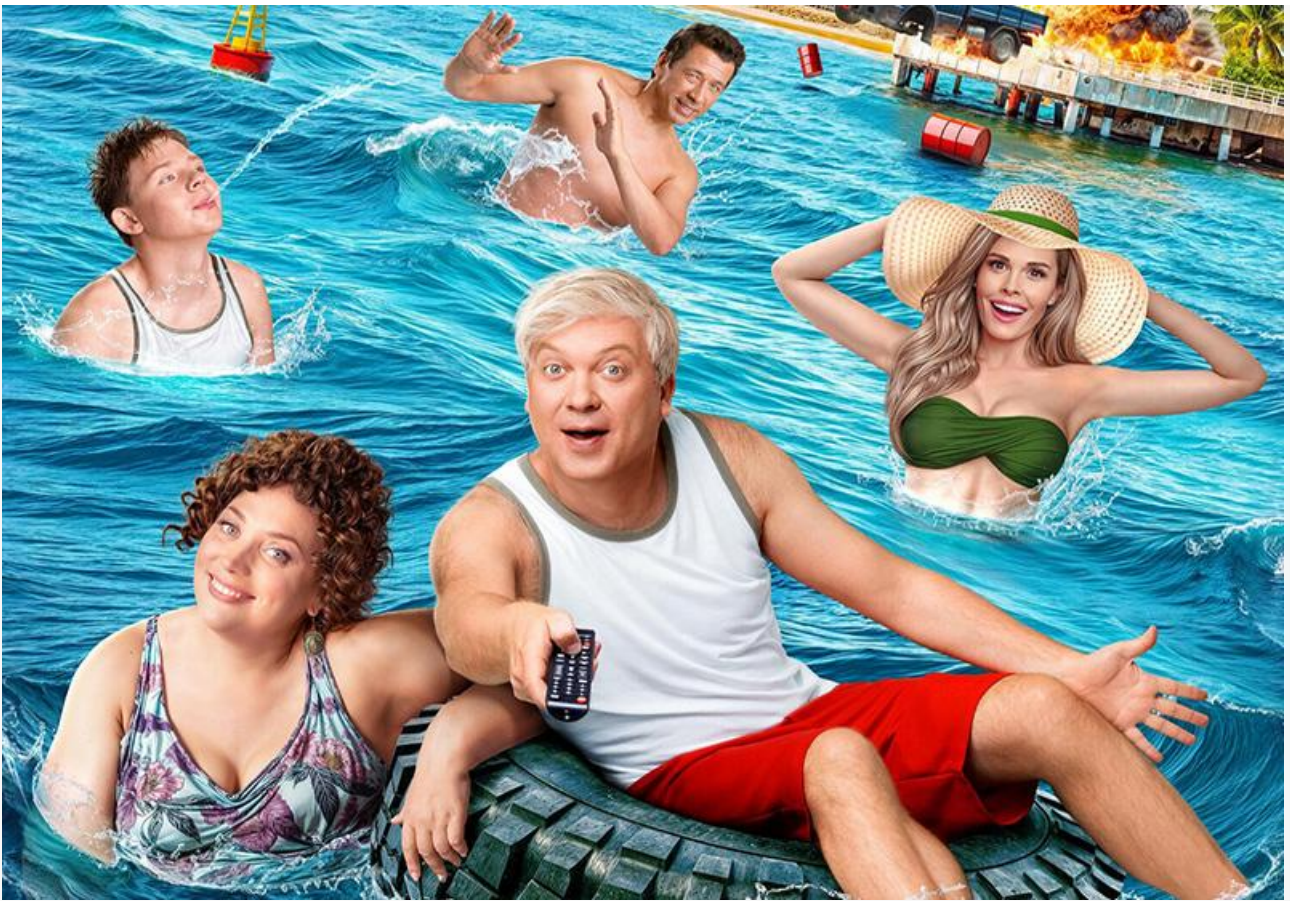
Постер к фильму «Беляковы в отпуске»