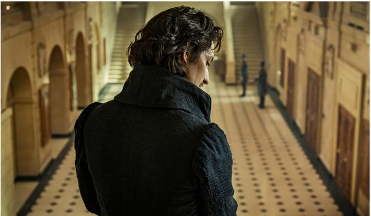
Пьер Нинэ в фильме «Граф Монте-Кристо»

Что касается «Лунтика. Возвращение домой», то мультфильм Константина Бронзита от студии «Мельница» к своему четвёртому уикенду потерял в сборах незначительные 19 % и с доходом 49,9 миллиона опустился на вторую строку чарта. Общие сборы самого кассового анимационного релиза 2024 года составляют 382,3 миллиона рублей.