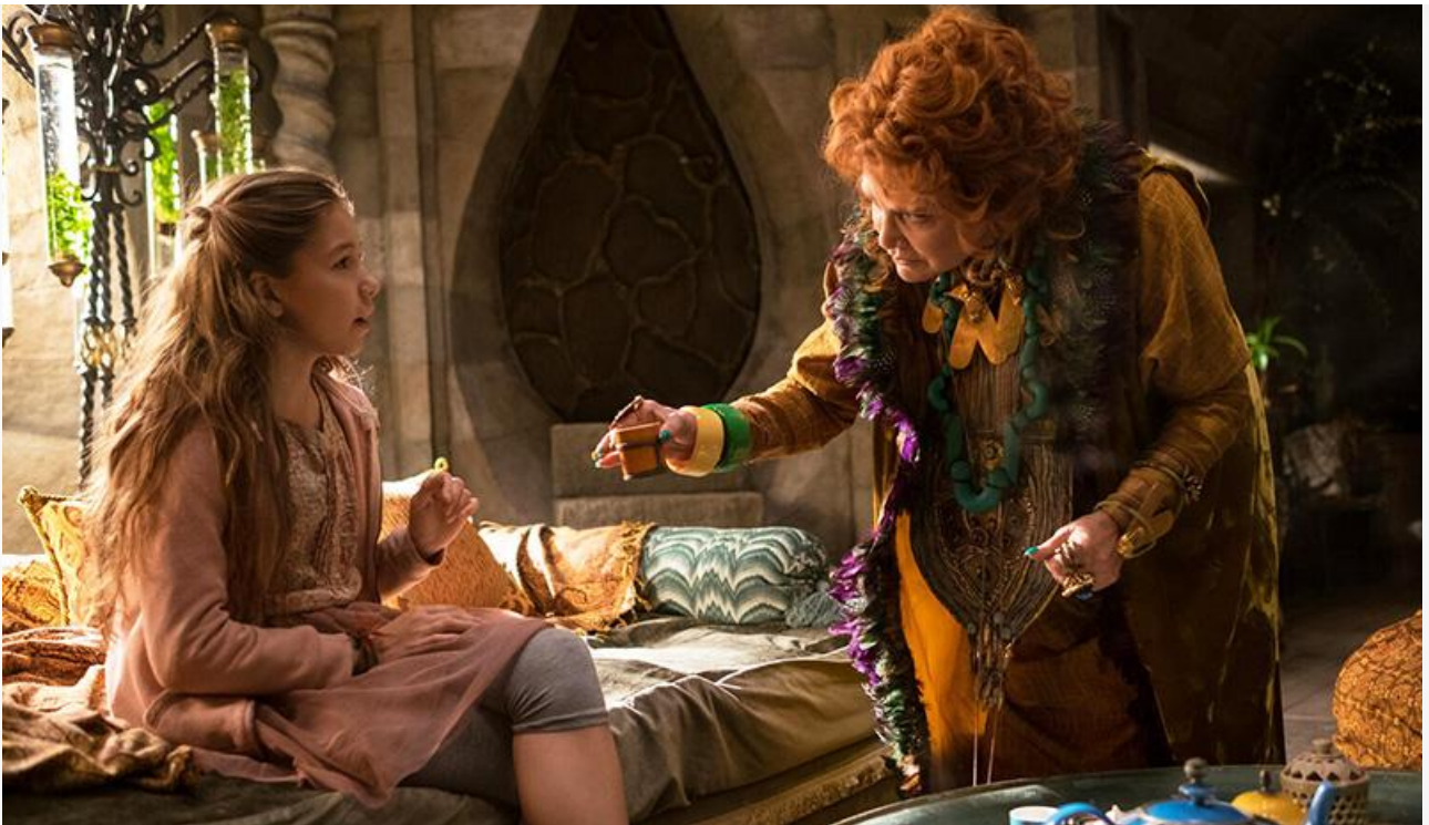
Кадр из фильма «Вайлет в стране чудес»