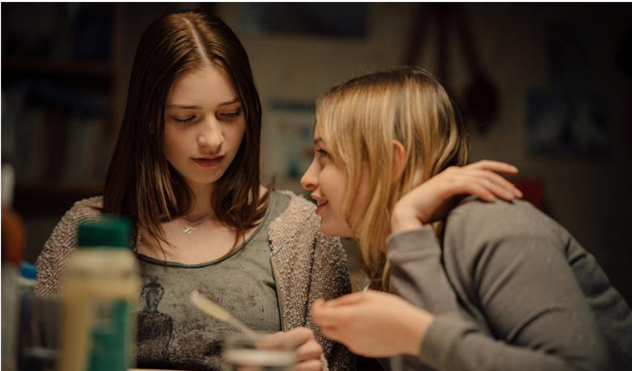
Кадр из фильма «Холли»