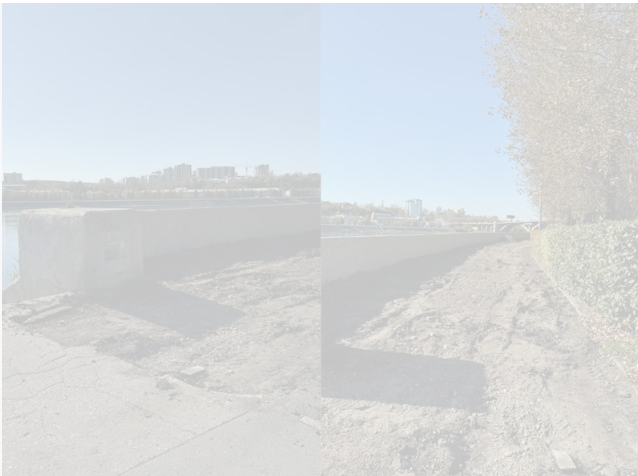
Состояние бульвара Гагарина в сентябре 2024 года

Повторимся, в сентябре . Ровно тогда, когда строительный сезон в Сибири неминуемо подходит к концу. И напомним еще раз, все события – при гробовом молчании со стороны иркутской мэрии.