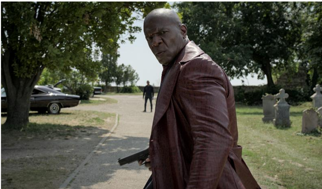
Терри Крюс в фильме «Игра киллера»

В наступившем уикенде сместить «Лунтика» с первого места попытаются американский комедийный боевик Дж. Дж. Петри « Игра киллера » (18+) и отечественная комедия Дениса Гуляра и Гайка Асатряна « Любовь зла » с Катериной Ковальчук и Никитой Кологривым.