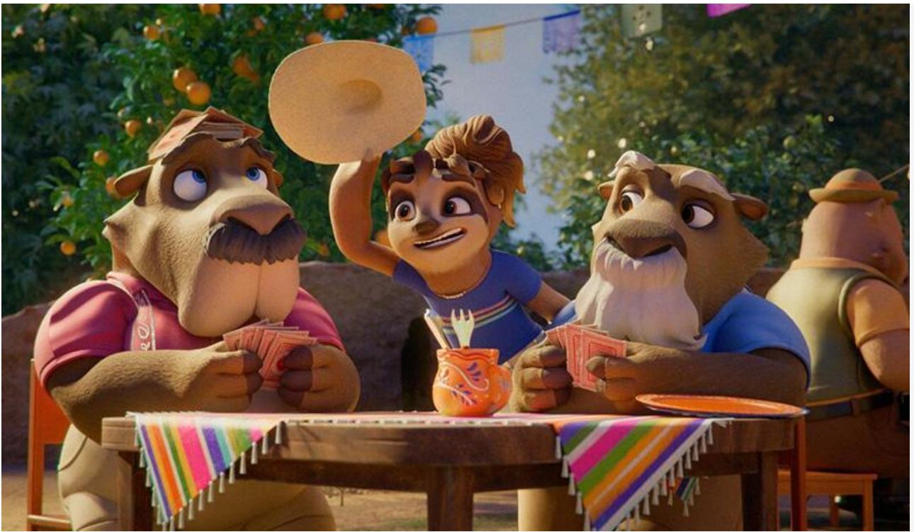
Кадр из фильма «Ленивая семейка»

В формате перевыпуска зрители смогут вновь посмотреть на больших экранах детективный триллер Михаэля Ханеке « Белая лента » (18+), удостоенный в 2009 году «Золотой пальмовой ветви» Каннского кинофестиваля и премии «Золотой глобус» в категории «Лучший фильм на иностранном языке» и криминальную драму Николаса Виндинга Рефна 2011 года « Драйв » (18+) с Райаном Гослингом в главной роли.