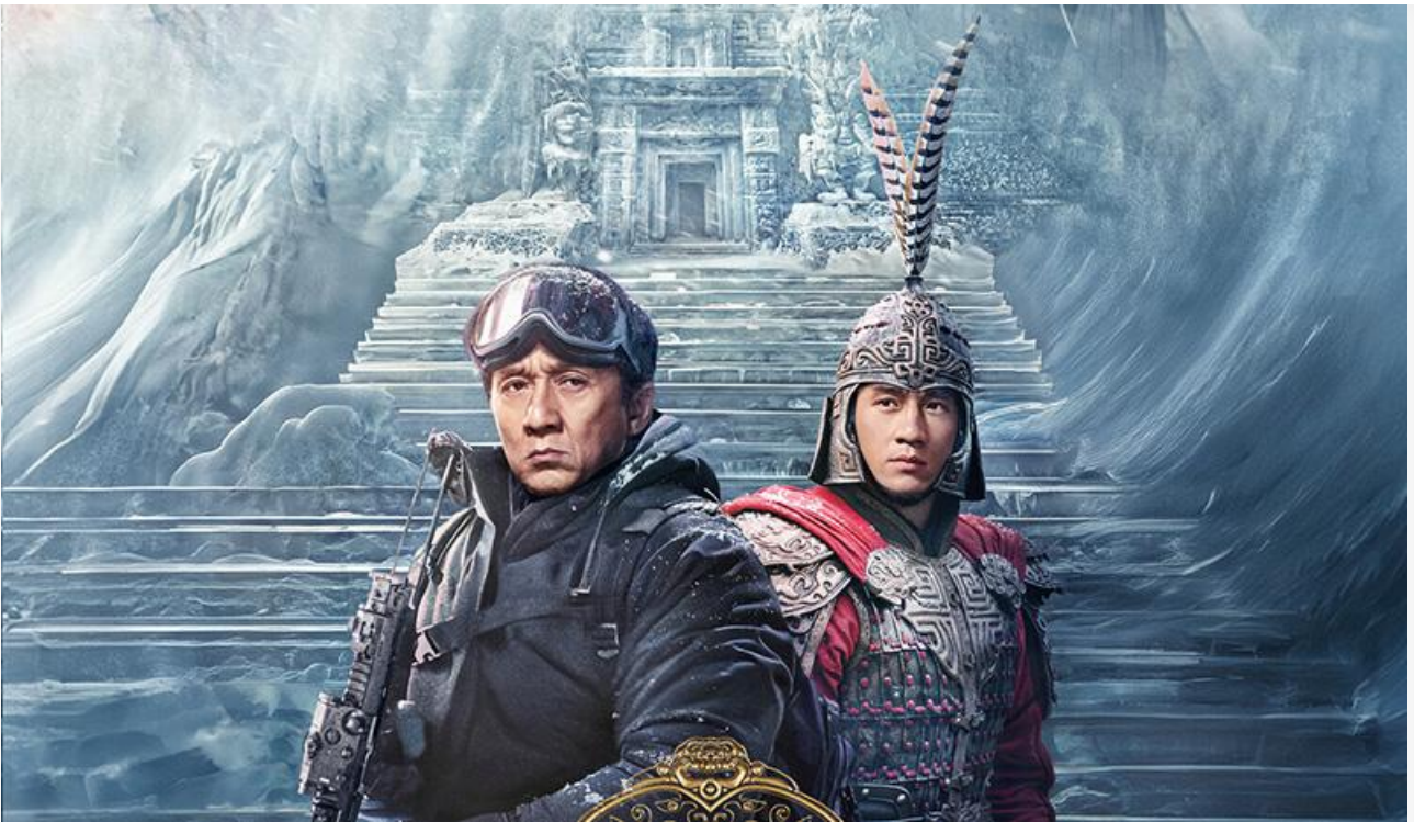
Постер к фильму «Легенда»