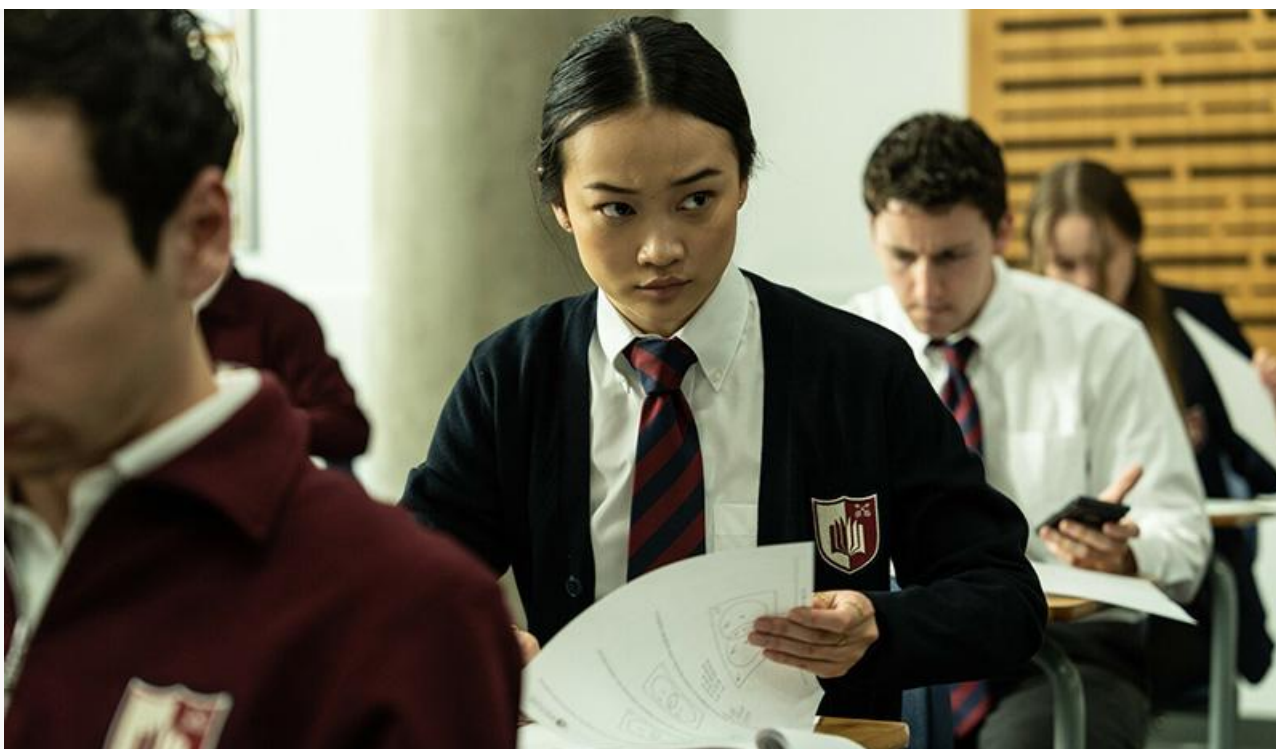
Кадр из фильма «Как взломать экзамен»