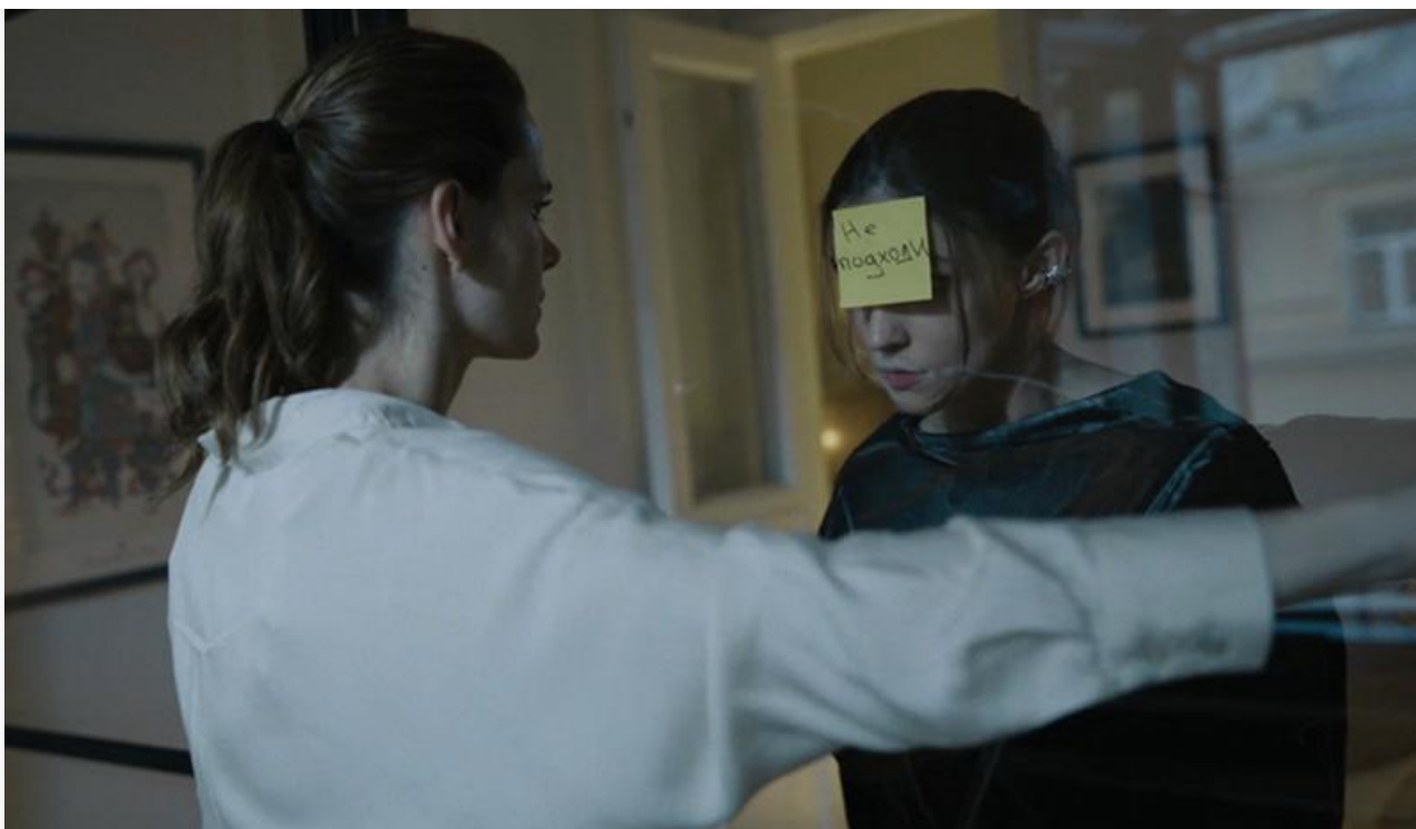
Кадр из фильма «110»