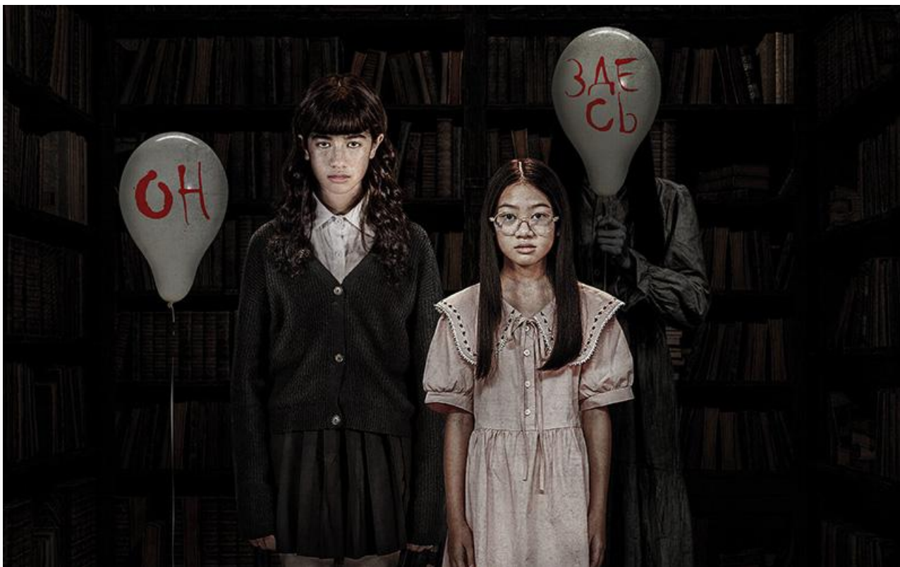
Постер к фильму «Приют. Шёпот призраков»