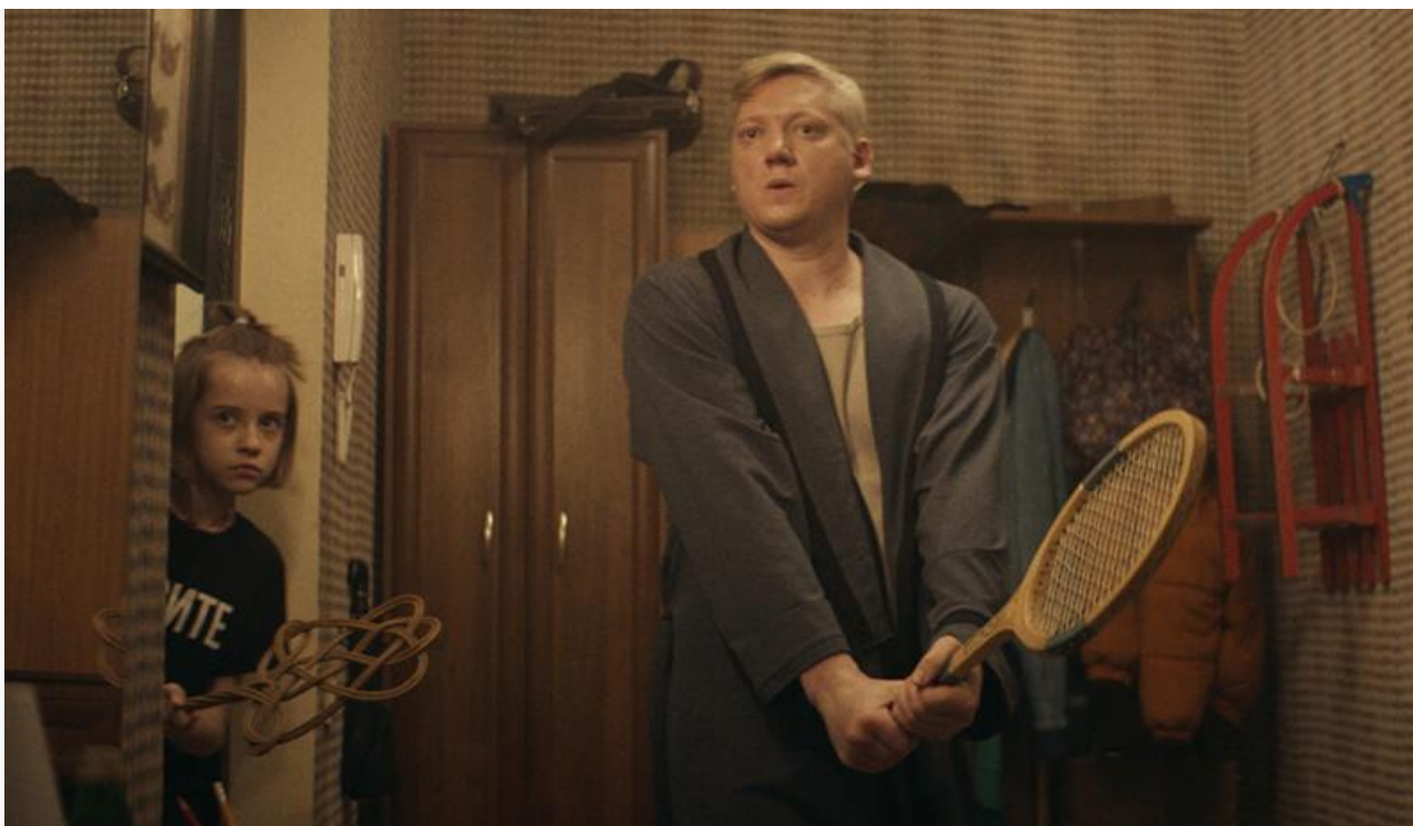
Кадр из фильма «Между нами»