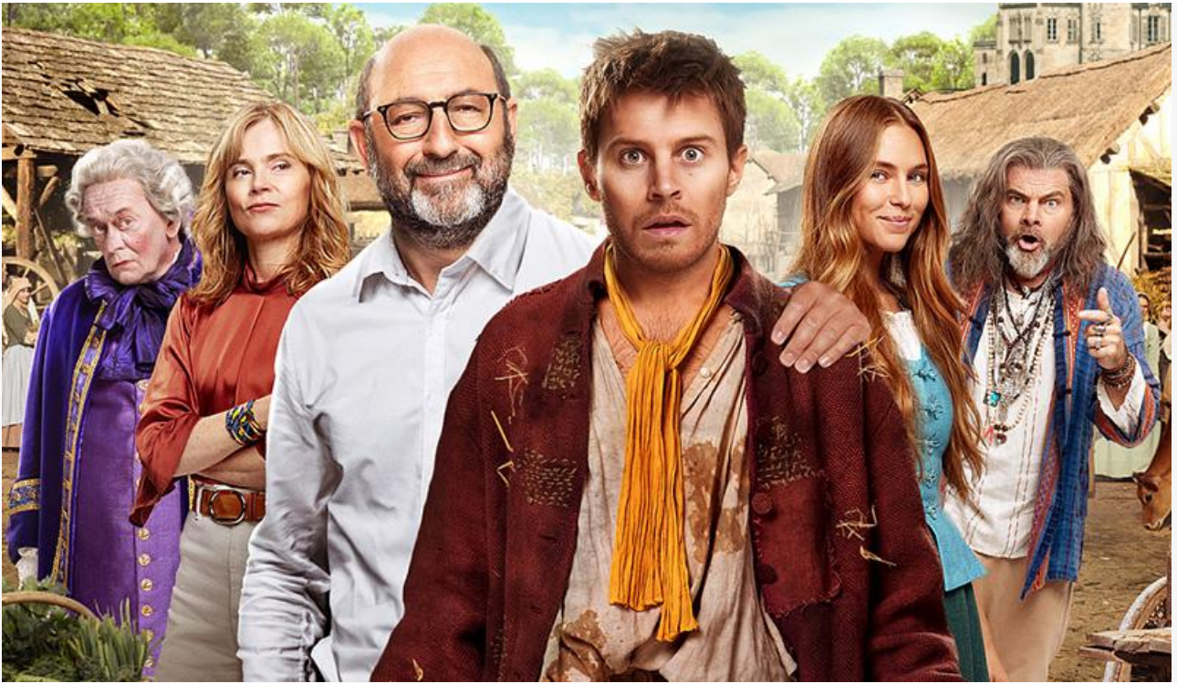
Постер к фильму «Холоп из Парижа»