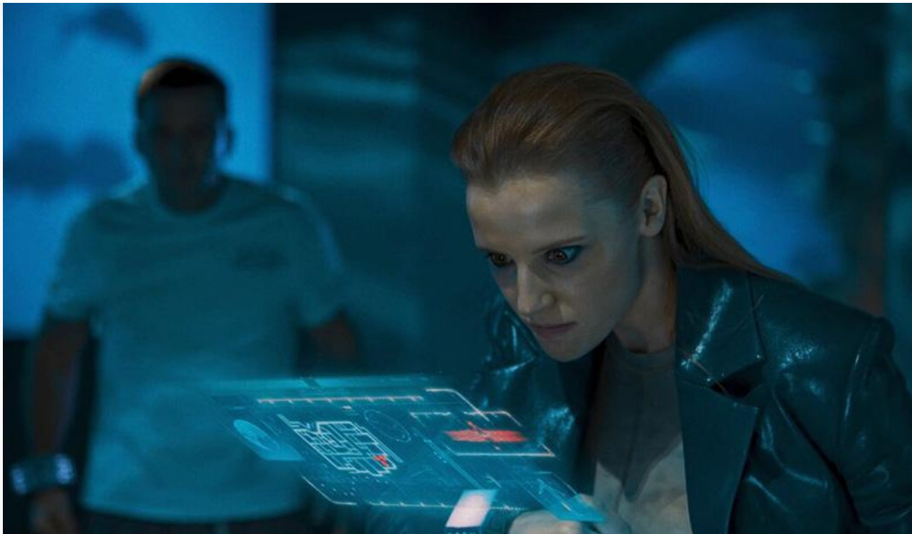
Кадр из фильма «Пираты галактики Барракуда»

Покинули топ-10 «Собиратель душ», «Мой сосед Тоторо», «Меган: К вашим услугам» и «Подростки. Первая любовь».