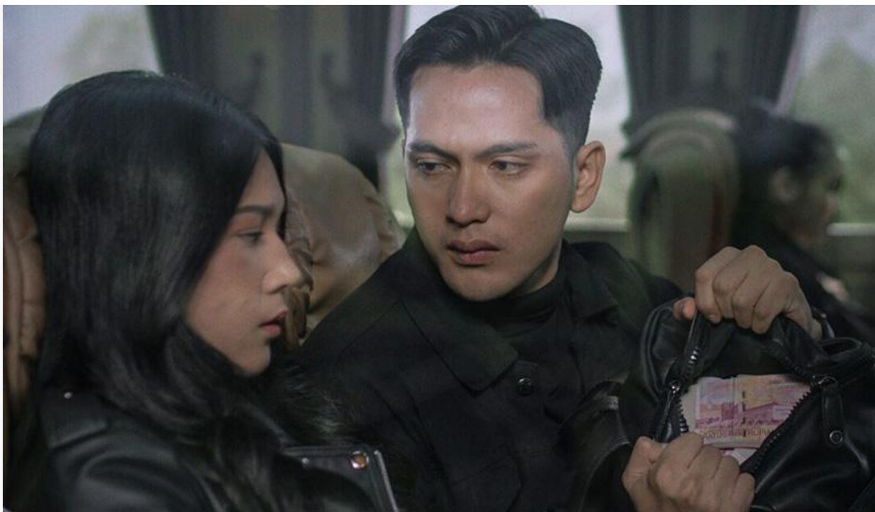
Кадр из фильма «Пункт назначения: Поезд № 13»

Всего 60 тысяч рублей не хватило до заветной десятой строки чарта социальному триллеру Дж. С. Ли « Как взломать экзамен »: 468 экранов, 28,3 зрителя за сеанс, 5,4 миллиона и одиннадцатое место.