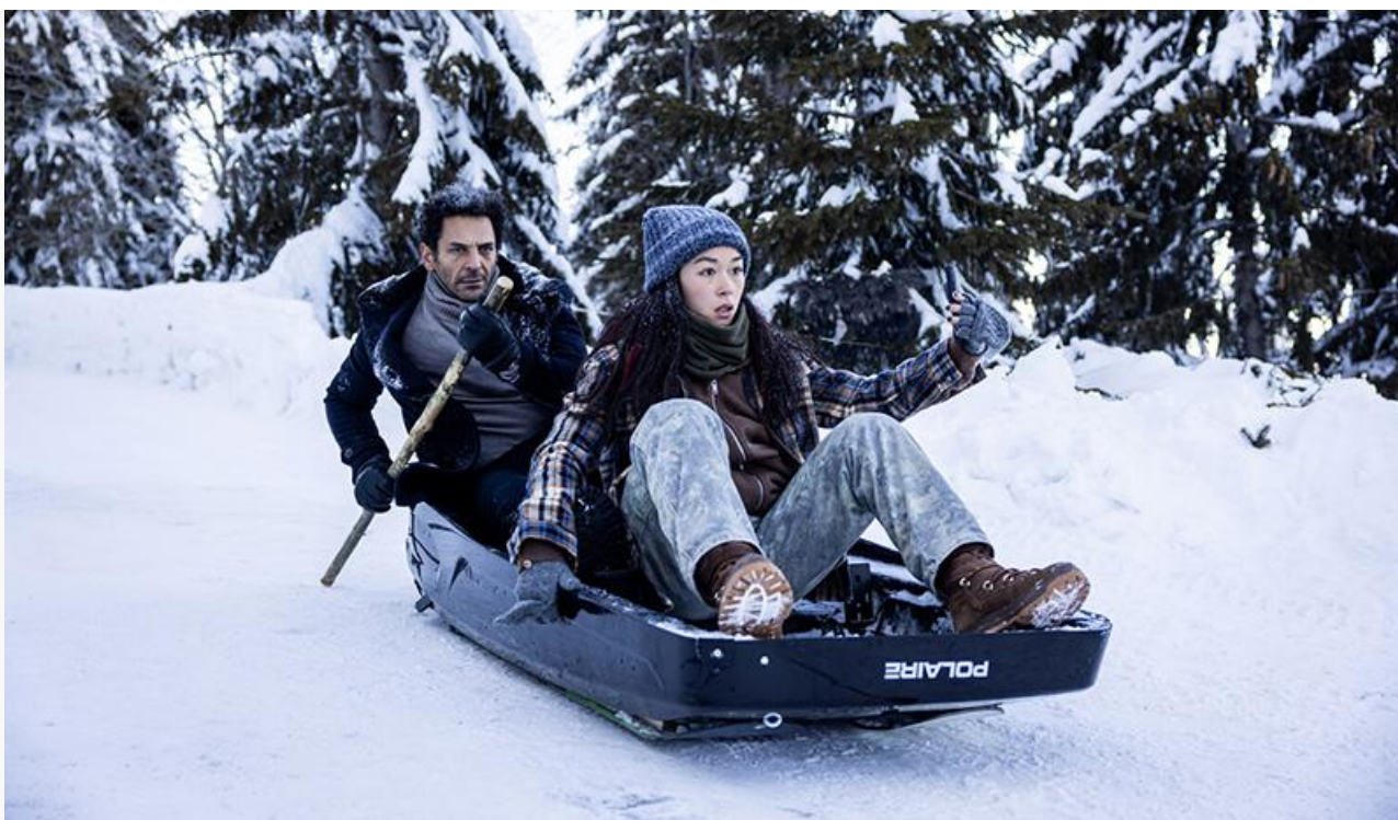
Кадр из фильма «Ларго