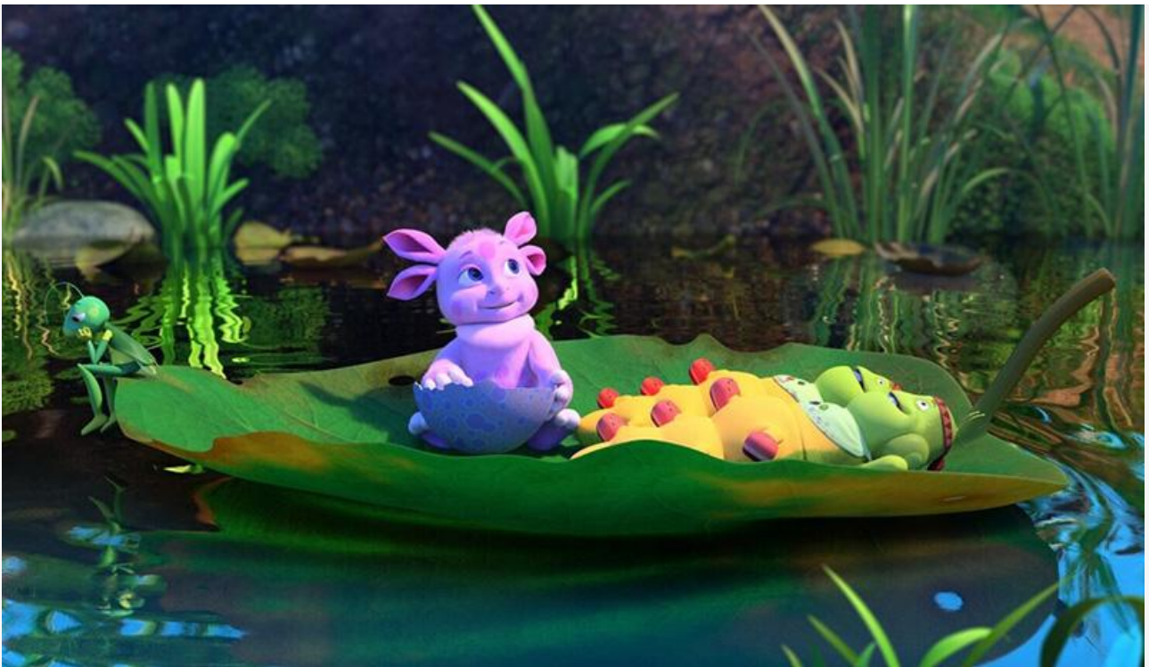
Кадр из фильма «Лунтик. Возвращение домой»

Отметим, что в распоряжении «Лунтика» было рекордное число экранов – 2 232.