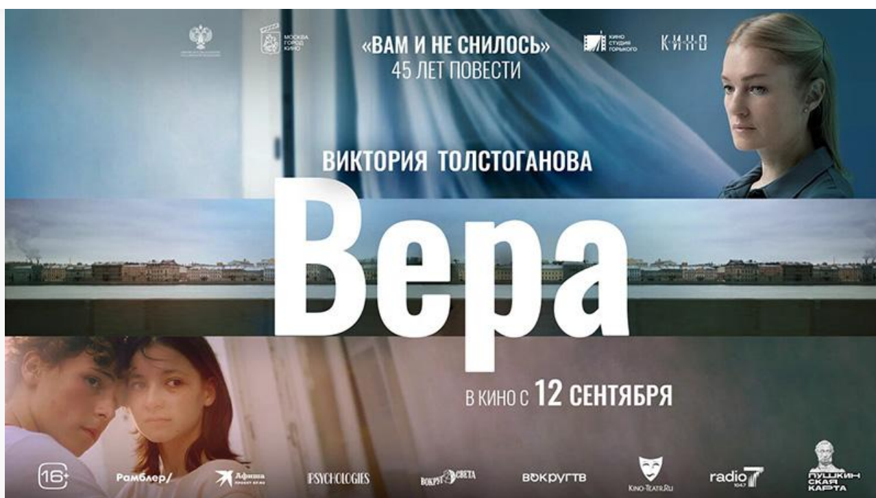
Постер к фильму «Вера»