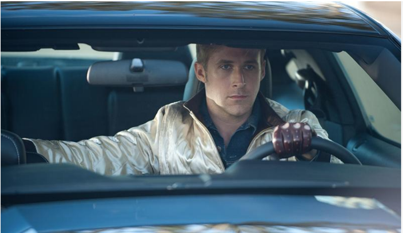
Райан Гослинг в фильме «Драйв»

В формате перевыпуска зрители смогут вновь посмотреть на больших экранах детективный триллер Михаэля Ханеке « Белая лента » (18+), удостоенный в 2009 году «Золотой пальмовой ветви» Каннского кинофестиваля и премии «Золотой глобус» в категории «Лучший фильм на иностранном языке» и криминальную драму Николаса Виндинга Рефна 2011 года « Драйв » (18+) с Райаном Гослингом в главной роли.