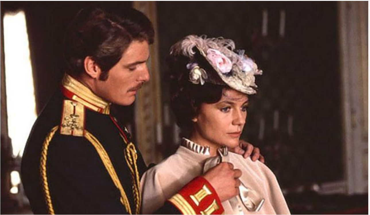
Анна Каренина в фильме «Анна Каренина», 1985 год