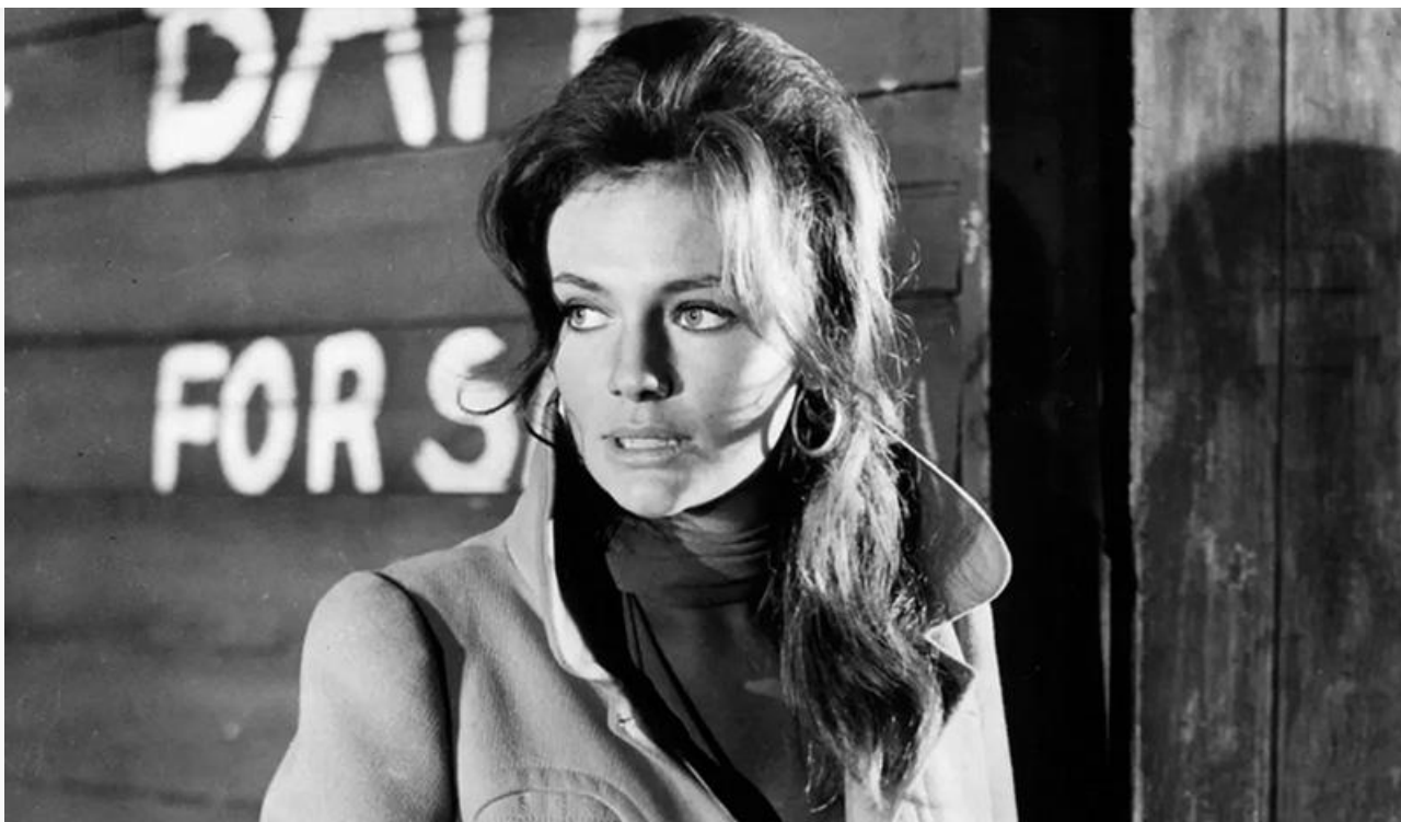
Кэнди в фильме «Кейптаунская афера», 1967 год

Первые главные роли – спецагента Кэнди в шпионском детективе Роберта Уэбба «Кейптаунская афера» и подруги главного героя Кэти в полицейском триллере Питера Йетса «Буллит» – юная красавица сыграла уже в голливудских проектах, вышедших на экраны в 1967 и 1968 годах.