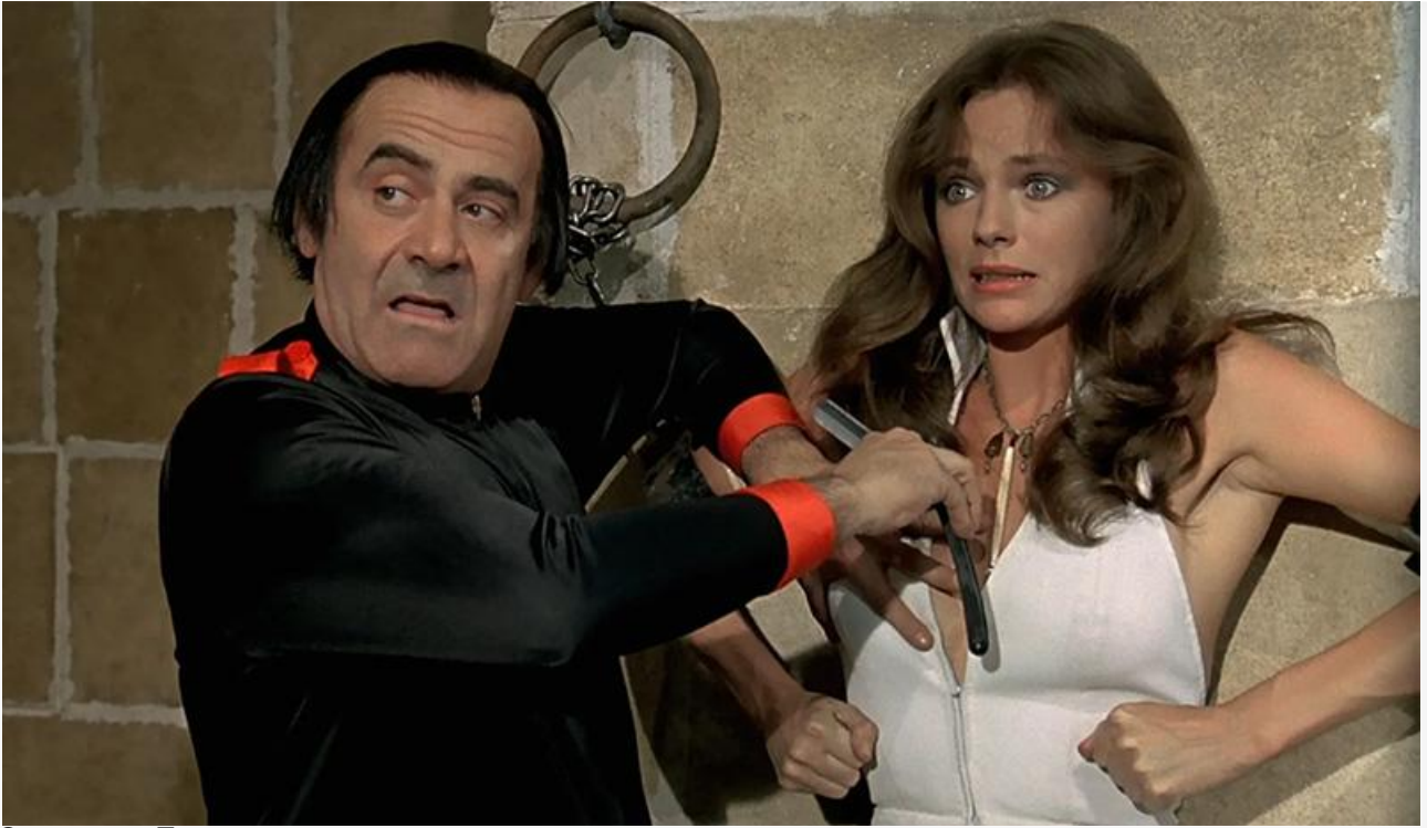
Суперагент Татьяна (Кристин) в фильме «Великолепный», 1973 год