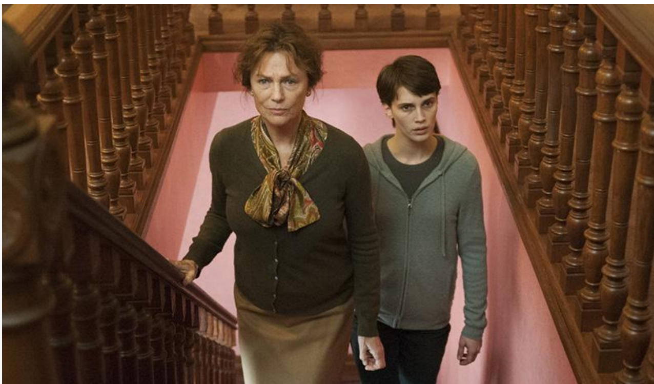
Миссис Шенкер, мать Хлои в фильме «Двуличный любовник», 2017 год

За десять лет до этого 60-летняя Биссет получила «Премиию города» на кинофестивале в Карловых Варах. В 2015 году легенда киноэкрана была удостоена Специального приза «Верю. Константин Станиславский» Московского международного кинофестиваля.