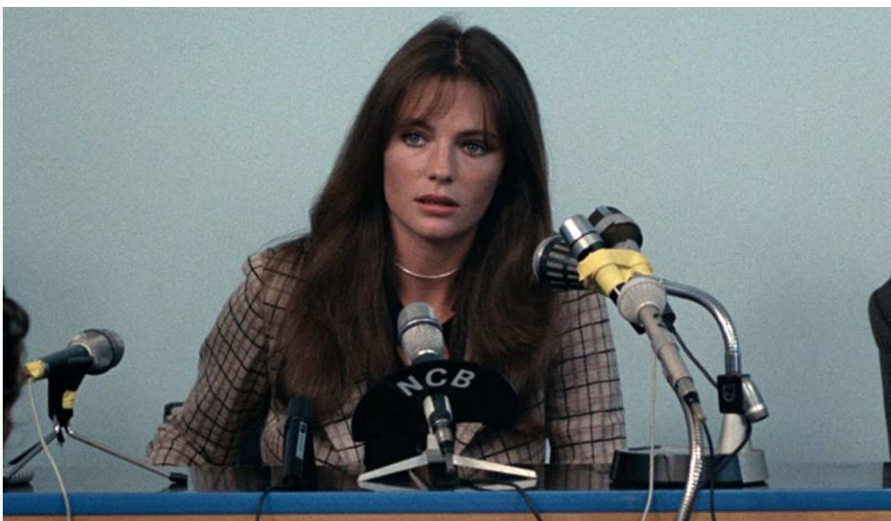
Жюли Бейкер в фильме «Американская ночь», 1973 год