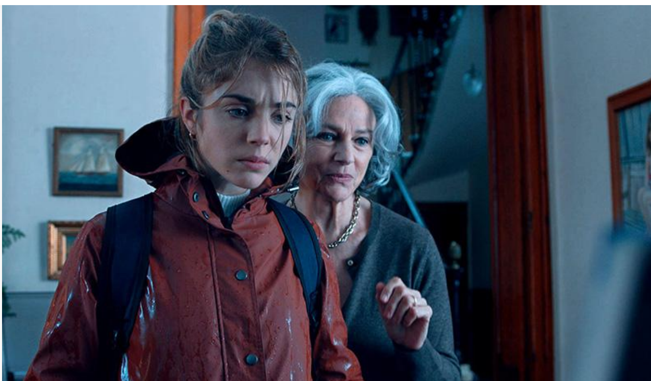
Элизабет в фильме «Наваждение Джули», 2020 год