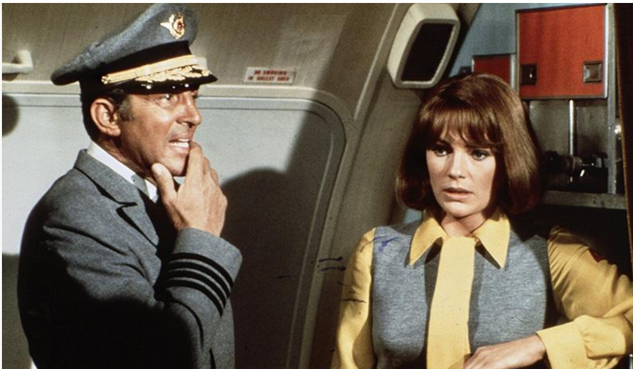
Гвен Мейген в фильме «Аэропорт», 1970 год

После успеха «Бездны» 33-летняя Жаклин Биссет стала не только «популяризатором конкурса мокрых футболок», но и «красивейшей киноактрисой всех времён» по версии американского журнала Newsweek с прилагающимся статусом секс-символа 1970-х.