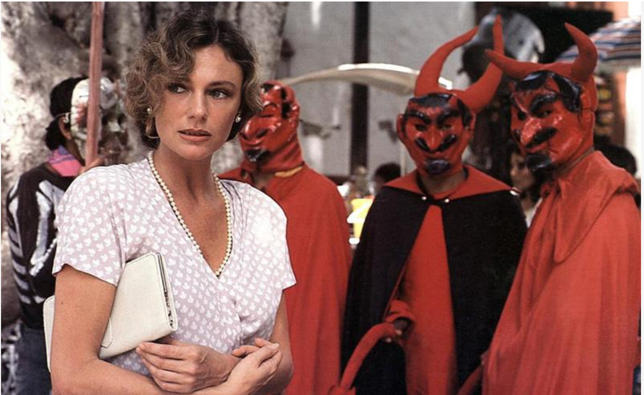
Ивонн Фермин в фильме «У подножия вулкана», 1984 год