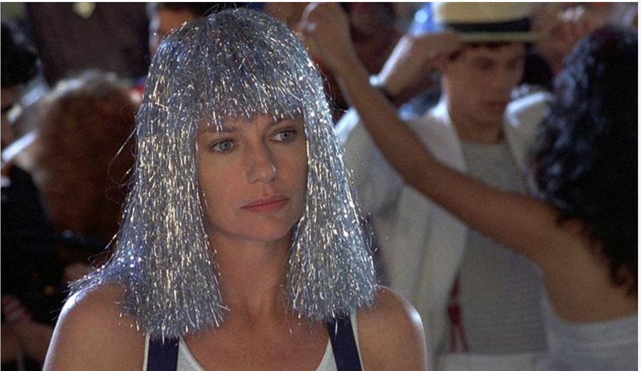
Клаудия в фильме «Дикая орхидея», 1989 год