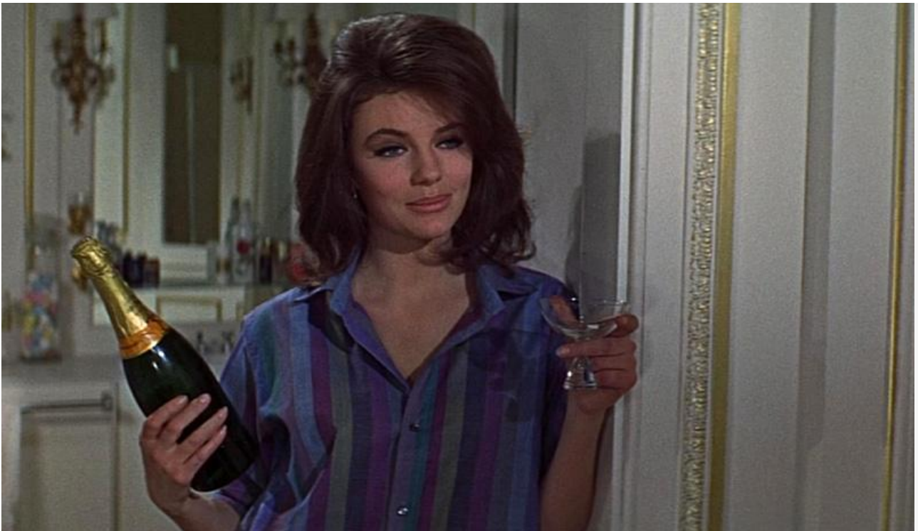
Мисс Гудфингс в фильме «Казино „Рояль“», 1967 год

В кино Жаклин Биссет дебютировала в 1965 году, снявшись в эпизоде комедии Ричарда Лестера «Сноровка... и как её приобрести», получившей «Золотую пальмовую ветвь» Каннского кинофестиваля.