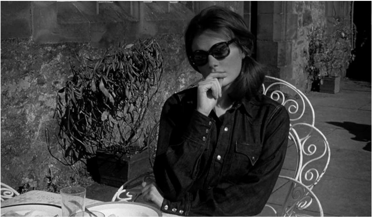
Жаклин в фильме «Тупик», 1966 год