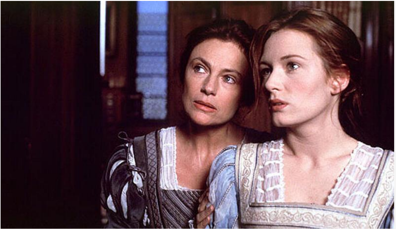
Паола Франко в фильме «Честная куртизанка», 1998 год