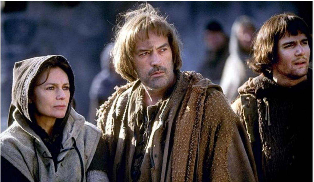
Изабель д'Арк в фильме «Жанна д'Арк», 1999 год

Признания от критиков Жаклин Биссет ждала долго. В 1969 году она была впервые номинирована на премию «Золотой глобус» за роль загадочной Вики Картрайт в драме Харви Харта «Приятная поездка» в категории «Лучшая дебютантка», однако награда досталась Оливии Хасси, сыгравшей в том же году Джульетту у Франко Дзеффирелли.