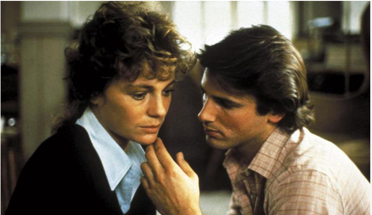
Лиз Гамильтон в фильме «Богатые и знаменитые», 1981 год