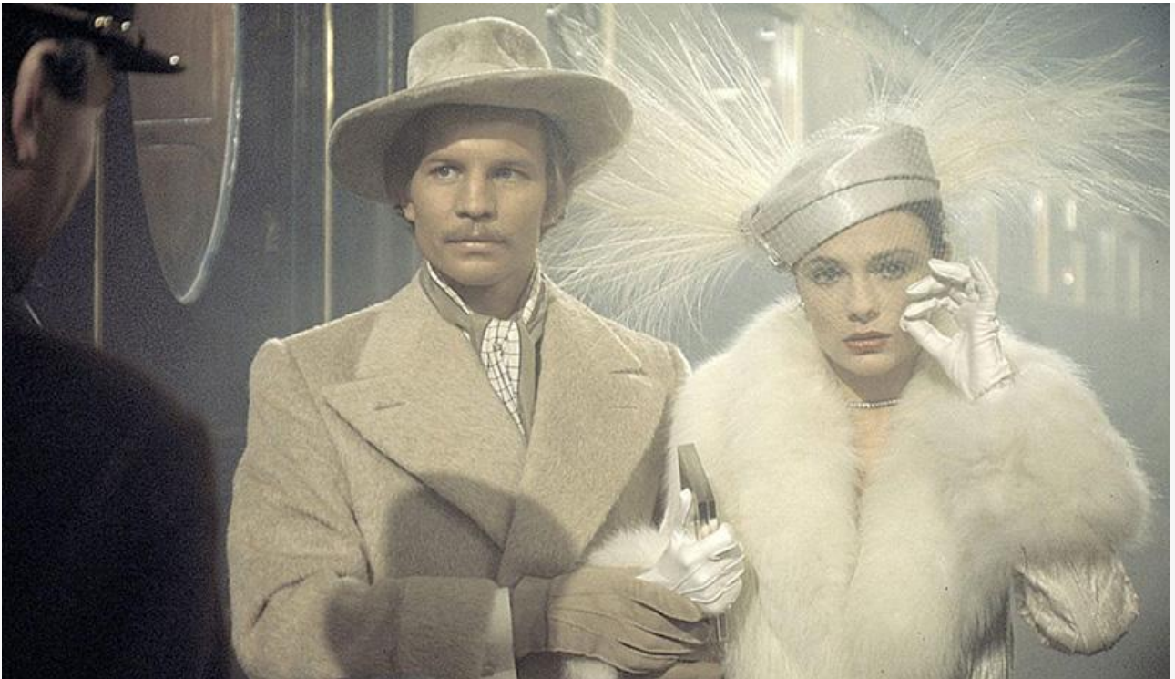
Графиня Андрени в фильме «Убийство в Восточном экспрессе», 1974 год