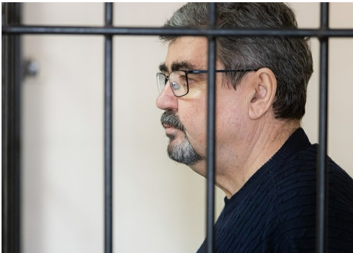
Фото: declarator.org , vtomske.ru

Автор: Андрей Игнатьев © Babr24.com КРИМИНАЛ, РАССЛЕДОВАНИЯ, ТОМСК 👁 13726 11.09.2024, 11:17 👍 178