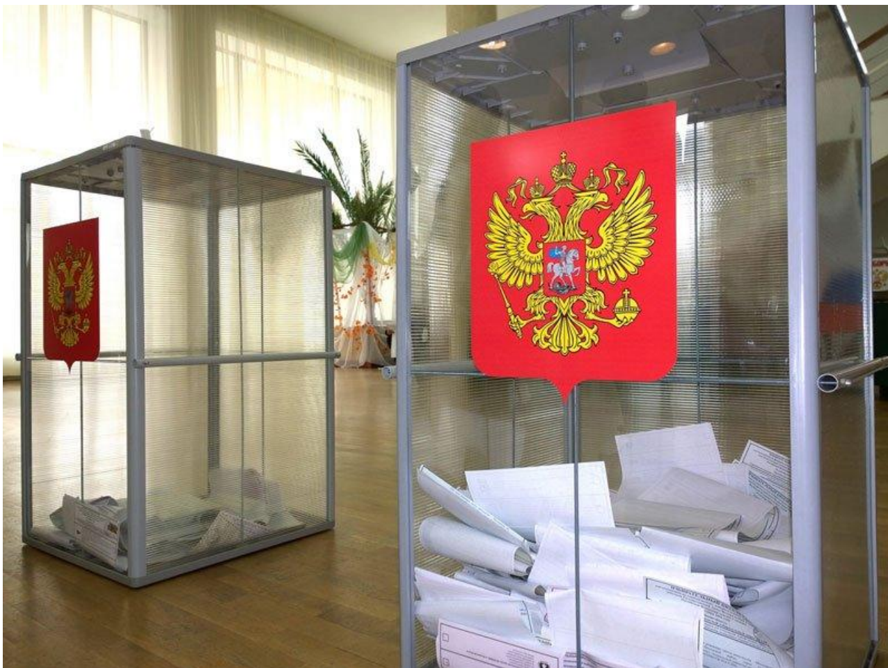
Фото из архива избиркома Иркутской области

Автор: Алина Саратова © Babr24.com ПОЛИТИКА, ИРКУТСК 👁 17773 09.09.2024, 08:21 📌 521 URL: https://babr24.com/?IDE=264691 Bytes: 2163 / 2063 Версия для печати Скачать PDF